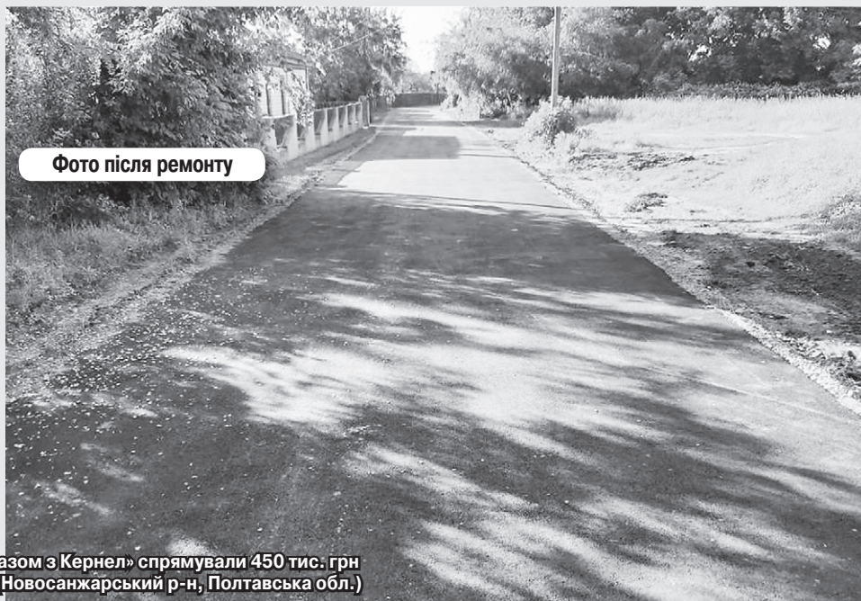
Фото після ремонту

«На території с. Морози розташований тік, його територія практично виходить на дорогу районного значення Кобеляки — Просіяниківка. Саме ця ділянка артерії була у неприглядному вигляді. Отож цієї весни аграрії підприємства «Говтва» (Кернел) взялися за роботу: було розрівняно територію, покладено плити. Упорядкована територія має значення для всього села, адже ще один його кут (велике перехрестя) має гарний вигляд. А Кернел, який постійно допомагає вирішувати багато соціально-значимих для громади справ, ще раз довів, що є гарним господарем. Без цієї Компанії ми не уявляємо сьогодні Днів села, розчищених зимою доріг, обкошених від бур'янів узбіч, та ще багато важливих справ».