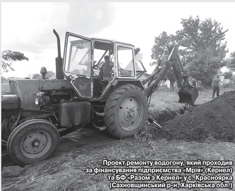
Проект ремонту водогону, який проходив за фінансування підприємства «Мрія» (Кернел) та БФ «Разом з Кернел» у с. Красноярка (Сахновщинський р-н, Харківська обл.)

— Водогоном у двох селах, протяжність якого 5 кілометрів, користувалися у 80 дворах. Водопровід прокладено 30 років тому, певно, нині настав той час, коли там згнили деталі, от і пішли прориви. Як тиждень, так і маємо проблеми, — каже наш співрозмовник. — Зібралися громадою, мовляв, треба згуртуватися, якщо хочемо й надалі бути з водою. Та за основною підтримкою звернулися до Кернел, знаючи, що вони завжди допомагають громадам. Підприємство «Мрія» (Кернел) та БФ «Разом з Кернел» справді допомогли дуже оперативно й дієво. Нам надали в користування башту із молочнотоварної ферми, виділили для роботи екскаватор, який тиждень працював на нашо-