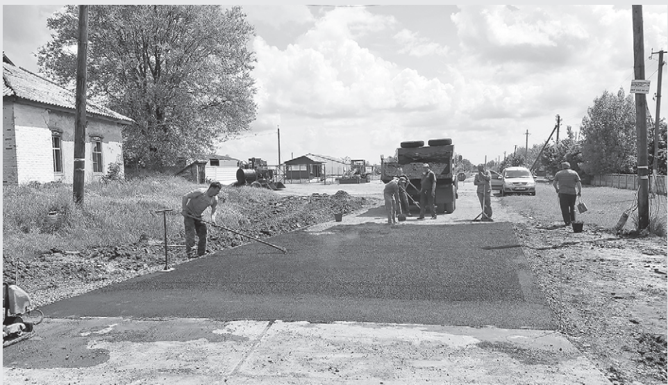
У с. Морози (Кобеляцький р-н, Полтавська обл.) за фінансування підприємства «Говтва» (Кернел) та БФ «Разом з Кернел» пройшов ремонт дорожнього покриття