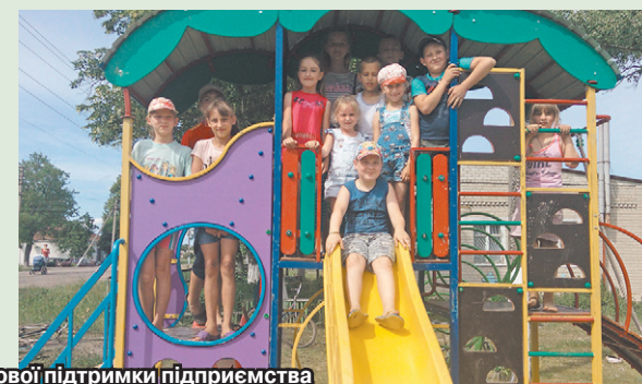
За фінансової підтримки підприємства «Мрія» (Кернел) та БФ «Разом з Кернел» у селах Харківщини відзначили День захисту дітей