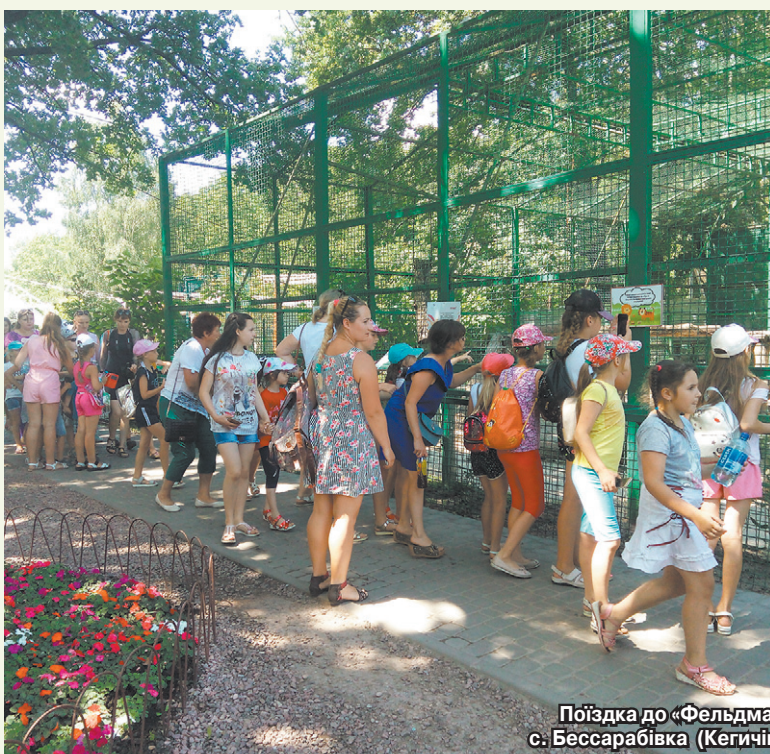
Поїздка до «Фельдман-Екопарку» учнів школи с. Бессараївка (Кегичівський р-н, Харківська обл.)

Подорожі є обов'язковою складовою щастя. У якому б віці ми не були, подорожі наповнюють наше життя новими емоціями, зустрічами, знаннями. Унікальних місць, куди варто здійснити подорож, дуже багато навіть поряд. Ось, наприклад, у Дергачівському районі Харківської області є регіональний ландшафтний парк площею 140,5 га — один з об'єктів природно-заповідного фонду України. Про поїздку сюди мріяли діти села Бессараївка (Кегичівський р-н, Харківська обл.).