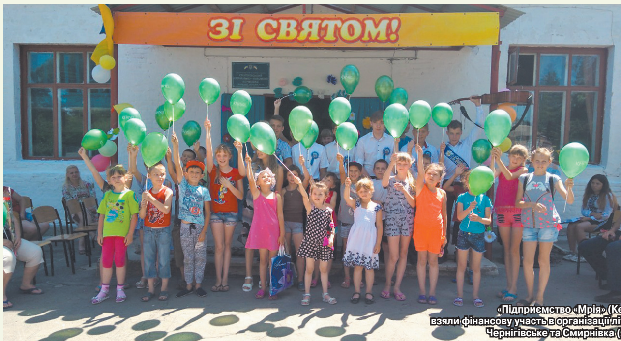
Підприємство «Мрія» (Кернел) та БФ «Разом з Кернел» взяли фінансову участь в організації літнього оздоровлення учнів шкіл сіл Домаха, Чернігівське та Смирнівка (Лозівський р-н, Харківська обл.)