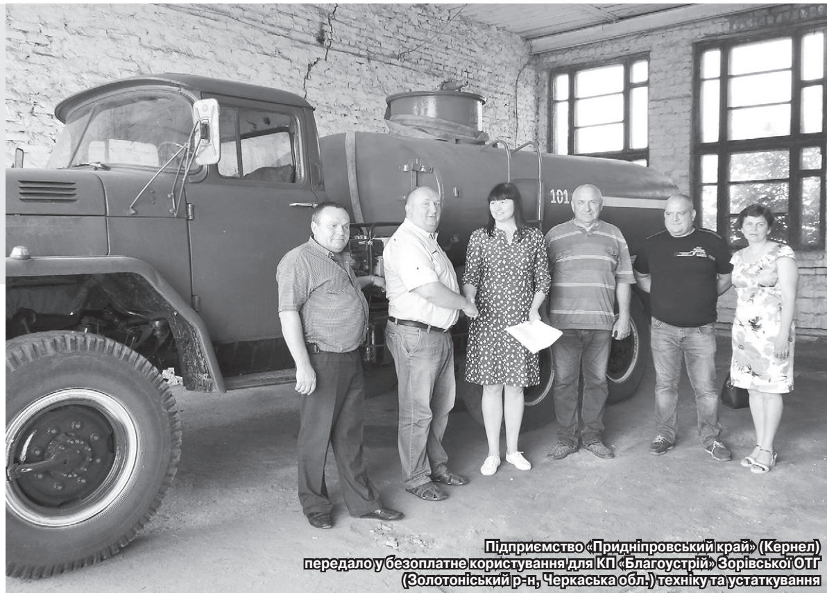
Підприємство «Придніпровський край» (Кернел) передало у безоплатне користування для КП «Благоустрій» Зорівської ОТГ (Золотоніський р-н, Черкаська обл.) техніку та устаткування

— Цього року ми прислухалися до гарного досвіду Кернел і створили комунальне підприємство, яке й назвали «Благоустрій», адже основне його завдання — підтримувати належний рівень порядку на території шести сіл об'єднаної громади, — говорить наш співрозмовник. — Немала територія, і, звичайно, кожного разу просити трактор та інше знаряддя, щоб покосити узбіччя чи вивезти сміття, це постійно відволікати людей від основної роботи, підлаштовуватися одне під одного. Те, що рішення організувати комунальне підприємство було правильним, громада уже