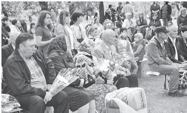
Святкування Дня села Чевельча (Оржицький р-н, Полтавська обл.) разом з Кернел