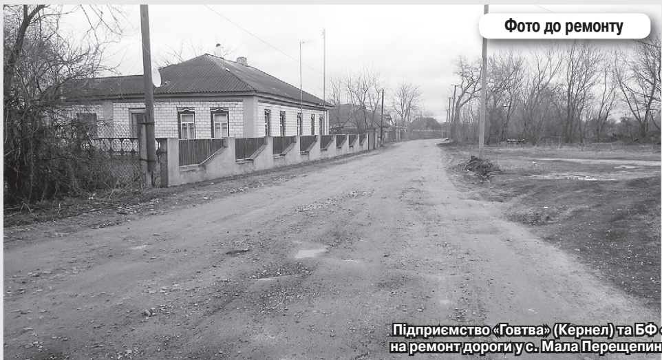
Фото до ремонту