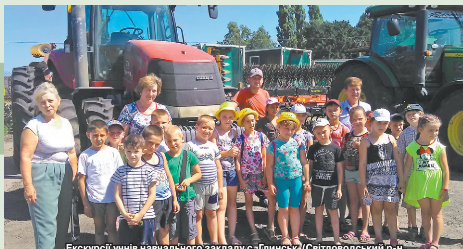
Екскурсії учнів навчального закладу с. Глинськ (Світловодський р-н, Кіровоградська обл.) на МТБ підприємства «Говтва» (Кернел)

Учасники незабутньої екскурсії висловлювали щирі вдячності за такий цікавий день, за дружні партнерські стосунки, які з кожною доброю справою тільки зміцнюються.