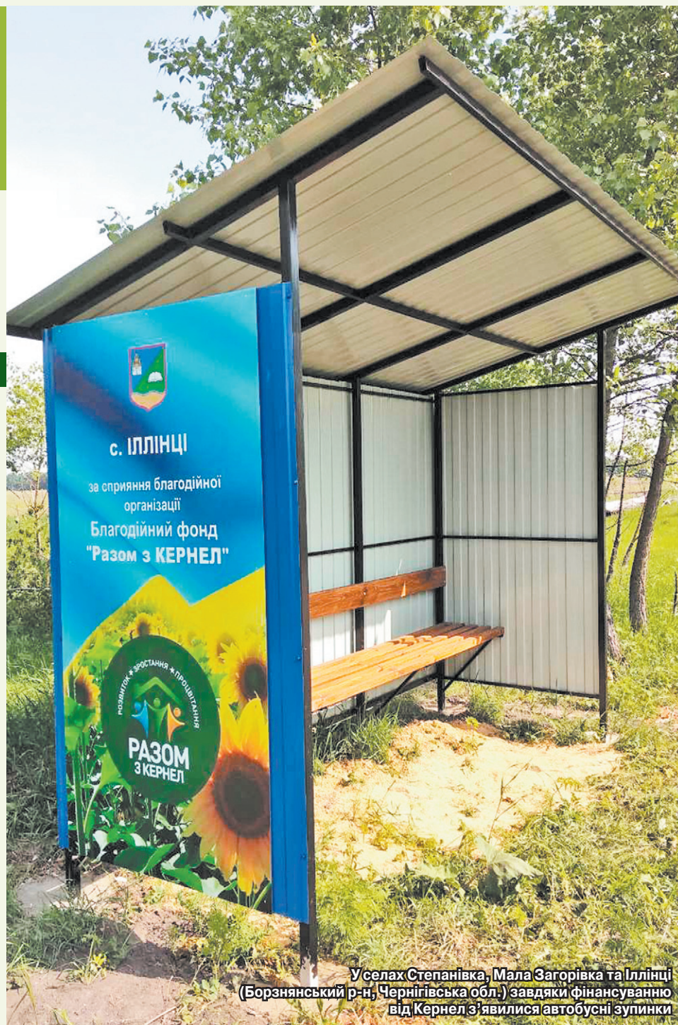
У селах Степанівка, Мала Загорівка та Іллінці (Борзнянський р-н, Чернігівська обл.) завдяки фінансуванню від Кернел з'явилися автобусні зупинки

«Прохання про встановлення нової зупинки прозвучало на зборах орендодавців з менеджментом підприємства «Дружба-Нова» (Кернел) та БФ «Разом з Кернел». Аграрії з рішенням не забарилися, оперативно виконали прохання сільських мешканців. Встановлена зупинка сподобалася всім, адже вона простора, сама конструкція обіцяє надійний захист і від вітру, і від дощу. Хоч Іллінці невеликі, але потреба користуватися транспортом, що йде повз село, завжди є. Хтось їде у справах, до когось діти приїждять і їх зустрічають-проводжають. Тепер є де посидіти в очікуванні транспорту, сховатися від негоди. Люди були щиро вдячні представникам Кернел, які відгукнулися на їхнє прохання, і швидко на нього відреагували. Все зроблено з повагою до громадян. Нову зупинку навіть урочисто відкрили, настрій був святковий,