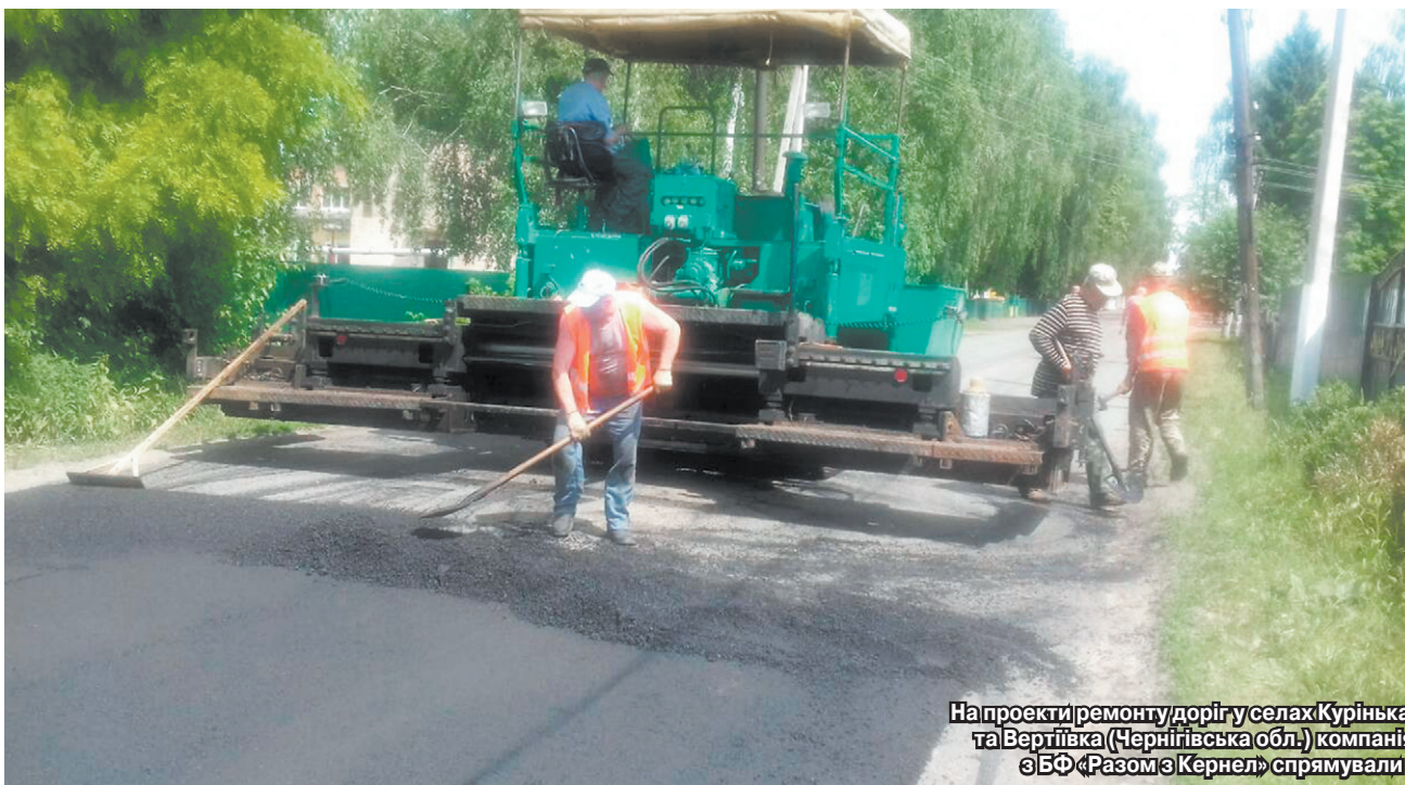
На проекти ремонту доріг у селах Курінька (Полтавська обл.) та Вертіївка (Чернігівська обл.) компанія Кернел спільно з БФ «Разом з Кернел» спрямували 350 тис. грн