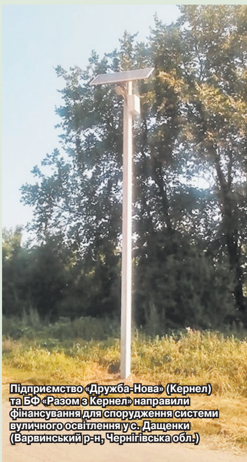
Підприємство «Дружба-Нова» (Кернел) та БФ «Разом з Кернел» направили фінансування для спорудження системи вуличного освітлення у с. Дащенки (Варвинський р-н, Чернігівська обл.)

Були й інші, хай і не такі дороговартісні, але також потрібні для села справи. Наприклад, за сприяння підприємства «Дружба-Нова» (Кернел) та БФ «Разом з Кернел» було відремонтовано пам'ятник Невідомому солдату. Встановлено нові гранітні плити, на яких викарбувано до 200 імен героїв-захисників рідної землі. Тепер пам'ятник у належному стані, людям приємно, що пам'ять не зникає, а навпаки підтримується ось такими хорошими справами.