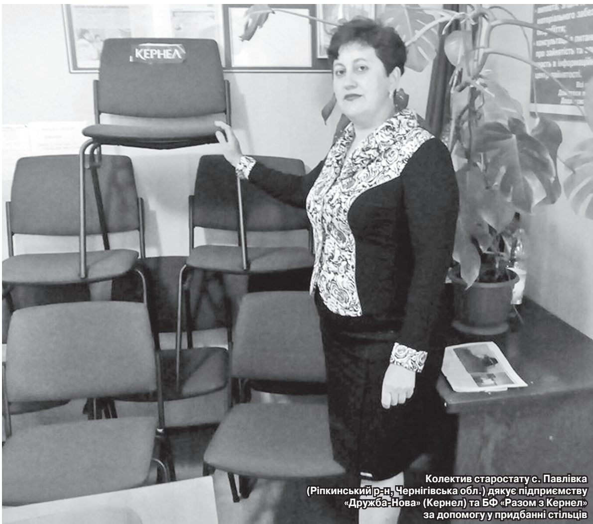
Колектив старостату с. Павлівка (Ріпкинський р-н, Чернігівська обл.) дякує підприємству «Дружба-Нова» (Кернел) та БФ «Разом з Кернел» за допомогу у придбанні стільців

Щомісяця на адресу нашої редакції приходять безліч листів від вдячних жителів підопічних територій компанії Кернел — керівників соціальних установ, очільників сільських рад, пайовиків. І щоразу, перечитуючи їх, розумієш, що агропідприємства Компанії дійсно роблять добрі справи на благо розвитку населених пунктів, є помічниками у вирішенні багатьох проблем українців.