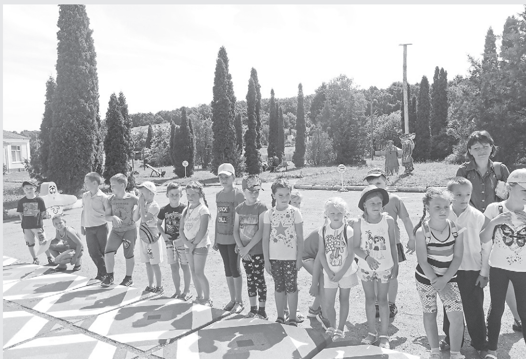
У червні за фінансової підтримки Кернел літні пришкільні табори діяли у десятках шкіл Чернігівщини, Сумщини та Полтавщини