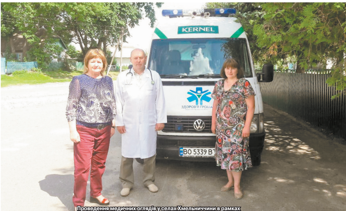
Проведення медичних оглядів у селах Хмельниччини в рамках програми «Здоров'я громад», яка реалізовується підприємством «Енселко Агро» (Кернел) та БФ «Разом з Кернел»

«Серед перших відвідувачів «мобільної» медицини було троє діток з мамами, прийшли люди різного віку, щоб почути кваліфіковані поради. Серед сільських буднів важко знайти час, щоб поїхати до лікарні, здати аналізи, проконсультуватися. А ось коли лікар поряд, послуга надається безкоштовно, про що також подбала Компанія, тоді розумієш, що треба сходити, про тебе ж подбали. Загалом, відгуки перших відвідувачів дуже позитивні, думаю, така мобільна медична допомога дуже потрібна. Спасибі за нову ініціативу нашим аграріям, хай у всіх буде здоров'я, адже це — невід'ємна частина благополуччя».