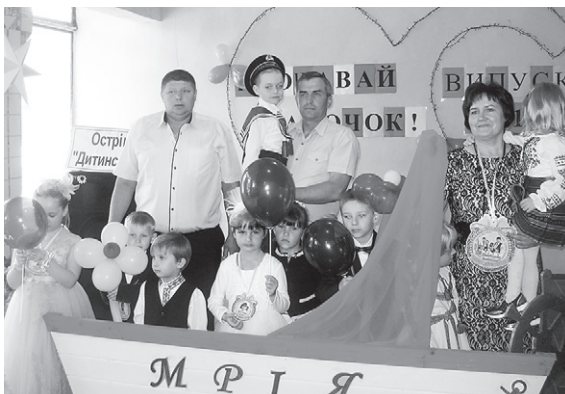
Випускні урочистості, які проходили у дитячому садочку с. Лонки (Волочиський р-н, Хмельницька обл.) за участю представників підприємства «Енселко Агро» (Кернел)

«У нашому невеличкому дошкільному навчальному закладі випускний — це велике свято для всього села. До місцевого клубу приходять усі, незалежно від віку, бо дитячий садочок — то розрада, позитив від найменших мешканців села. Цьогоріч випускників у «Веселин-