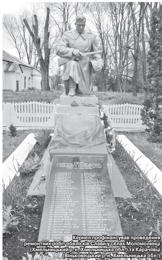
Кернел профінансував проведення ремонтних робіт обелісків Слави у селах Моломолинці (Хмельницький р-н, Хмельницька обл.) та Карачіївці (Вінковецький р-н, Хмельницька обл.)

«На території сільської ради є чотири пам'ятники, присвячені періоду лихоліття 1941-1945 років. У кожному, навіть найменшому селі Бистриця ми підтримуємо належний стан пам'ятників, адже вони — частина історії. Цього року підприємство «Енселко Агро» (Кернел) та БФ «Разом з Кернел» виділили кошти на ремонтно-оздоблювальні роботи. Тож усі пам'ятники у чотирьох селах — Карачіївці, Калюсик, Бистриця, Майдан-Карачівецький — були підшукатурені та підфарбовані, що надало їм оновленого вигляду».