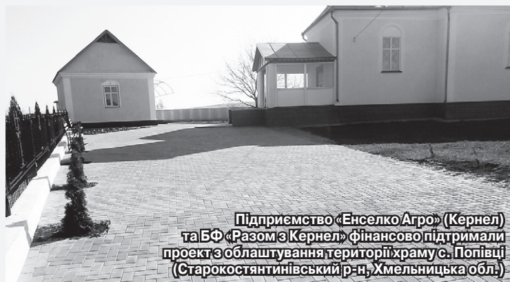
Підприємство «Енселко Агро» (Кернел) та БФ «Разом з Кернел» фінансово підтримали проект з облаштування території храму с. Попівці (Старокостянтинівський р-н, Хмельницька обл.)

Серед багатьох соціальних проектів, які фінансуються агропідприємствами Кернел та БФ «Разом з Кернел», чимало таких, що стосуються підтримки релігійних громад. На ремонти сільських храмів, внутрішнє оформлення споруд, навіть на будівництво нових церков Компанія виділяє кошти, щоб духовне відродження тривало, а віра була життєдайним джерелом.