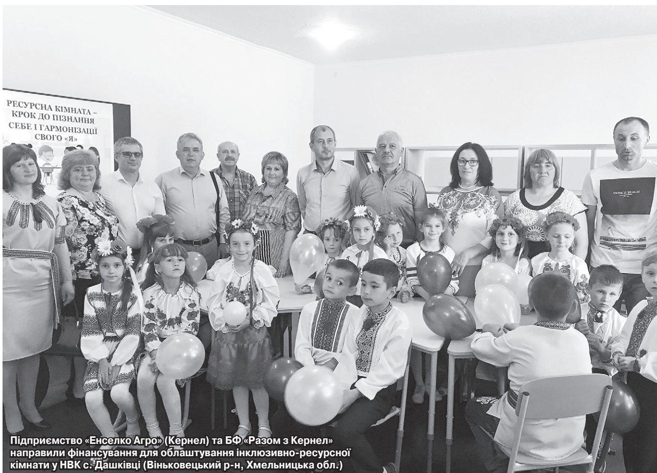
Підприємство «Енселко Агро» (Кернел) та БФ «Разом з Кернел» направили фінансування для облаштування інклюзивно-ресурсної кімнати у НВК с. Дашківці (Вінківський р-н, Хмельницька обл.)

«На часі у нашому навчально-виховному комплексі — ремонтні роботи. Це велика ділянка роботи, адже школа розташована у приміщенні 1936 року побудови, класні кімнати високі, коридори — просторі. Ми дуже потребували коштів на придбання фарби для проведення ремонтних робіт. Звернулися до компанії Кернел, яку я називаю найпотужнішим нашим інвестором, і вже маємо білі й кольорові фарби для роботи. Самі роботи з фарбування виконаємо силами батьків, учителів, технічного персоналу, все буде зроблено вчасно та якісно, адже