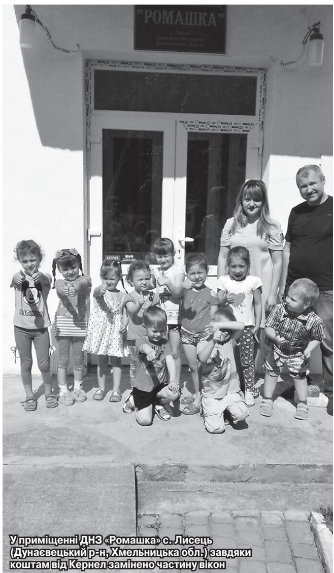
У приміщенні ДНЗ «Ромашка» с. Лисець (Дунаєвецький р-н, Хмельницька обл.) завдяки коштам від Кернел замінено частину вікон

Компанія Кернел спільно з БФ «Разом з Кернел» завжди допомагають осередкам освіти, за фінансування цих аграріїв реалізуються сотні проектів із підтримки шкіл та дитячих садочків. З настанням літніх канікул, коли стихає дитячий гамір у шкільних коридорах, підтримка від Кернел не зменшується, радше навпаки — найбільша частина допомоги надається саме влітку, бо це гаряча пора підготовки закладів до нового навчального року, проведення ремонтів, покращення матеріально-технічної бази. Червень тільки розпочався, а Компанія вже дієво відгукнулася на звернення шкіл та садочків.