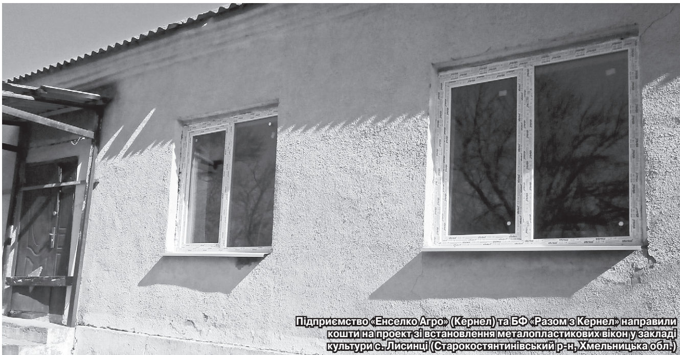
Підприємство «Енселко Агро» (Кернел) та БФ «Разом з Кернел» направили кошти на проект зі встановлення металопластикових вікон у закладі культури с. Лисинці (Старокостянтинівський р-н, Хмельницька обл.)