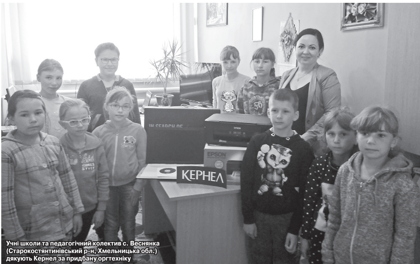
Учні школи та педагогічний колектив с. Веснянка (Старокостянтинівський р-н, Хмельницька обл.) дякують Кернел за придбану оргтехніку

Зокрема, підприємство «Енселко Агро» (Кернел) та БФ «Разом з Кернел» виділили кошти для закладів Хмельниччини, а саме на придбання будівельних матеріалів для упорядкування спортивної зали школи с. Чернелівка (Красилівський р-н), оргтехніки для школи с. Веснянка та будматеріалів для ремонту школи с. Сковородки (Старокостянтинівський р-н), а також на придбання металопластикових вікон та дверей для ДНЗ «Ромашка» с. Лисець (Дунаєвецький р-н) та школи с. Отроків (Новоушицький р-н); два проекти стосуються інклюзивної освіти — у с. Дашківці (Вінківський р-н) та с. Сахнівці (Старокостянтинівський р-н).