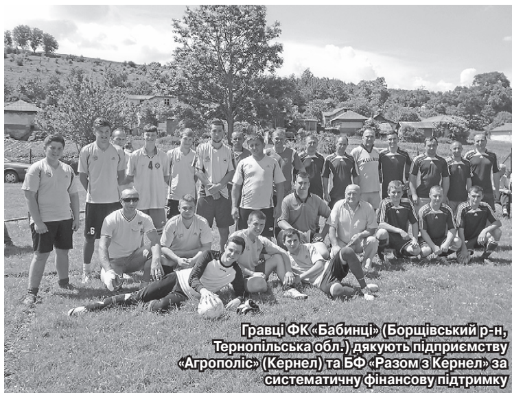
Гравці ФК «Бабинці» (Борщівський р-н, Тернопільська обл.) дякують підприємству «Агрополіс» (Кернел) та БФ «Разом з Кернел» за систематичну фінансову підтримку

Загалом, коли говоримо про діяльність підприємства «Агрополіс» (Кернел) у нашій громаді, не можемо обминути увагою важливі справи, зроблені для всіх мешканців села. Наприклад, було відремонтовано дерев'яний міст через річку Нічлава, який на щодень потрібен нашим мешканцям. Допомагали аграрії, коли спільними зусиллями відновлювали Будинку культури.