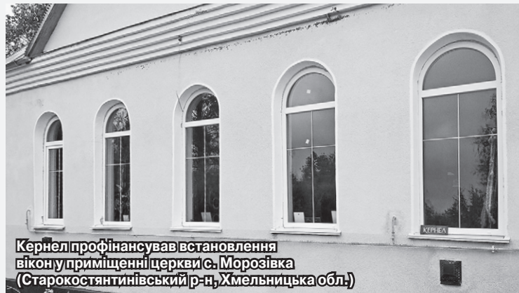
Кернел профінансував встановлення вікон у приміщенні церкви с. Морозівка (Старокостянтинівський р-н, Хмельницька обл.)