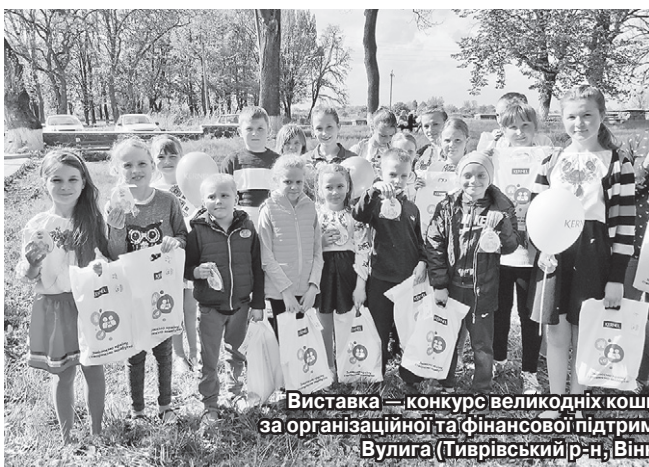
Виставка — конкурс великодніх кошиків, який проходив за організаційної та фінансової підтримки Кернелу с. Велика Вулига (Тиврівський р-н, Вінницька обл.)

«Такий конкурс проводився вперше, і він, безперечно, викликав зацікавлення у школярів. Спасибі Кернел за ідею, сподіваюсь, що надалі подібний захід буде більш масовим, до нього приєднаються господині з села, які продемонструють свої кулінарні здібності».