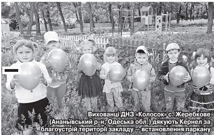
Вихованці ДНЗ «Колосок» с. Жеребкове (Ананівський р-н, Одеська обл.) дякують Кернел за благоустрій території закладу — встановлення паркану

Систематичну підтримку від агропідприємств Кернел та БФ «Разом з Кернел» отримують навчальні заклади сіл Вінниччини, Одещини, Черкащини та Кіровоградщини. Для Компанії це пріоритет, адже сільські діти повинні навчатися у гідних умовах. Щоб вікна у школі пускали сонячні зайчики, а в класі була мультимедійна дошка й комп'ютери, ідальня радувала комфортом і новим посудом, спортивний зал заохочував спорядженням тощо.