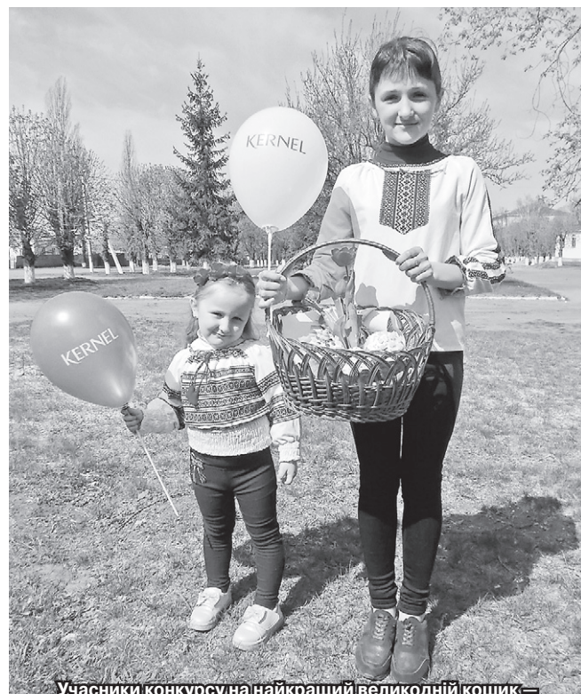
Учасники конкурсу на найкращий великодній кошик — жителі с. Кальніболота (Новоархангельський р-н, Кіровоградська обл.)