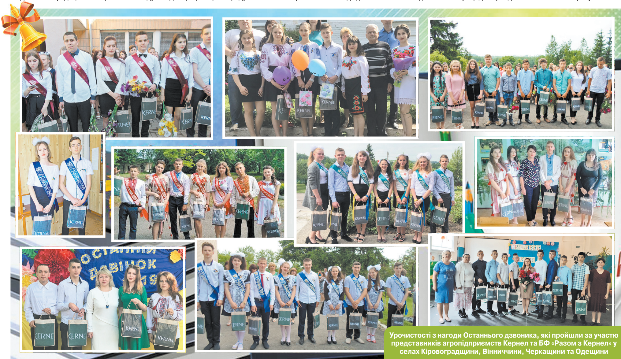
Урочистості з нагоди Останнього дзвоника, які пройшли за участю представників агропідприємств Кернел та БФ «Разом з Кернел» у селах Кіровоградщини, Вінниччини, Черкащини та Одещини

«За доброю традицією на святі Останнього дзвоника Кернел привітав школярів, які упродовж навчального року відзначилися успіхами у навчанні, мали перемоги в олімпіадах, творчих конкурсах і спортивних змаганнях, громадській роботі. Таких ми визначили цього року 16, і завдяки Кернел всі вони отримали подарунки. Ось так успішна Компанія мотивує школярів йти вперед, досягати позитивних результатів».