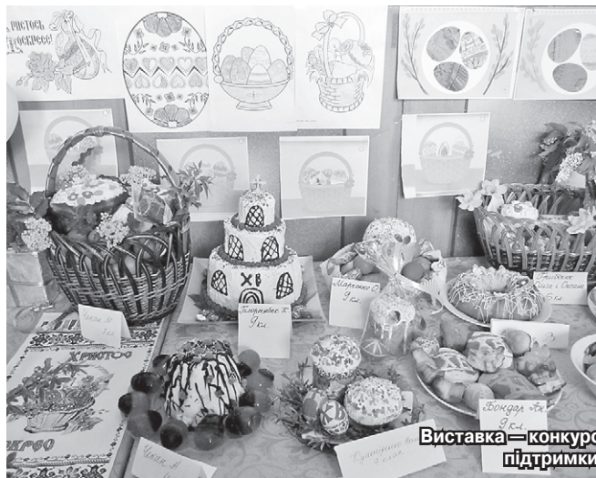
Виставка — конкурс великодніх кошиків, який проходив за організаційної та фінансової підтримки Кернелу НВК с. Байтали (Ананьївський р-н, Одеська обл.)