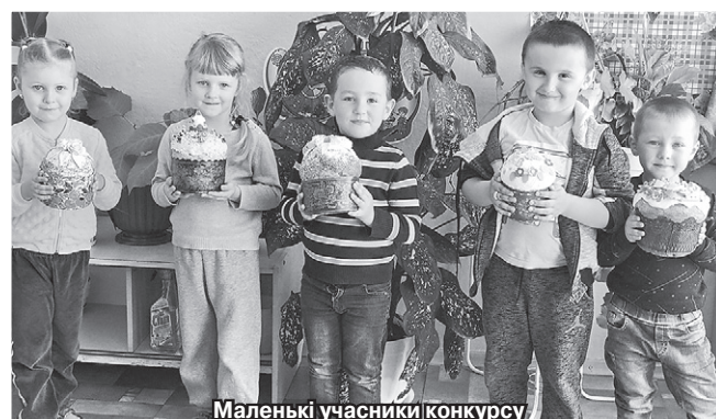
Маленькі учасники конкурсу на найкращий великодній кошик із с. Тальянки (Пальнівський р-н, Черкаська обл.)

У підсумку до великодніх активностей Кернел долучилося понад півтори сотні селян. Ніхто з них не залишився без смачного подарунка. Переможці конкурсів отримали великодні кошики з продукцією виробництва Компанії — соняшниковою олією, консервацією, а також солодощами. Решті учасників вручено корисні пам'ятні брендовані презенти від Кернел.