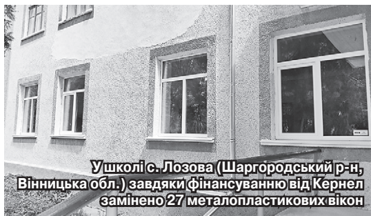
У школі с. Лозова (Шаргородський р-н, Вінницька обл.) завдяки фінансуванню від Кернел замінено 27 металопластикових вікон

Систематичну підтримку від агропідприємств Кернел та БФ «Разом з Кернел» отримують навчальні заклади сіл Вінниччини, Одещини, Черкащини та Кіровоградщини. Для Компанії це пріоритет, адже сільські діти повинні навчатися у гідних умовах. Щоб вікна у школі пускали сонячні зайчики, а в класі була мультимедійна дошка й комп'ютери, ідальня радувала комфортом і новим посудом, спортивний зал заохочував спорядженням тощо.