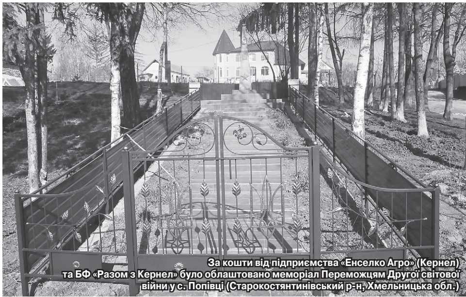
За кошти від підприємства «Енселко Агро» (Кернел) та БФ «Разом з Кернел» було облаштовано меморіал Переможцям Другої світової війни у с. Попівці (Старокостянтинівський р-н, Хмельницька обл.)

Щомісяця на адресу нашої редакції приходять безліч листів від вдячних жителів підопічних територій компанії Кернел — керівників соціальних установ, очільників сільських рад, пайовиків. І щоразу, перечитуючи їх, розумієш, що агропідприємства Компанії дійсно роблять добрі справи на благо розвитку населених пунктів, є помічниками у вирішенні багатьох проблем українців.