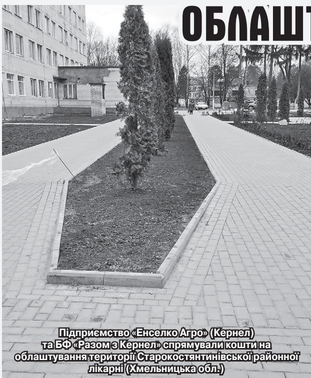
Підприємство «Енселко Агро» (Кернел) та БФ «Разом з Кернел» спрямували кошти на облаштування території Старокостянтинівської районної лікарні (Хмельницька обл.)