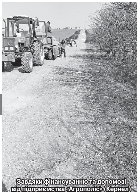
Завдяки фінансуванню та допомозі від підприємства «Агрополіс» (Кернел) та БФ «Разом з Кернел» у селах Тернопільщини тривають роботи дорожнього покриття