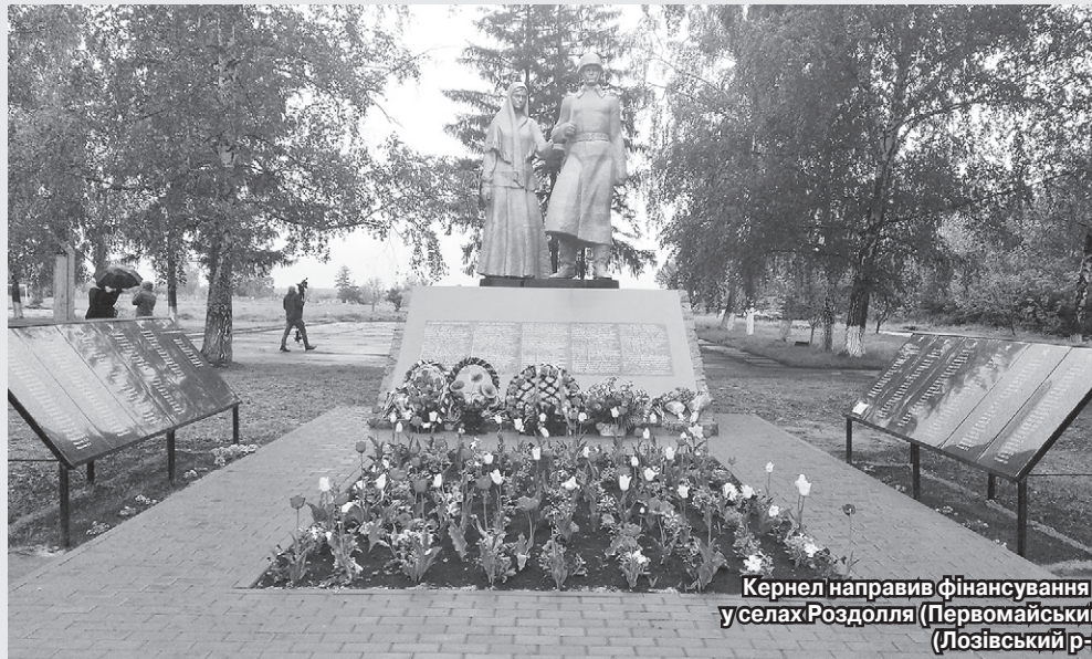
Кернел направив фінансування на облаштування Меморіалів Слави у селах Роздолля (Первомайський р-н, Харківська обл.) та Чернігівське (Лозівський р-н, Харківська обл.)

— Пам'ятник загиблим односельцям — важливе місце, — підкреслює Олександр