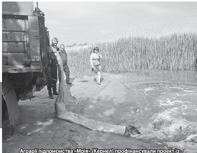
Аграрії підприємства «Мрія» (Кернел) профінансували проект із зариблення водойми та благоустрою території у селах Лебедівка та Шевченкове (Сахновщинський р-н, Харківська обл.)