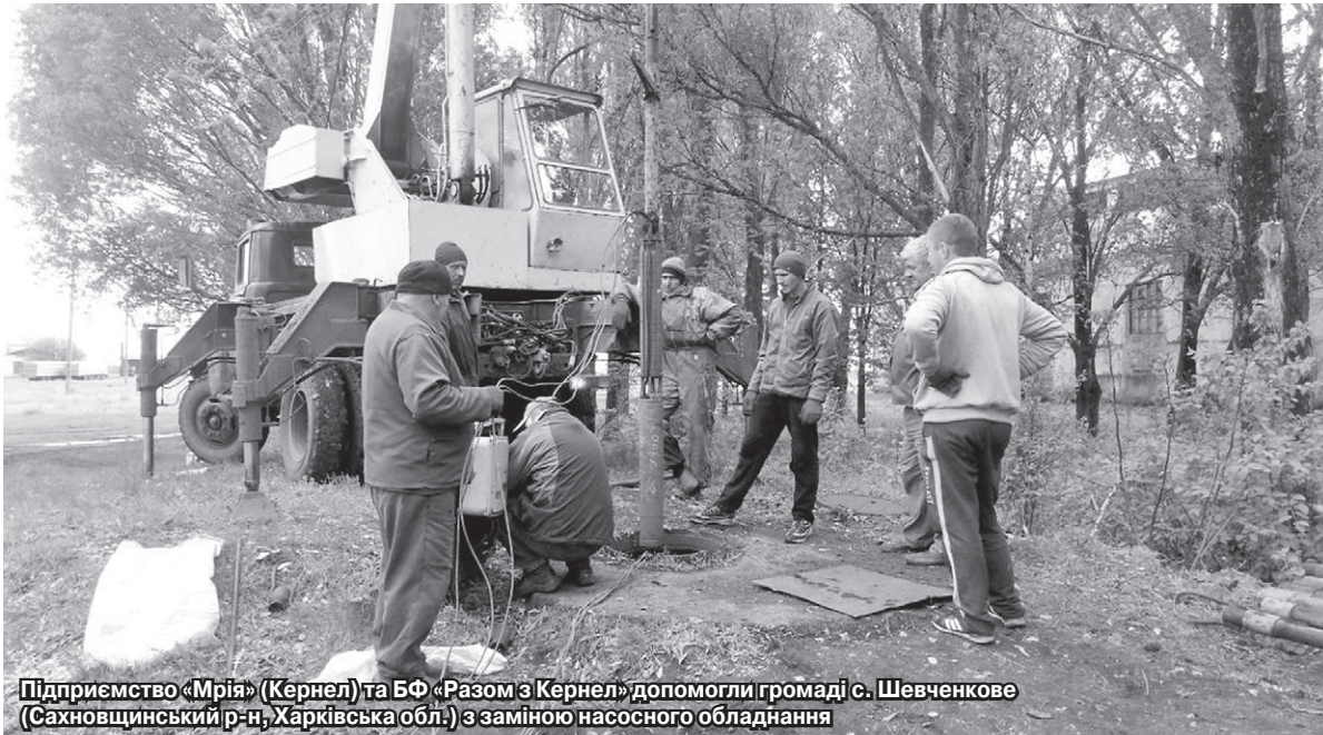
Підприємство «Мрія» (Кернел) та БФ «Разом з Кернел» допомогли громаді с. Шевченкове (Сахновщинський р-н, Харківська обл.) з заміною насосного обладнання