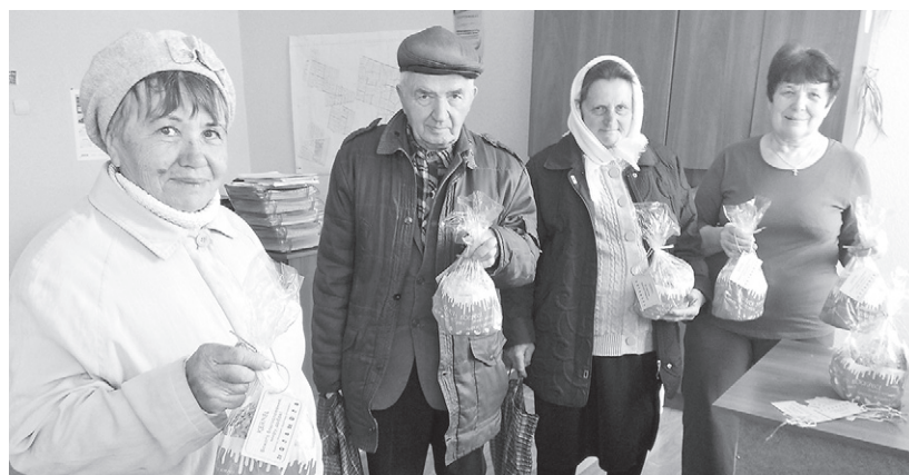
Пайовики підприємства «Мрія» (Кернел), жителі сіл Харківщини, отримали великодні смаколики від Компанії-орендаря