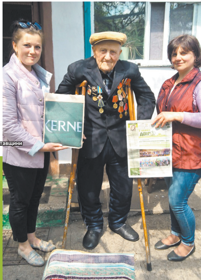
Привітання від Кернел з 9 Травня отримують переможці, жителі сіл Харківщини та Полтавщини