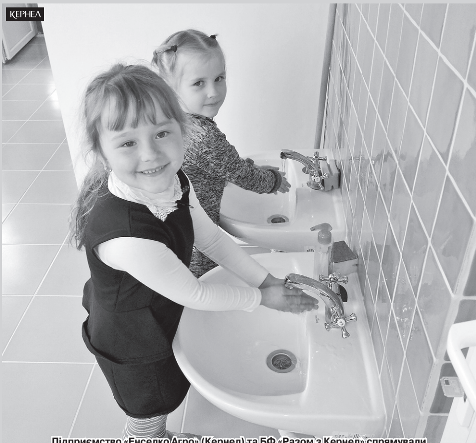
Підприємство «Енселко Агро» (Кернел) та БФ «Разом з Кернел» спрямували фінансування на проект із облаштування внутрішніх вбиральень у НВК с. Ладиги (Старокостянтинівський р-н, Хмельницька обл.)