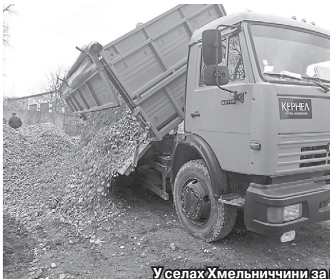
У селах Хмельниччини за підтримки підприємства «Енселко Агро» (Кернел) та БФ «Разом з Кернел» проходять ремонтні дорожнього покриття

«Ми розуміємо, що сьогодні агропідприємство-орендар, що обробляє земельні наділи, є основою життєдіяльності сільських населених пунктів. Познайомившись з роботою підприємства «Енселко Агро» (Кернел), відношу цього сільгоспвиробника до тих інвесторів, які разом з людською землею беруть на себе відповідальність і за добробут громад. Бачу, що аграрії Кернел ідуть людям назустріч у важливих питаннях, допомагають вирішувати проблеми. Якщо співпраця так складатиметься й надалі, зможемо зробити багато корисних справ. Виникла проблема з дорогами на території Карачівецької сільради — Компанія підставила плече й ми разом знайшли рішення. Техніка Кернел працює на транспортуванні щебеню та інших матеріалів для ремонту. Крім того, з місцевими запасами корисних копалин нам допомогла сама природа. У кар'єрі поблизу села є пісок з камінням, пісок з глиною — коли віднайшли таке джерело матеріалів, звернулися до мене як до керівника району, мовляв, як нам бути. А Кодекс про надра дозволяє органам місцевого самоврядування використовувати наявні запаси для потреб громади, але тільки на її території. Цим і скористалися. Я побував на сесії сільської ради, почув позицію голови й депутатів, які проголосували й дали дозвіл використати матеріали з кар'єру для ремонтних робіт. Тоді «Енселко Агро» (Кернел) почало транспортувати суміш на дороги. І це врятувало ситуацію з обла-