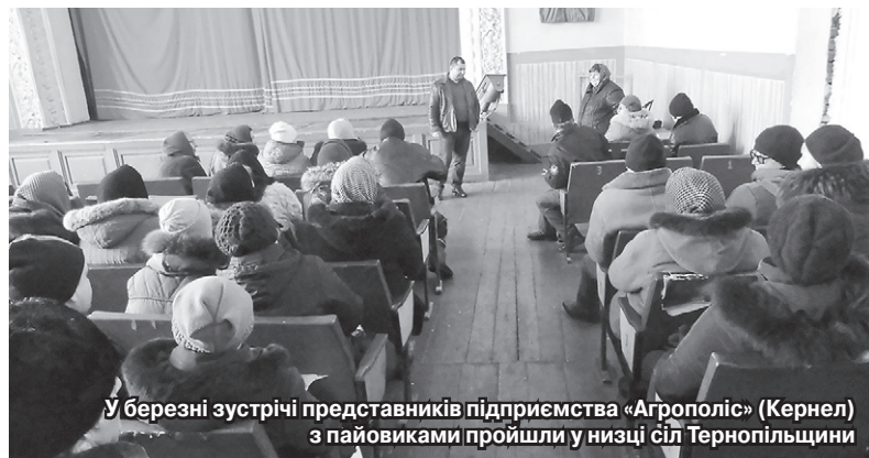
У березні зустрічі представників підприємства «Агрополіс» (Кернел) з пайовиками пройшли у низці сіл Тернопільщини

«Мені цікаво все, що відбувається в аграрному секторі країни. Постійно читаю, аналізую, думаю, у якому напрямі розвиватиметься українське село. Про це можна говорити годинами, адже Україна багата землями й тут можна мати високі врожаї. Це я й на власному досвіді знаю, бо багато років працював і в радгоспі, і у фермера на вирощуванні органічних овочів. Про компанію Кернел, якій я віддав в оренду землю, можу сказати, що це відповідальний сільгоспвиробник, з грамотним управлінням. Ці аграрії вміють пояснити стан справ, уміють спілкуватися з людьми — а це важливо. Та найголовніше, що підтримує рівень довіри до кернелівців, — те, що вони виконують свої зобов'язання перед нами, орендодавцями. Що пообіцяли — платять. Тому селяни й відгукуються позитивно. А ще в Компанії ставляться до людей з