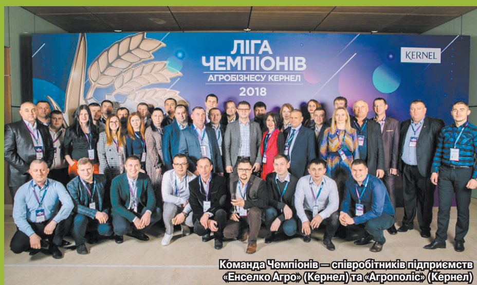
Команда Чемпіонів — співробітників підприємств «Енселко Агро» (Кернел) та «Агрополіс» (Кернел)