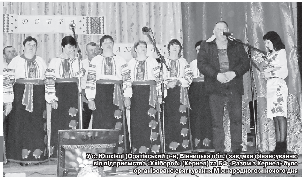
У с. Юшківці (Оратівський р-н, Вінницька обл.) завдяки фінансуванню від підприємства «Хлібороб» (Кернел) та БФ «Разом з Кернел» було організовано святкування Міжнародного жіночого дня

НЕ ПРИХОВУЮЧИ ПОЗИТИВНИХ ЕМОЦІЙ ВІД ПОБАЧЕНОГО Й ПОЧУТОГО, ПРО УРОЧИСТІСТІ ЗГАДУЮТЬ ЇХНІ УЧАСНИКИ