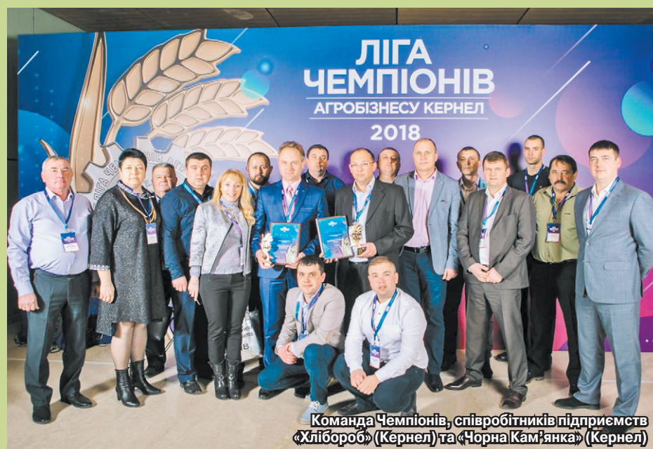
Команда Чемпіонів, співробітників підприємств «Хлібороб» (Кернел) та «Чорна Кам'янка» (Кернел)