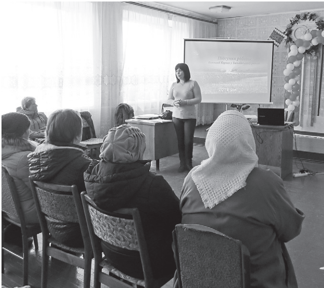
Збори пайовиків агропідприємств Кернел, жителів сіл Черкаської, Кіровоградської та Вінницької областей