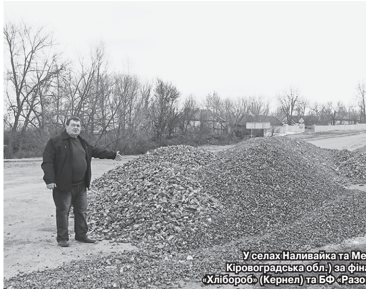
У селах Наливайка та Межирічка (Голованівський р-н, Кіровоградська обл.) за фінансової підтримки підприємства «Хлібороб» (Кернел) та БФ «Разом з Кернел» проходять ремонти доріг

У Межиріччі кернелівці минулого року профінансували придбання 100 тонн матеріалу для ремонту доріг і своїм транспортом перевезли його до села. Згодом транспортували ще 83 тонни — все це на дороги загального користування. Уявляєте, які це обсяги! Більше того, ресурсами й силами цих аграріїв постійно проводяться ямкові ремонти — де розбитий шлях, підсипають-латають. На прохання