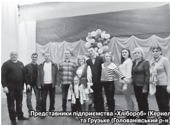
Представники підприємства «Хлібороб» (Кернел) та БФ «Разом з Кернел» вітали жінок сіл Молдовка та Грузьке (Голованівський р-н, Кіровоградська обл.) із 8 Березня