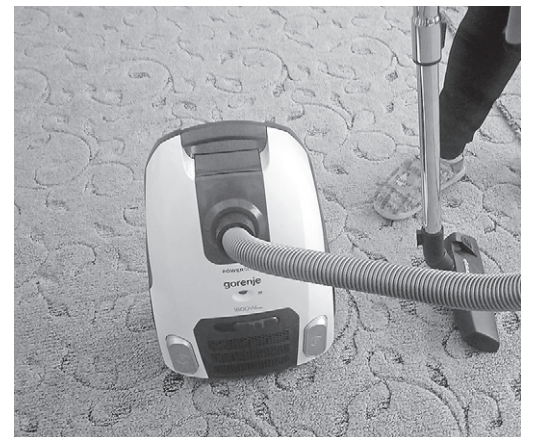
Підприємство «Хлібороб» (Кернел) та БФ «Разом з Кернел» придбали для НВК с. Байтали (Ананівський р-н, Одеська обл.) ковролін, плазмовий телевізор та пилосос

Загалом, підтримці навчальних закладів Кернел приділяє значну увагу, яка має й фінансовий вимір — тільки у минулому році в освіту на територіях присутності інвестовано 8 млн грн. Але це саме той випадок, коли віддане з добром і радістю — примножиться. Керівництво Компанії переконане: що більше вкладаємо в нинішнє покоління, то успішнішим воно виросте. А від цього залежить і майбутнє України.