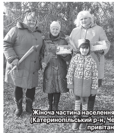
Жіноча частина населення сіл Мокра Калигірка та Радчиха (Катеринопільський р-н, Черкаська обл.) дякують Кернел за привітання з 8 Березня