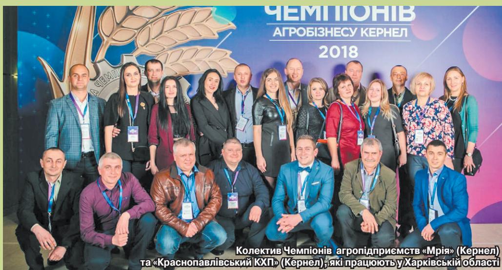
Колектив Чемпіонів агропідприємств «Мрія» (Кернел) та «Краснопавлівський КХП» (Кернел), які працюють у Харківській області