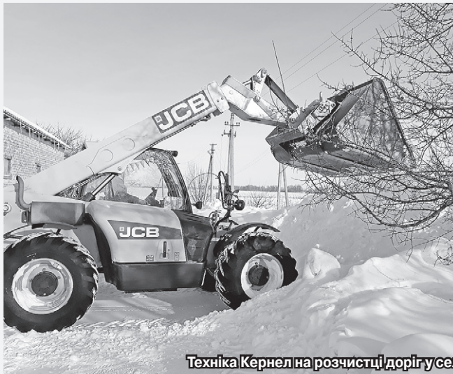
Техніка Кернел на розчистці доріг у селах Полтавщини, Черкащини, Харківщини