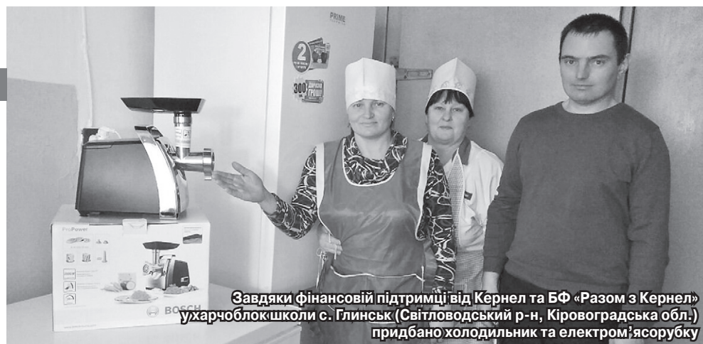
Завдяки фінансовій підтримці від Кернел та БФ «Разом з Кернел» у харчоблок школи с. Глинськ (Світловодський р-н, Кіровоградська обл.) придбано холодильник та електром'ясорубку

перелік. Школа — це постійні потреби, пов'язані з її діяльністю. Тому й просимо у своїх надійних партнерів — компанії Кернел — то трактор, щоб щось перевезти, облаштувати той чи інший куточок пришкольній території. Ось для першокласників, яких у нас 18, просили килим у класну кімнату. І наше прохання не залишилося без розгляду — діти вже граються на килимі. Ось так з великих і малих справ складається реальна допомога, за яку ми щиро вдячні Кернел».