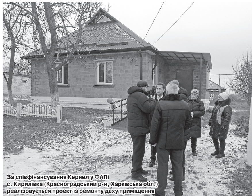
За співфінансування Кернел у ФАПі с. Кирилівка (Красноградський р-н, Харківська обл.) реалізовується проект із ремонту даху приміщення

«Наразі ми реалізуємо важливий для нашої сільської ради, а саме для села Кирилівка міні-проект, у якому поєднано кошти різних бюджетів. Мова про ремонт даху ФАПу, на що потрібно 300 тис. грн. Половину коштів нам виділяє обласна рада, 45% — сільська рада. А ось 5% повинна забезпечити громада. Зрозуміло, що самим людям набирати потрібну суму нелегко, тому знайти саме ці 5% нам допомогли підприємство «Мрія» (Кернел) та БФ «Разом з