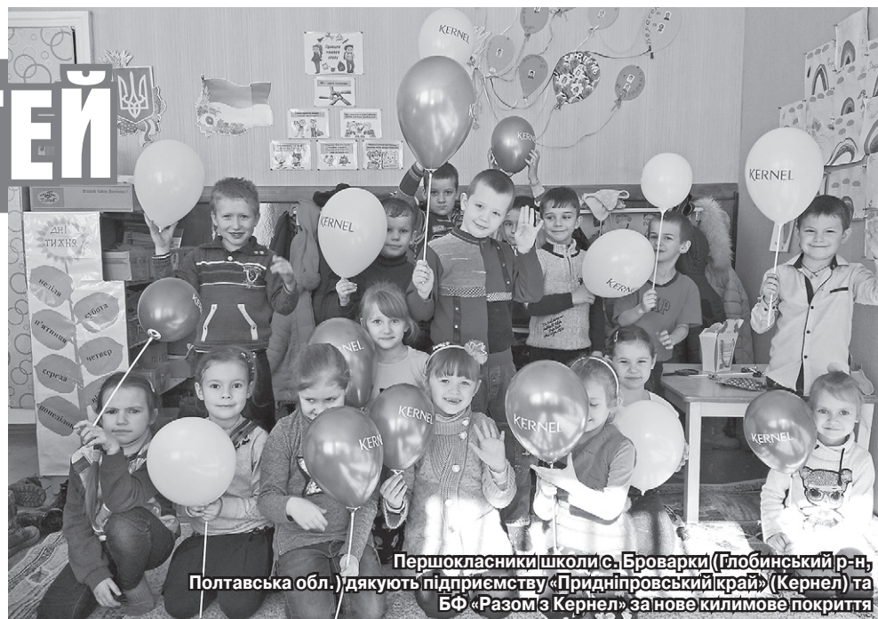
Першокласники школи с. Броварки (Глобинський р-н, Полтавська обл.) дякують підприємству «Придніпровський край» (Кернел) та БФ «Разом з Кернел» за нове килимове покриття

«Підтримку підприємства «Придніпровський край» (Кернел) та БФ «Разом з Кернел» ми відчуваємо постійно. Кошти на ремонт школи, щоб діти приходили у гарні кабінети, на придбання меблів у класи (парти, стільчики) та для адміністрації школи — далеко не повний