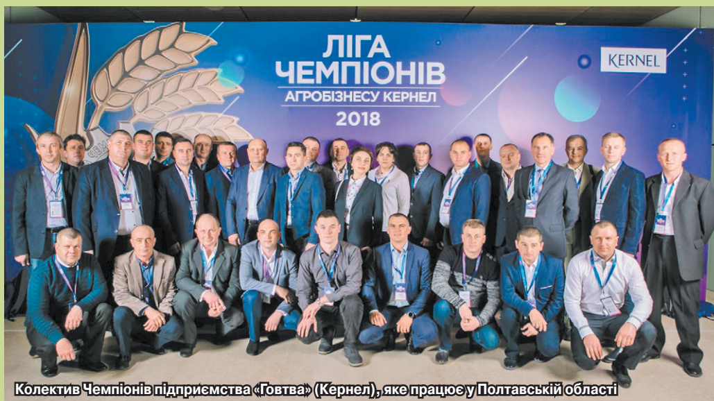
Колектив Чемпіонів підприємства «Говтва» (Кернел), яке працює у Полтавській області

Компанія також багато інвестує в інфраструктуру для створення гідних умов праці. Ми допомагаємо в особистісному та професійному розвитку наших співробітників. Бо найголовніша інвестиція, від якої отримуєш найбільші дивіденди, — це, перш за все, інвестиція в довіру всередині команди. Адже саме відкриті взаємини допоможуть створити той колектив, якому не буде рівних. Кожному величезна подяка за внесок та командну роботу. Ми йдемо в правильному напрямку, і вважаю, що з нашими підходами Компанія приречена на успіх».