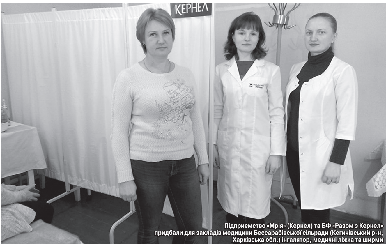
Підприємство «Мрія» (Кернел) та БФ «Разом з Кернел» придбали для закладів медицини Бессарабівської сільради (Кегичівський р-н, Харківська обл.) інгалятор, медичні ліжка та ширми