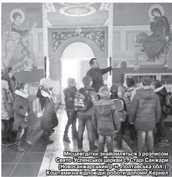
Місцеві дітки знайомляться з розписом Свято-Успенської церкви с. Старі Санжари (Новосанжарський р-н, Полтавська обл.). Коштами на відповідні роботи допоміг Кернел

Щомісяця на адресу нашої редакції приходять безліч листів від вдячних жителів підопічних територій компанії Кернел — керівників соціальних установ, очільників сільських рад, пайовиків. І щоразу, перерахувавши їх, розумієш, що агропідприємства Компанії дійсно роблять добрі справи на благо розвитку населених пунктів, є помічниками у вирішенні багатьох проблем українців.