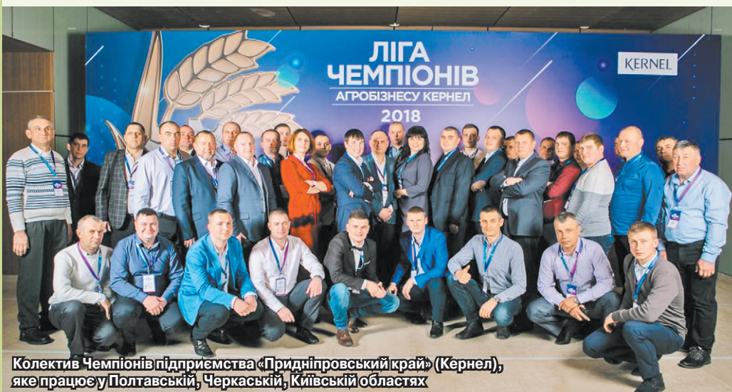
Колектив Чемпіонів підприємства «Придніпровський край» (Кернел), яке працює у Полтавській, Черкаській, Київській областях

«Як на мене, проведення таких конкурсів і заходів, як Ліга Чемпіонів Агробізнесу, важливе для нас, виробників. Це не лише здорова конкуренція, а й прагнення щоденно вдосконалюватися, відчувати свою цінність для Компанії. Це моя перша нагорода, яка, впевнений, стане вдалим стартом для нових досягнень. Головним фактором нашого успіху вважаю команду, яка спрацювала якісно та оперативно. Звісно, дякуємо й погоді, що також підсилювала потрібну кількістю вологи. Урочиста церемонія нагородження вразила емоційністю».