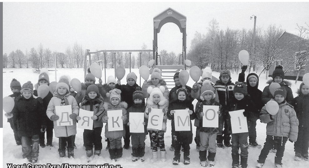
У селі Стара Гута (Дунаєвецький р-н, Хмельницька обл.) завдяки фінансуванню від підприємства «Енселко Агро» (Кернел) та БФ «Разом з Кернел» з'явився сучасний ігровий майданчик

«Новий дитячий майданчик, який ми отримали від «Енселко Агро» (Кернел) та БФ «Разом з Кернел», був нашою багаторічною мрією. До кого ми тільки не зверталися, скільки листів не писали — всі відмовчувалися. Хтось відверто говорив, що ви багато хочете (так, школа і дитсадок у нас невеликі). А Кернел не пошкодував коштів для маленьких жителів Старої Гуті. Новий, функціональний, призначений для розвитку малюків майданчик став окрасою нашого подвір'я і джерелом неймовірної радості для малечі. А ми тепер точно знаємо: мрії збуваються, особливо коли поряд надійні та відповідальні партнери».