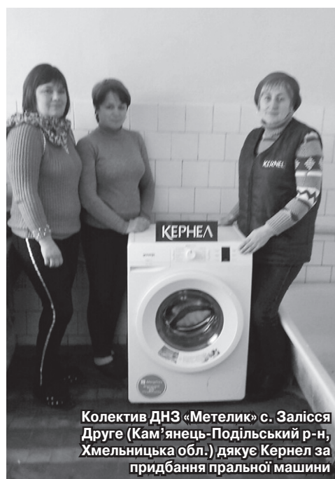
Колектив ДНЗ «Метелик» с. Залісся Друге (Кам'янець-Подільський р-н, Хмельницька обл.) дякує Кернел за придбання пральної машини