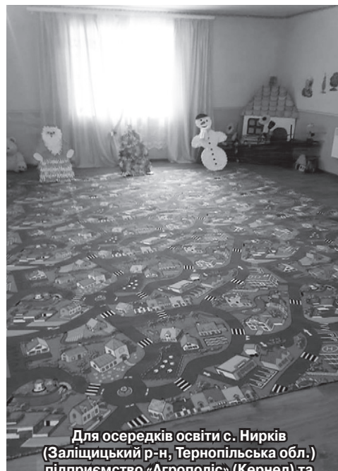
Для осередків освіти с. Нирків (Заліщицький р-н, Тернопільська обл.) підприємство «Агрополіс» (Кернел) та БФ «Разом з Кернел» підготували корисні подарунки — килимове покриття та електроконвектори