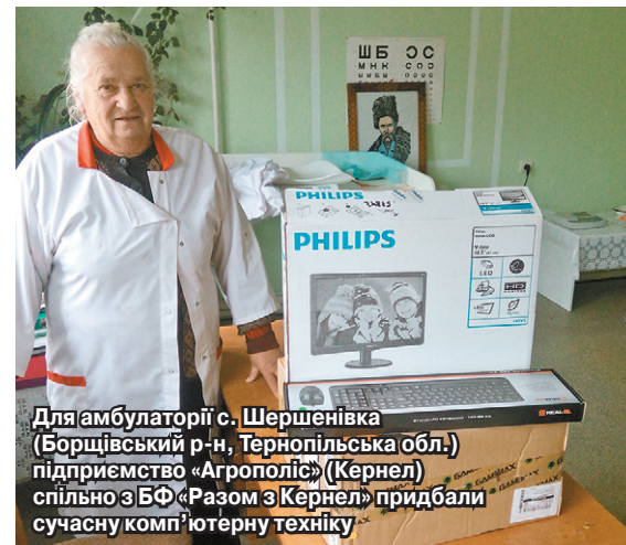
Для амбулаторії с. Шершенівка (Борщівський р-н, Тернопільська обл.) підприємство «Агрополіс» (Кернел) спільно з БФ «Разом з Кернел» придбали сучасну комп'ютерну техніку