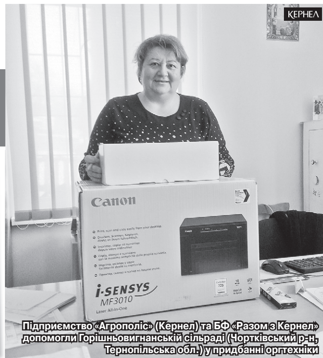
Підприємство «Агрополіс» (Кернел) та БФ «Разом з Кернел» допомогли Горішньовигнанській сільській раді (Чортківський р-н, Тернопільська обл.) у придбанні оргтехніки