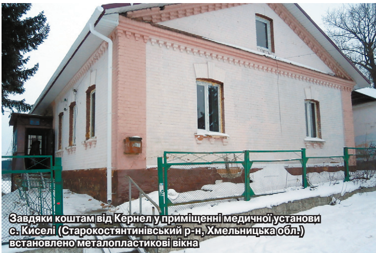
Завдяки коштам від Кернел у приміщенні медичної установи с. Киселі (Старокостянтинівський р-н, Хмельницька обл.) встановлено металопластикові вікна