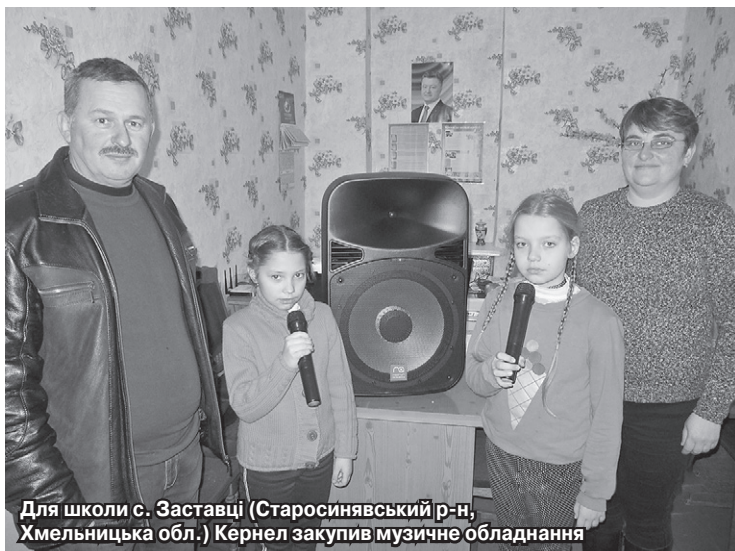
Для школи с. Заставці (Старосинявський р-н, Хмельницька обл.) Кернел закупив музичне обладнання