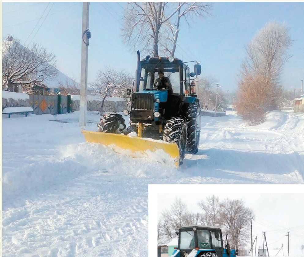
Техніка агропідприємств Кернел на розчистці доріг у селах Хмельниччини й Тернопільщини