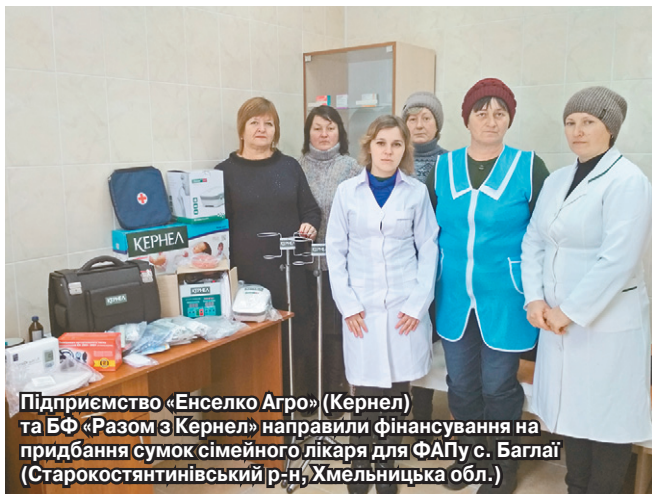
Підприємство «Енселко Агро» (Кернел) та БФ «Разом з Кернел» направили фінансування на придбання сумок сімейного лікаря для ФАПУ с. Баглаї (Старокостянтинівський р-н, Хмельницька обл.)