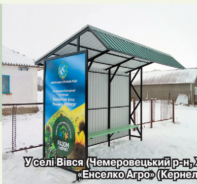
У селі Вівсі (Чемеровецький р-н, Хмельницька обл.) завдяки фінансовій участі підприємства «Енселко Агро» (Кернел) встановлено зупинки громадського транспорту

До речі, цього річ громада планує побудувати водогін на одній з вулиць, яка свого часу залишилася без води. А це, не багато не мало, 480 метрів. Ще на одному проміжку треба замінити 300 метрів труб. З представниками підприємства «Енселко Агро» (Кернел) та БФ «Разом з Кернел» є чіткі домовленості, і ця справа, переконаний сільський голова, буде реалізована. Також на умовах спільного фінансування з аграріями Компанії планується встановити у селі понад 3,5 км вуличного освітлен-