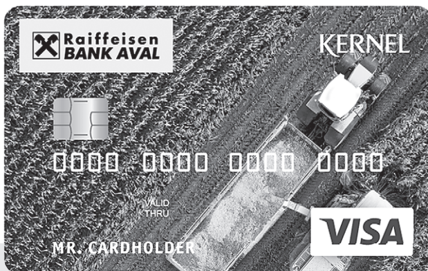
Мільйони людей в усьому світі користуються платіжними картками Райффайзен Банк Аваль