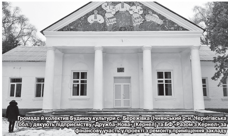
Громада й колектив Будинку культури с. Бережівка (Ічнянський р-н, Чернігівська обл.) дякують підприємству «Дружба-Нова» (Кернел) та БФ «Разом з Кернел» за фінансову участь у проєкті з ремонту приміщення закладу

остаточно вийшов з ладу. А після огляду спеціалістів було встановлено, що жодним ремонтом обладнання не підлягає. Кернел профінансував придбання нового та сучасного устаткування, яке укомплектоване автоматикою та дозволяє значно економити на обігріві. Щиро дякуємо Компанії за те, що тепер ми можемо проводити репетиції та концерти, готуватися до різноманітних конкурсів у комфортних умовах. До речі, при Будинку культури діє вісім клубних формувань, ансамбль народної пісні «Вербиченька», відомий далеко за межами району, та бібліотека. Крім того, наші артисти є лауреатами та переможцями конкурсів-оглядів навіть на всеукраїнському рівні».