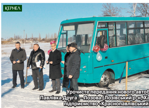
Урочисте передання нового автобуса, який курсуватиме за маршрутом Павлівка Друга — Лозова (Лозівський р-н, Харківська обл.). Фінансову участь у проекті взяли підприємство «Краснопавлівський КХП» (Кернел) та БФ «Разом з Кернел»

Компанія Кернел — яскравий приклад соціально відповідального бізнесу в Україні. У Кернел розроблено ряд комплексних програм, спрямованих на вирішення найбільш важливих соціальних проблем у підопічних селах. Усі вони реалізуються на регулярній основі та орієнтовані на довгостроковий результат. Серед них важливе місце посідають соціальні проекти, спрямовані на покращення інфраструктури сільських територій та створення комфортних умов проживання для місцевих мешканців. Протягом 2018 року ми інформували Вас про безліч добрих справ Кернел, які так чи інакше впливали на якість життя в селах: сотні кілометрів відремонтованих доріг, десятки відреставрованих електрокомунікацій та систем водопостачання. А ще — облаштування нових дитячих майданчиків, зупинок автобусного транспорту, оновлення приміщень освітніх, культурних та медичних закладів. Наразі до Вашої уваги — чергові результати співпраці громад Харківщини з Кернел.