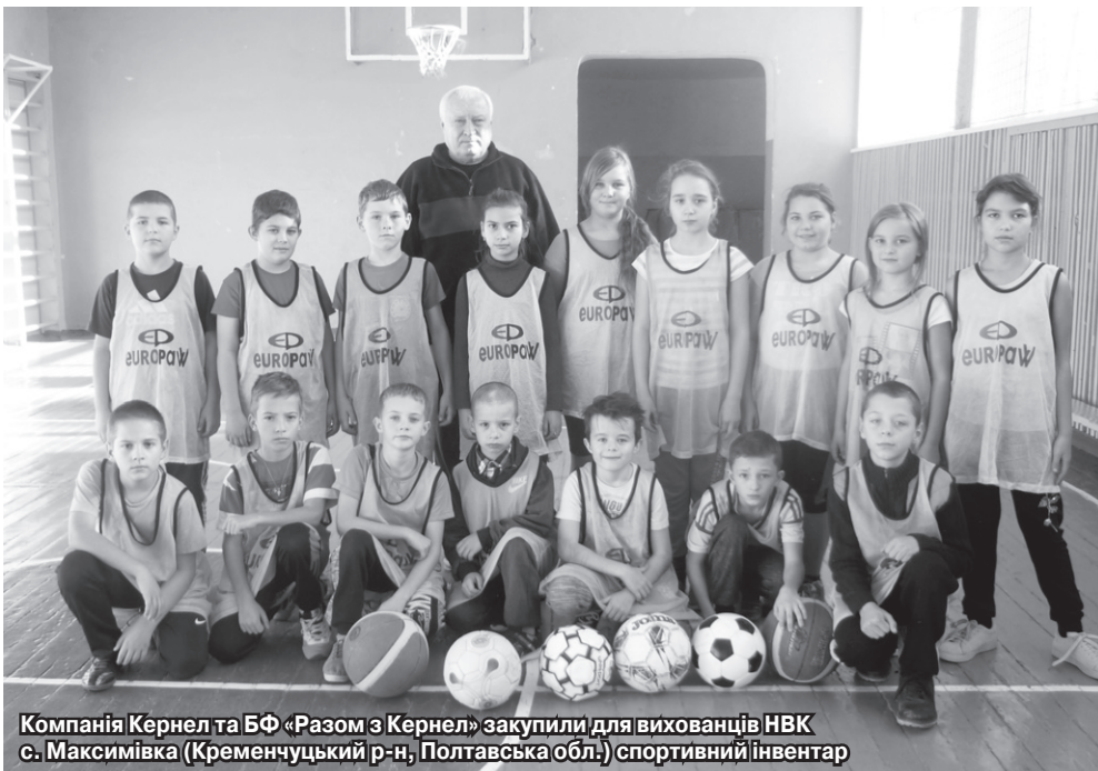
Компанія Кернел та БФ «Разом з Кернел» закупили для вихованців НВК с. Максимівка (Кременчуцький р-н, Полтавська обл.) спортивний інвентар