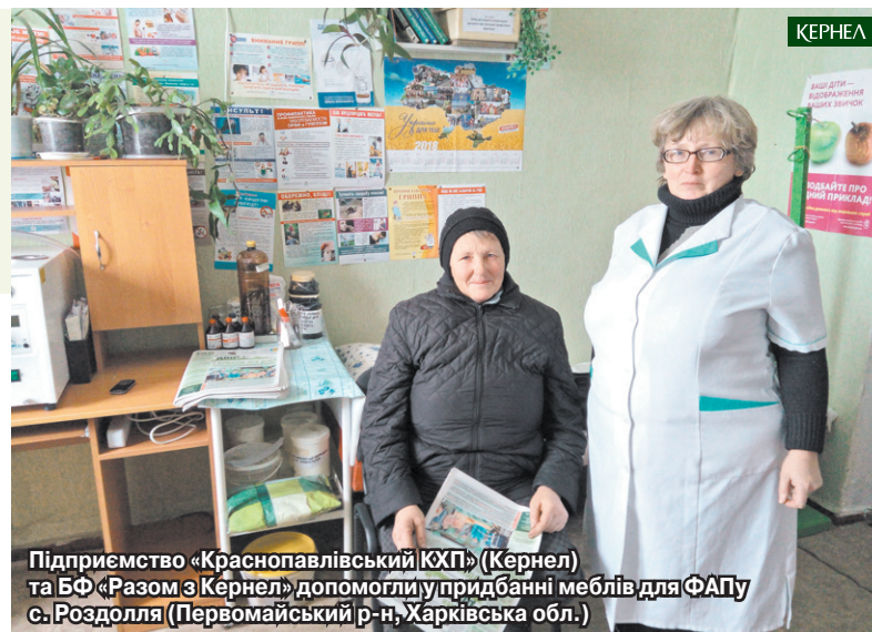
Підприємство «Краснопавлівський КХП» (Кернел) та БФ «Разом з Кернел» допомогли у придбанні меблів для ФАПу с. Роздолля (Первомайський р-н, Харківська обл.)

«Фельдшерсько-акушерському пункту с. Роздолля, який обслуговує понад 500 осіб, пощастило знайти відповідальних помічників. Йдеться про підприємство «Краснопавлівський КХП» (Кернел) та БФ «Разом з Кернел». Раніше аграрії фінан-