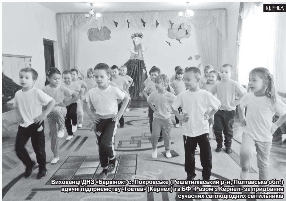
Вихованці ДНЗ «Барвінок» с. Покровське (Решетилівський р-н, Полтавська обл.) вдячні підприємству «Говтва» (Кернел) та БФ «Разом з Кернел» за придбання сучасних світлодіодних світильників