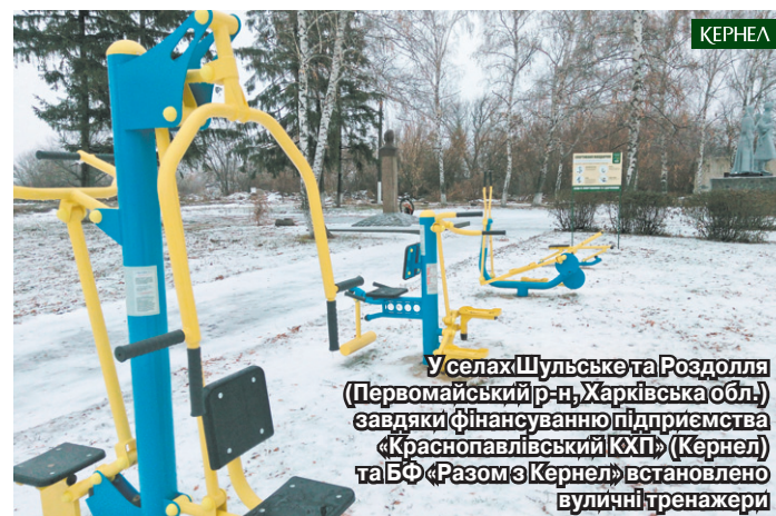
У селах Шулське та Роздолля (Первомайський р-н, Харківська обл.) завдяки фінансуванню підприємства «Краснопавлівський КХП» (Кернел) та БФ «Разом з Кернел» встановлено вуличні тренажери

— Разом з Кернел у 2018 році ми зробили чимало, — резюмує наш співрозмовник. — Приємно те, що аграрії Компанії не залишилися осторонь нагальних питань. І кожен проєкт, кожна справа принесли користь жителям сіл Роздольської сільради. Переконали, що так буде й надалі.