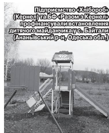
Підприємство «Хлібороб» (Кернел) та БФ «Разом з Кернел» профінансували встановлення дитячого майданчика у с. Байтали (Ананівський р-н, Одеська обл.)

«Спорудження дитячого майданчика в селі було справжньою необхідністю. Бо площадка, яка донині діяла у сквері та була зроблена, як то кажуть, із підручних матеріалів, не відповідала вимогам часу. А враховуючи те, що у нас налічується понад 300 жителів шкільного та дошкільного віку, ми хотіли обладнати майданчик більш сучасними локаціями. І завдяки підтримці підприємства «Чорна Кам'янка» (Кернел) та БФ «Разом з Кернел» нам вдалося це зробити. Тут з'явилися нові гойдалки, каруселі, балансир. На часі — встановлення огорожі, після чого майданчик буде офіційно введено у експлуатацію. Дякуємо Кернел за добру справу».