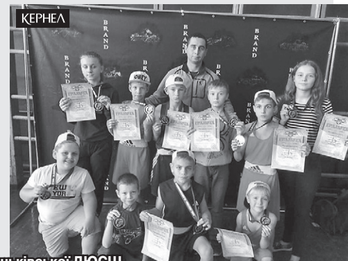
Вихованці секції боксу Маньківської ДЮСШ (Черкаська обл.) вдячні компанії Кернел за систематичну підтримку та допомогу