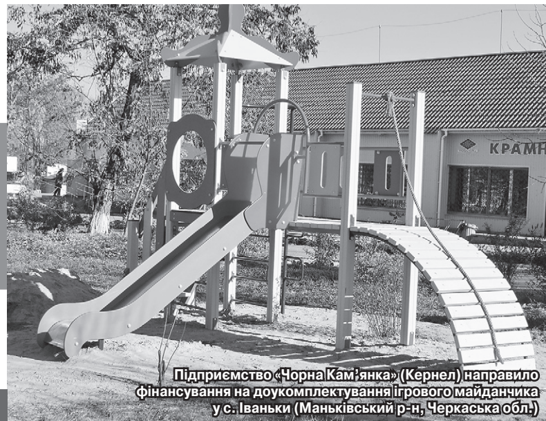
Підприємство «Чорна Кам'янка» (Кернел) направило фінансування на доукомплектування ігрового майданчика у с. Іваньки (Манківський р-н, Черкаська обл.)

Восени подібні об'єкти з'явилися ще у трьох населених пунктах — Іваньках, Чорній Кам'янці (Манківський р-н, Черкаська обл.) та Байталах (Ананівський р-н, Одеська обл.). Бюджет витрат Кернел на їхнє спорудження склав майже 110 тис. грн.