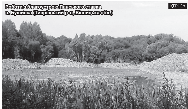
Роботи з благоустрою Панського ставка с. Бушинка (Тиврівський р-н, Вінницька обл.)