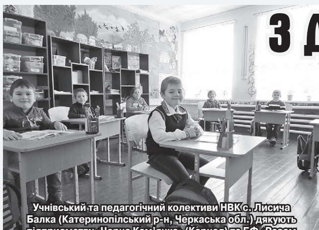
Учніський та педагогічний колективи НВК с. Лисича Балка (Катеринопільський р-н, Черкаська обл.) дякують підприємству «Чорна Кам'янка» (Кернел) та БФ «Разом з Кернел» за допомогу у встановленні вікон та надання комп'ютерної техніки для кабінету інформатики