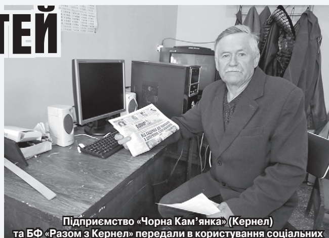
Підприємство «Чорна Кам'янка» (Кернел) та БФ «Разом з Кернел» передали в користування соціальних установ с. Чорна Кам'янка (Манківський р-н, Черкаська обл.) комп'ютерне обладнання