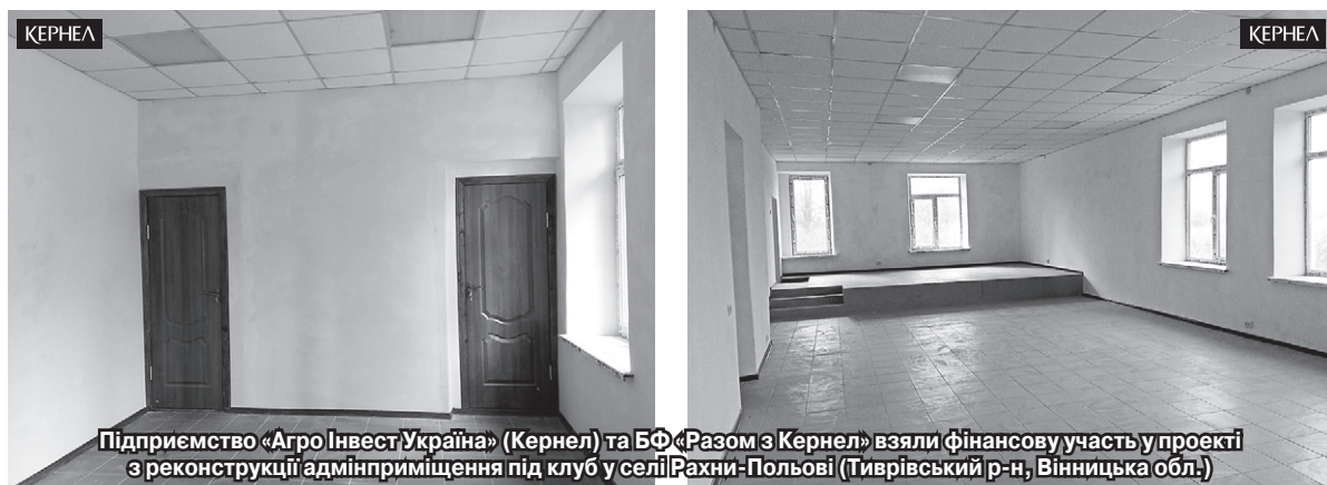
Підприємство «Агро Інвест Україна» (Кернел) та БФ «Разом з Кернел» взяли фінансову участь у проєкті з реконструкції адмінприміщення під клуб у селі Рахни-Польові (Тиврівський р-н, Вінницька обл.)