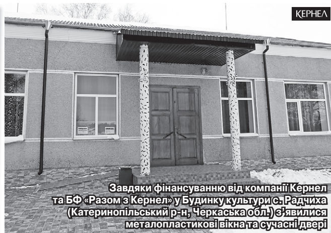
Завдяки фінансуванню від компанії Кернел та БФ «Разом з Кернел» у Будинку культури с. Радчиха (Катеринопільський р-н, Черкаська обл.) з'явилися металопластикові вікна та сучасні двері