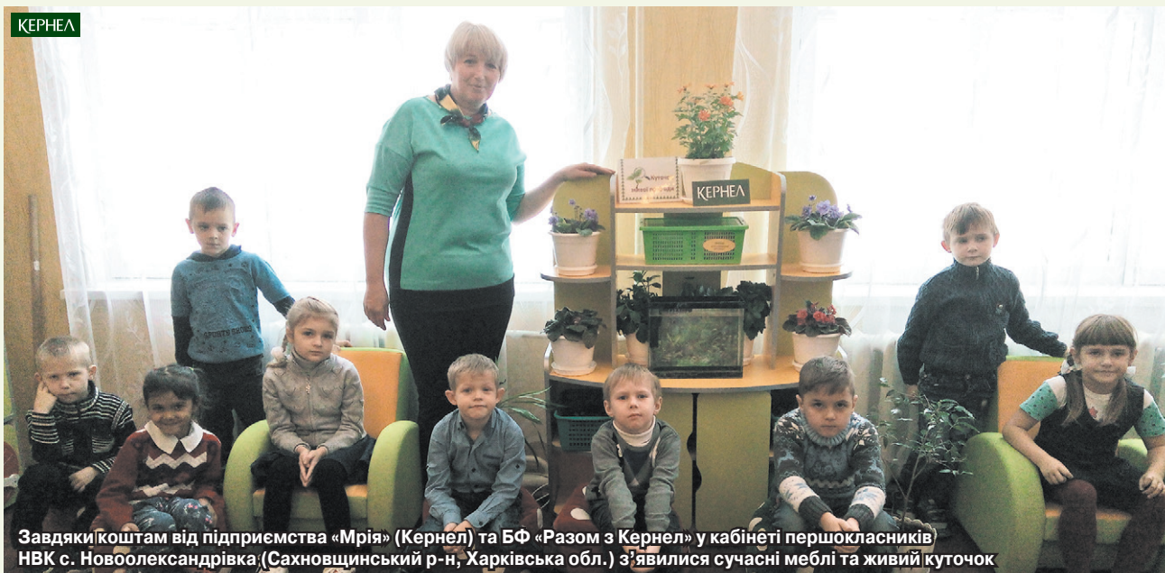
Завдяки коштам від підприємства «Мрія» (Кернел) та БФ «Разом з Кернел» у кабінеті першокласників НВК с. Новоолександрівка (Сахновщинський р-н, Харківська обл.) з'явилися сучасні меблі та живий куточок

«З року в рік наша громада намагається покращувати умови навчання дітей у сільському освітньому осередку, адже його приміщенню — понад сорок років. Важливим етапом оновлення будівлі школи були вікна. Конструкції стали непридатними для використання та вимагали заміни. Частину вікон ми замінили торік, ще частину — у харчоблоці, навчальних кабінетах та коридорах — плануємо оновити найближчим часом. Кошти в сумі 100 тис. грн на виготовлення та встановлення конструкцій спрямували підприємство «Придніпровський край» (Кернел) та БФ «Разом з Кернел». Нагадаю, що в поточному році Кернел виділяв вагомий фінансову підтримку на ремонти дорожнього покриття в селах. Дякуємо Компанії за всі добрі справи!»