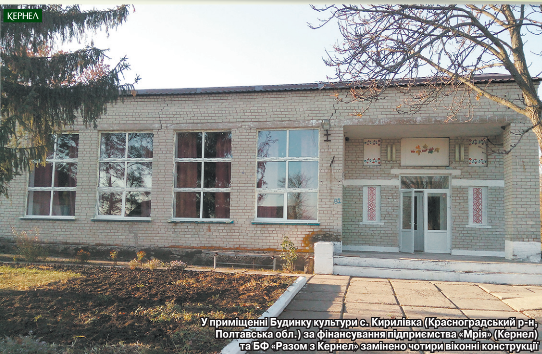
У приміщенні Будинку культури с. Кирилівка (Красноградський р-н, Полтавська обл.) за фінансування підприємства «Мрія» (Кернел) та БФ «Разом з Кернел» замінено чотири віконні конструкції