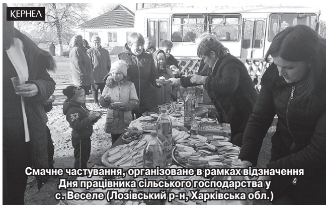
Смачне частування, організоване в рамках відзначення Дня працівника сільського господарства у с. Веселе (Лозівський р-н, Харківська обл.)