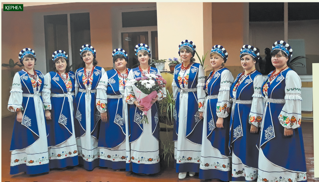
Колективи Будинку культури с. Михнівці (Лубенський р-н, Полтавська обл.) дякують компанії Кернел та БФ «Разом з Кернел» за кошти на проведення ремонту у приміщенні закладу

Саме в цьому культурним установам підопічних сіл допомагають агропідприємства компанії Кернел та БФ «Разом з Кернел». Докладніше про чергові проекти, зокрема про встановлення вікон у БК с. Кирилівка (Красноградський р-н, Харківська обл.), оновлення віконного фонду у бібліотеці с. Шульське (Первомайський р-н, Харківська обл.), ремонт приміщення закладу культури с. Михнівці (Лубенський р-н, Полтавська обл.) та про фінансову підтримку культурного осередку с. Глинськ (Світловодський р-н, Кіровоградська обл.), — у коментарях. Бюджет витрат Кернел склав 340 тис. грн.