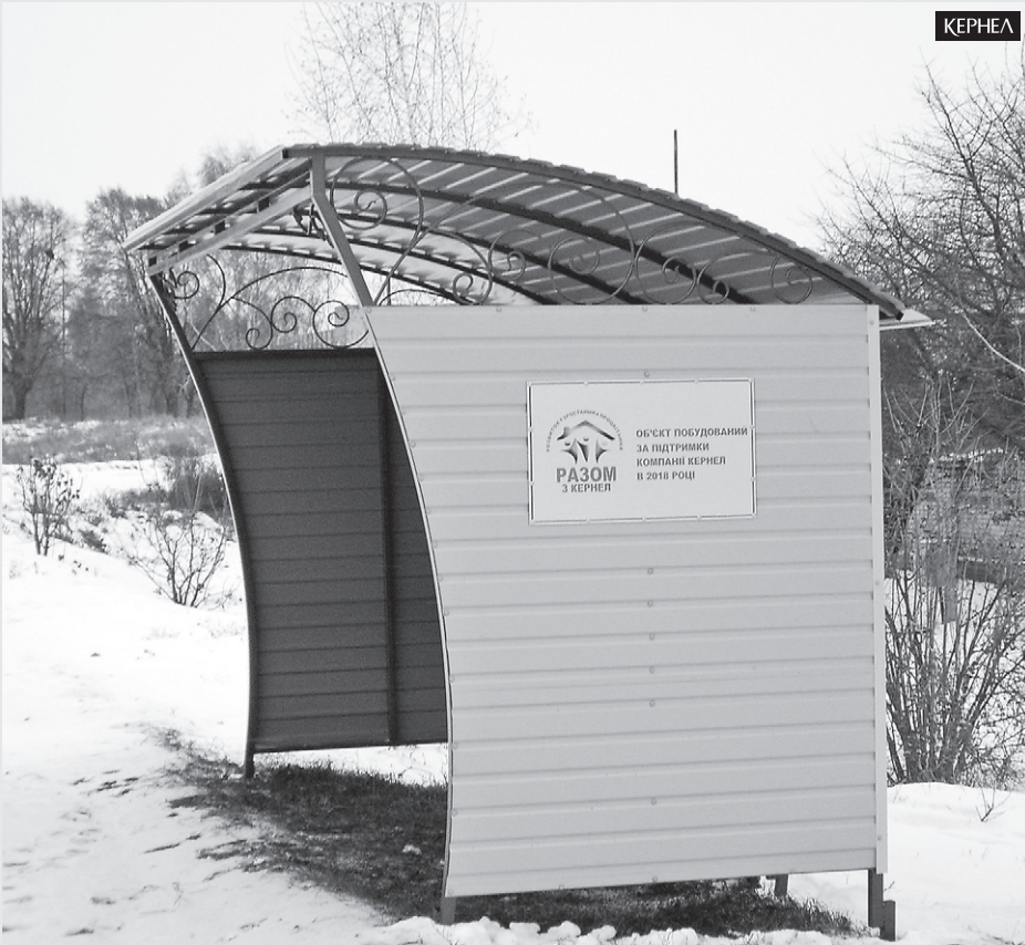
Підприємство «Придніпровський край» (Кернел) та БФ «Разом з Кернел» направили кошти на проект зі встановлення зупинки у смт Драбів (Черкаська обл.)