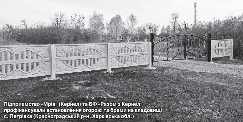
Підприємство «Мрія» (Кернел) та БФ «Разом з Кернел» профінансували встановлення огорожі та брами на кладовищі с. Петрівка (Красноградський р-н, Харківська обл.)