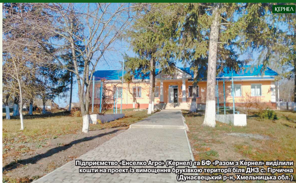
Підприємство «Енселко Агро» (Кернел) та БФ «Разом з Кернел» виділили кошти на проект із вимощення бруківкою території біля ДНЗ с. Гірчична (Дунаєвецький р-н, Хмельницька обл.)

До Вашої уваги — чергові добрі справи аграріїв, втілені в життя з думкою про дітей. Мова про придбання меблів для школи с. Берем'яни (Буцацький р-н), закупівлю комп'ютерної техніки та спортивного інвентарю для освітніх осередків с. Сахнівці (Старокостянтинівський р-н), а також морозильної камери та посуду для школи с. Лажева (Старокостянтинівський р-н). Крім того, завдяки коштам Компанії в навчальних закладах сіл Воронківці (Старокостянтинівський р-н) та Кустівці (Полонський р-н) з'явилися шкільні дошки та сучасні вікна. Також аграрії профінансували проект із благоустрою території ДНЗ с. Гірчична (Дунаєвецький р-н, Хмельницька обл.).