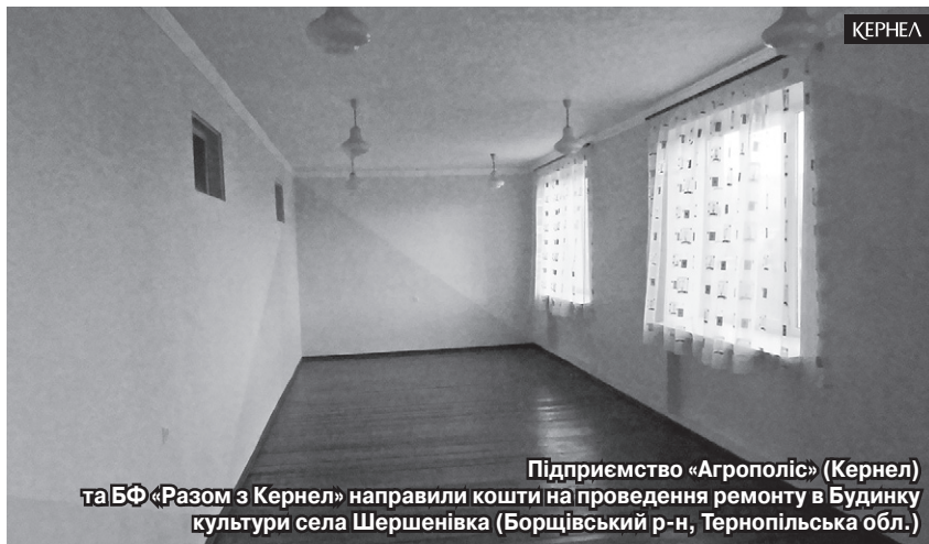
Підприємство «Агрополіс» (Кернел) та БФ «Разом з Кернел» направили кошти на проведення ремонту в Будинку культури села Шершенівка (Борщівський р-н, Тернопільська обл.)

— Спілкуючись з очільниками сіл району, своїми колегами, я розумію, що соціальна підтримка, яку наше село має від Кернел, є значимою та суттєвою. А діяльність аграріїв позитивно впливає на соціально-економічний розвиток нашого населеного пункту. Переконали, що так буде й надалі.