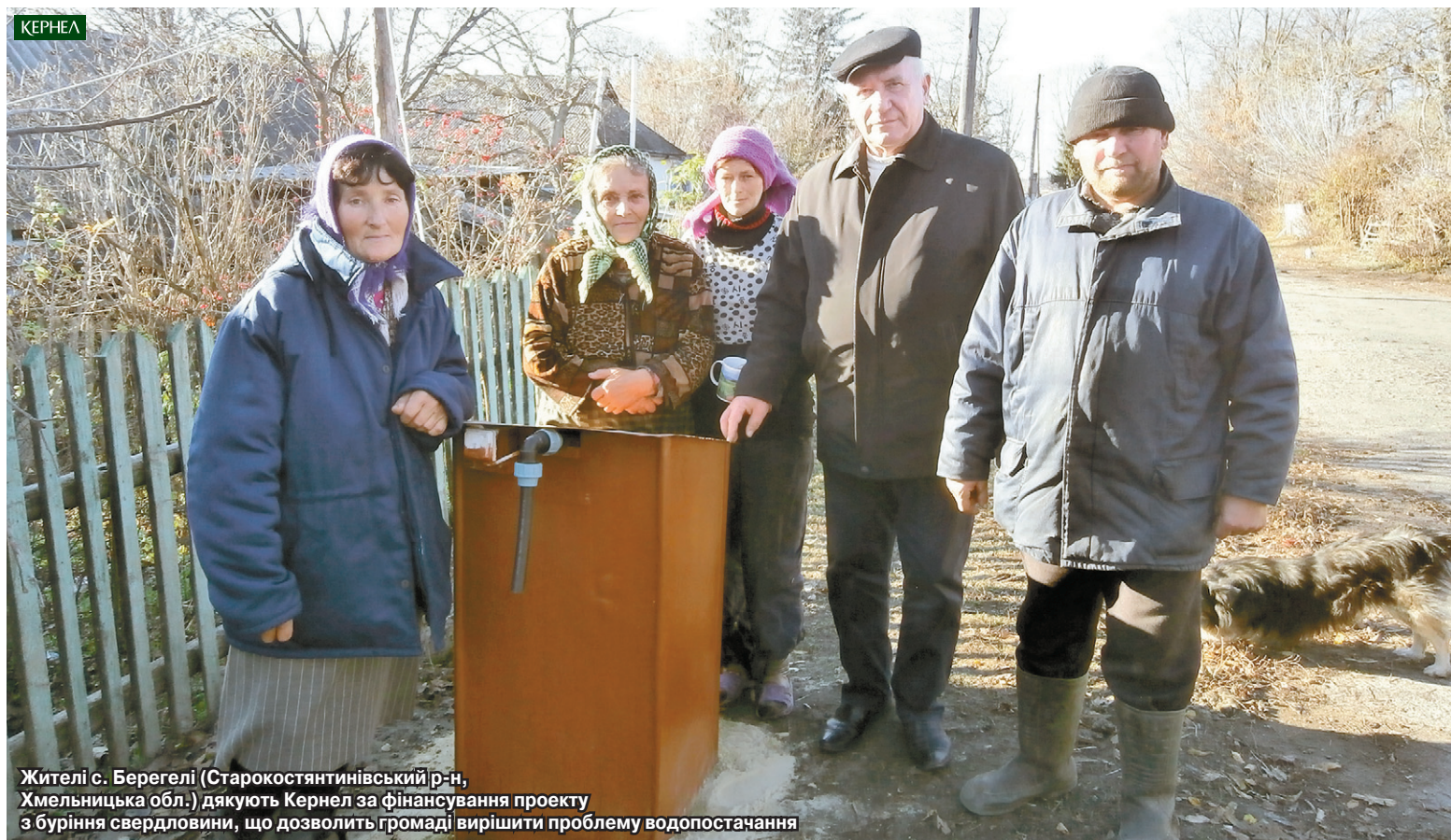
Жителі с. Берегелі (Старокостянтинівський р-н, Хмельницька обл.) дякують Кернел за фінансування проекту з буріння свердловини, що дозволить громаді вирішити проблему водопостачання

Про проблему відсутності централізованого водопостачання в українських селах сказано та написано чимало. Агропідприємства компанії Кернел та БФ «Разом з Кернел» завжди реагують на потреби сільських громад у питанні збереження існуючих та будівництва нових водогонів. За останні декілька років на подібні справи у селах Хмельниччини Компанія спрямувала мільйони гривень. Про що ми неодноразово розповідали на шпальтах газети.