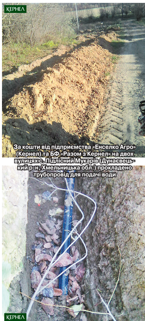
За кошти від підприємства «Енселко Агро» (Кернел) та БФ «Разом з Кернел» на двох вулицях с. Підлісний Мукарів (Дунаєвецький р-н, Хмельницька обл.) прокладено трубопровід для подачі води

Про проблему відсутності централізованого водопостачання в українських селах сказано та написано чимало. Агропідприємства компанії Кернел та БФ «Разом з Кернел» завжди реагують на потреби сільських громад у питанні збереження існуючих та будівництва нових водогонів. За останні декілька років на подібні справи у селах Хмельниччини Компанія спрямувала мільйони гривень. Про що ми неодноразово розповідали на шпальтах газети.