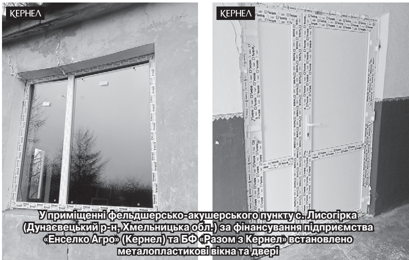
У приміщенні фельдшерсько-акушерського пункту с. Лисогірка (Дунаєвецький р-н, Хмельницька обл.) за фінансування підприємства «Енселко Агро» (Кернел) та БФ «Разом з Кернел» встановлено металопластикові вікна та двері

Варто зауважити, що, окрім підтримки сфери охорони здоров'я, Кернел фінансує й інші важливі для громади справи, надає допомогу пайовикам, вчасно виплачує орендну плату, бере участь у вирішенні господарчих питань та покращенні інфраструктури населеного пункту.