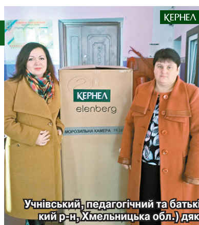
Учніський, педагогічний та батьківський колективи школи с. Лажева (Старокостянтинівський р-н, Хмельницька обл.) дякують Кернел за придбану морозильну камеру та посуд

«Цьогоріч завдяки фінансуванню підприємства «Енселко Агро» (Кернел) та БФ «Разом з Кернел» ми оновили значну частину вікон у школі. Йдеться про 12 віконних конструкцій у кабінетах історії, фізики, інформатики, зарубіжної літератури. А ще в поточному році Компанія спрямовувала