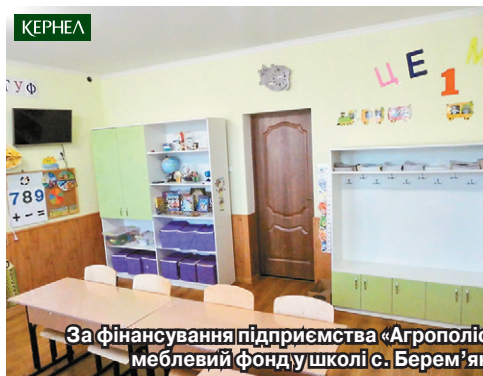
За фінансування підприємства «Агрополіс» (Кернел) та БФ «Разом з Кернел» оновлено меблевий фонд у школі с. Берем'яни (Буцацький р-н, Тернопільська обл.)