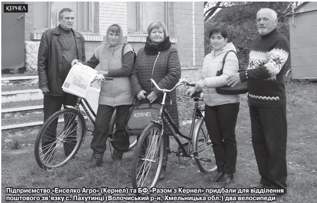
Підприємство «Енселко Агро» (Кернел) та БФ «Разом з Кернел» придбали для відділення поштового зв'язку с. Пахутинці (Волочиський р-н, Хмельницька обл.) два велосипеди