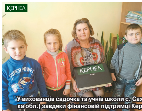
У вихованців садочка та учнів школи с. Сахнівці (Старокостянтинівський р-н, Хмельницька обл.) завдяки фінансовій підтримці Кернел з'явилися спортивний інвентар та ноутбук