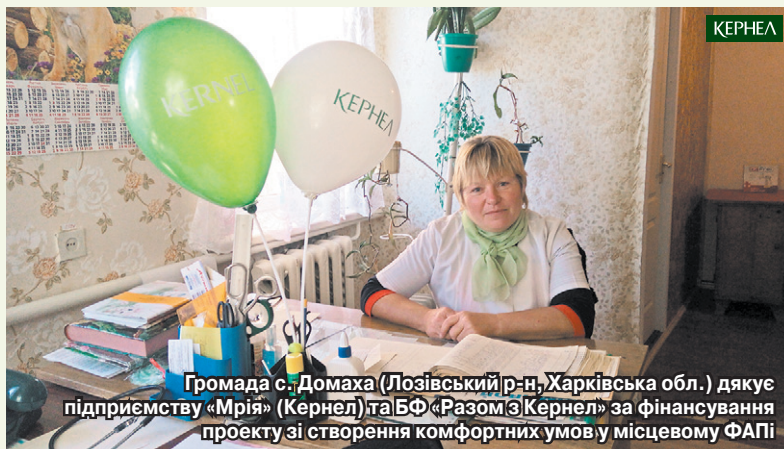
Громада с. Домаха (Лозівський р-н, Харківська обл.) дякує підприємству «Мрія» (Кернел) та БФ «Разом з Кернел» за фінансування проекту зі створення комфортних умов у місцевому ФАПі

Ні для кого не секрет, що сфера охорони здоров'я українських сіл потребує всебічної підтримки. Окрім хронічного дефіциту медичних кадрів у сільській місцевості, у більшості випадків невирішеними залишаються питання забезпечення спецобладнанням, ліками, створення комфортних умов для надання якісних послуг пацієнтам. Саме такі проблеми сільським медичним закладам допомагають вирішувати агропідприємства компанії Кернел та БФ «Разом з Кернел».