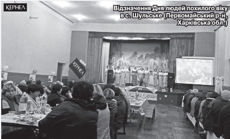
Відзначення Дня людей похилого віку в с. Шульське (Первомайський р-н, Харківська обл.)

Щороку в сільському клубі ми проводимо святковий захід з нагоди відзначення Дня людей похилого віку. Цей рік не став винятком. Вперше до організації заходу фінансово долучилися підприємство «Мрія» (Кернел) та БФ «Разом з Кернел». Учасниками дійства