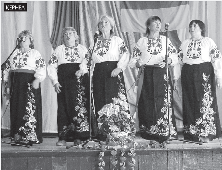
На фото: святкові заходи до Дня захисника України, які проводилися у селах Шевченкове (Сахновщинський р-н, Харківська обл.) та Троїцьке (Шевченківський р-н, Харківська обл.) за фінансової підтримки Кернел