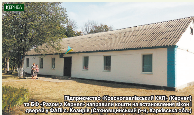
Підприємство «Краснопавлівський КХП» (Кернел) та БФ «Разом з Кернел» направили кошти на встановлення вікон і дверей у ФАПі с. Козирів (Сахновщинський р-н, Харківська обл.)

«Ми дуже вдячні підприємству «Мрія» (Кернел) та БФ «Разом з Кернел» за те, що вони відгукнулися на потребу пацієнтів нашого фельдшерсько-акушерського пункту — а це близько