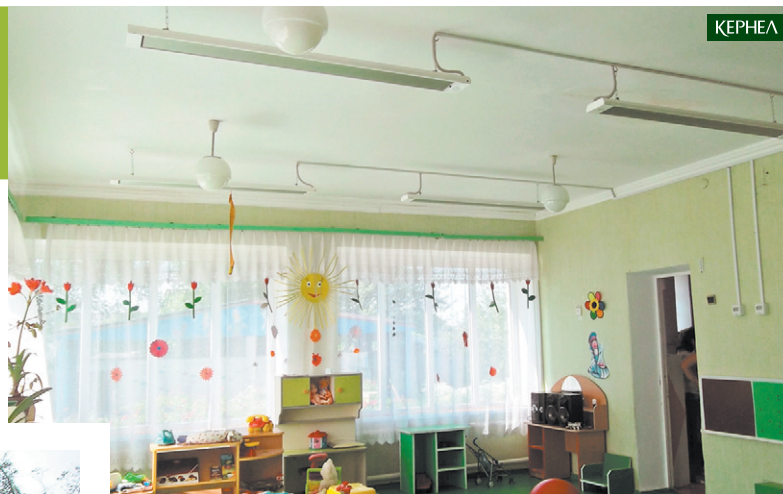
Підприємство «Придніпровський край» (Кернел) та БФ «Разом з Кернел» направили кошти на оновлення системи обігріву у ДНЗ «Оленка» с. Бойківщина (Драбівський р-н, Черкаська обл.)

никами цієї Компанії ми маємо доволі гарну комунікацію. Вони не відмовляють у допомозі в розчистці доріг взимку, завжди надають транспорт для господарчих потреб. Також за їхнього фінансування нам вдалося придбати систему відеонагляду — для того, щоб контролювати безпеку та порядок у громадських місцях, закупити форму для спортивної команди, заасфальтувати територію поблизу дошкільного закладу, а ще кернелівці передали у безкоштовне користування громади водонапірну башту та свердловину. Важливим моментом є розташування на території нашої сільради виробничої бази підприємства, а це — робочі місця для селян. Сподіваємося, що з часом матимемо ще більш плідні результати співробітництва з Кернел».