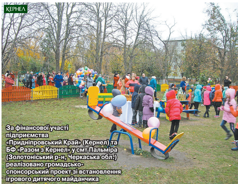
За фінансової участі підприємства «Придніпровський край» (Кернел) та БФ «Разом з Кернел» у смт Пальміра (Золотоніський р-н, Черкаська обл.) реалізовано громадсько-спонсорський проект зі встановлення ігрового дитячого майданчика