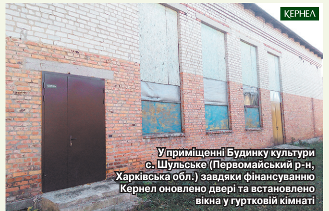
У приміщенні Будинку культури с. Шульське (Первомайський р-н, Харківська обл.) завдяки фінансуванню Кернел оновлено двері та встановлено вікна у гуртковій кімнаті

Крім того, голова Лиману Другого говорить про те, що представники підприємства «Говтва» (Кернел) та БФ «Разом з Кернел» фінансують інші важливі проекти. Зокрема, йдеться про проведення днів села, підтримку освіти, придбання парт для учнів першого класу, закупівлю сценічних костюмів для ансамблю художньої самодіяльності та оплату для виготовлення дзвонів для Свято-Покровської церкви.