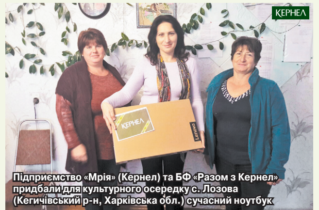
Підприємство «Мрія» (Кернел) та БФ «Разом з Кернел» придбали для культурного осередку с. Лозова (Кегичівський р-н, Харківська обл.) сучасний ноутбук