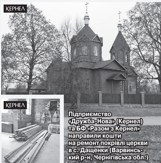
Підприємство «Дружба-Нова» (Кернел) та БФ «Разом з Кернел» направили кошти на ремонт покрівлі церкви в с. Дашенки (Варвинський р-н, Чернігівська обл.)

Неодмінним символом віри та надії для жителів українських сіл була й залишається церква. Адже саме до церкви йде людина і у свята, і тоді, коли у неї виникають труднощі. Проте, незважаючи на свою затребуваність, храмові споруди в більшості сіл або потребують капітальних та поточних ремонтів, або відсутні взагалі. Тому агропідприємства компанії Кернел та БФ «Разом з Кернел» намагаються по можливості реагувати на проблеми осередків духовності в підопічних селах, виділяючи необхідне фінансування.