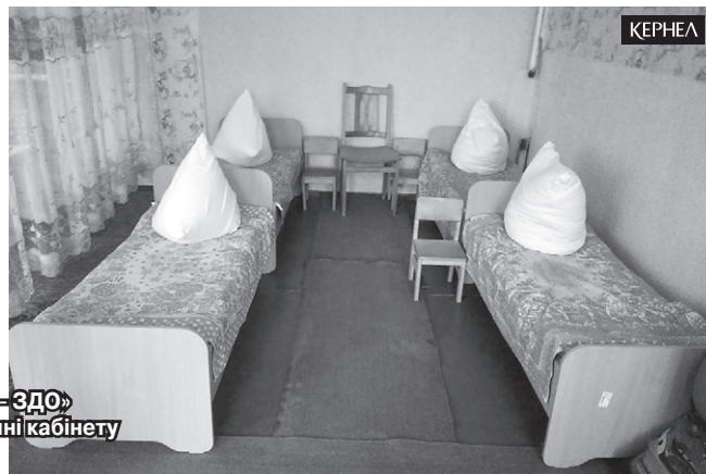
Вихованці та педагогічний колектив Бранцівського НВК «Початкова школа – ЗДО» (Краснопільський р-н, Сумська обл.) дякують Кернел за допомогу в облаштуванні кабінету першокласників та кімнат садочка