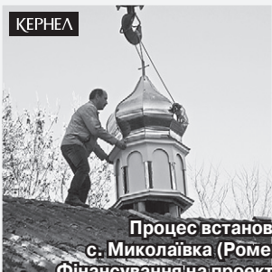
Процес встановлення купола в церкві с. Миколаївка (Роменський р-н, Сумська обл.). Фінансування на проект спрямувала компанія Кернел