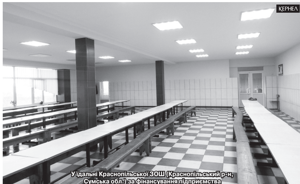
Їдальні Краснопільської ЗОШ (Краснопільський р-н, Сумська обл.) за фінансування підприємства «Дружба-Нова» (Кернел) та БФ «Разом з Кернел» пройшли капітальні ремонтні приміщень

«Два роки поспіль наша школа зіштовхувалася з нагальною необхідністю заміни частини