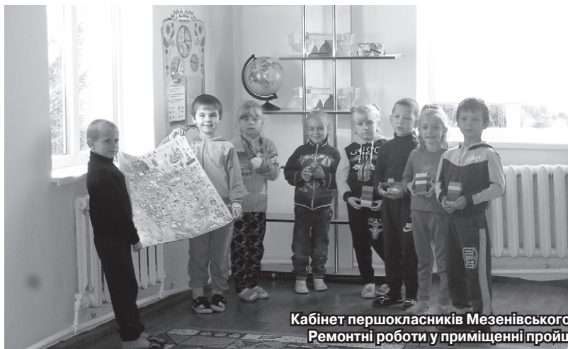
Кабінет першокласників Мезенівського НВК (Краснопільський р-н, Сумська обл.). Ремонтні роботи у приміщенні пройшли за фінансової участі компанії Кернел

З повагою, громада с. Талалаївка (Ніжинський р-н, Чернігівська обл.)