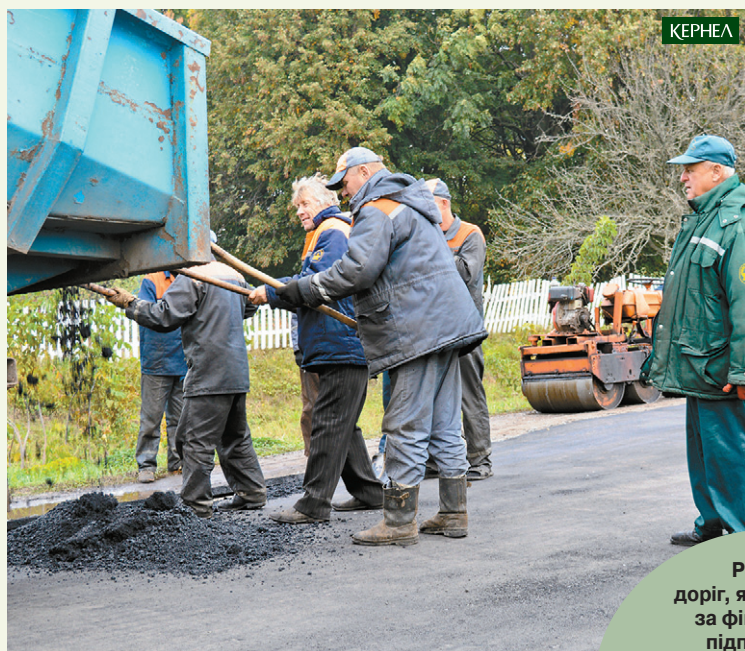
Ремонт доріг, які проходили за фінансування підприємства «Дружба-Нова» (Кернел) та БФ «Разом з Кернел» у с. Мала Кошелівка (Ніжинський р-н, Чернігівська обл.) та Діброва (Роменський р-н, Сумська обл.)

Серед соціальних проектів, на які агропідприємства компанії Кернел та БФ «Разом з Кернел» направляють систематичне фінансування, важливе місце посідають ті, що орієнтовані на підвищення благоустрою та інфраструктури сільських територій. Пропонуємо Вашій увазі чергову порцію добрих справ Кернел, реалізованих за фінансової участі підприємства «Дружба-Нова» (Кернел) та БФ «Разом з Кернел» у селах Сумщини, Чернігівщини та Полтавщини. Мова про ремонт доріг у Малій Кошелівці (Ніжинський р-н, Чернігівська обл.), Діброві (Роменський р-н, Сумська обл.) та Полянному (Тростянецький р-н, Сумська обл.), про відновлення освітлення у Стецьківці (Сумський р-н, Сумська обл.), а також про проекти зі спорудження водогонів у Писарівці (Сумський р-н, Сумська обл.) та Каплинцях (Пирятинський р-н, Полтавська обл.). Бюджет витрат Кернел на вищеперераховані проекти склав 650 тис. грн.