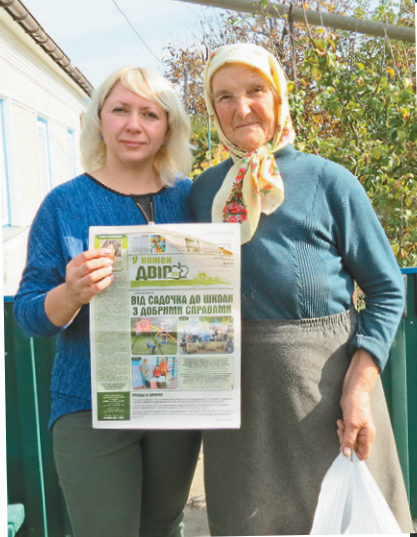
Представники компанії Кернел вітають жителів сіл Катеринопільського й Тальнівського районів Черкащини з Днем людей похилого віку