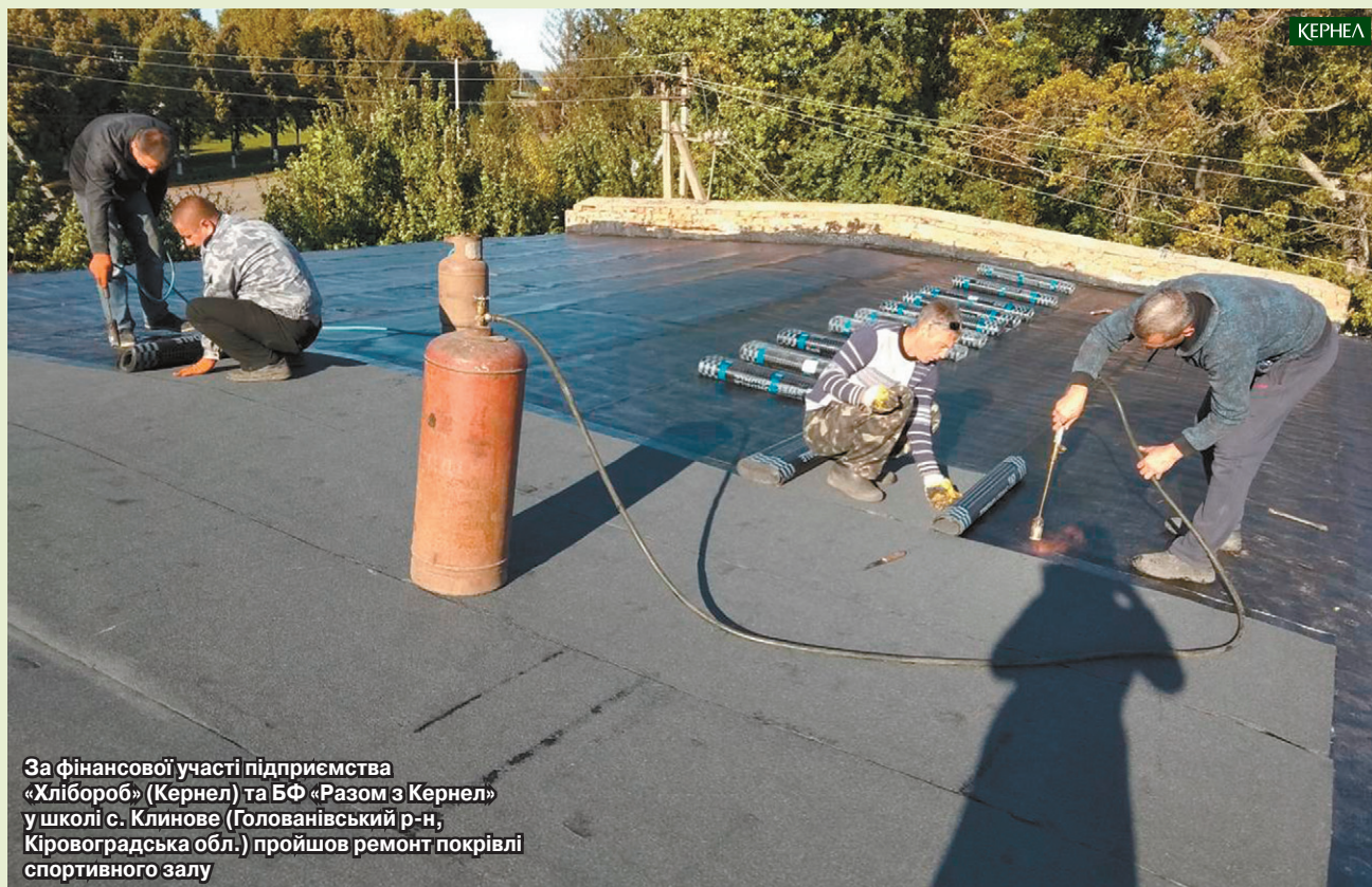
За фінансової участі підприємства «Хлібороб» (Кернел) та БФ «Разом з Кернел» у школі с. Клинове (Голованівський р-н, Кіровоградська обл.) пройшов ремонт покрівлі спортивного залу