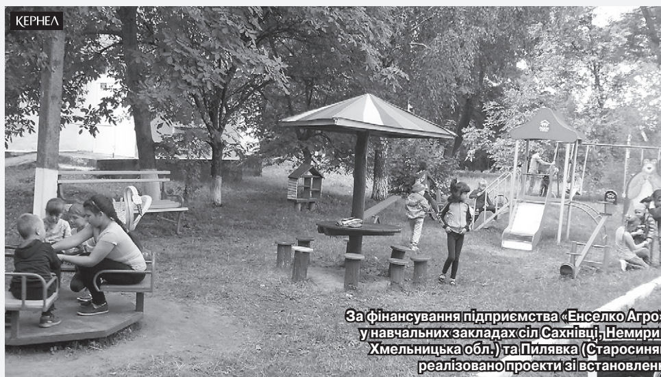
За фінансування підприємства «Енселко Агро» (Кернел) та БФ «Разом з Кернел» у навчальних закладах сіл Сахнівці, Немиринці (Старокостянтинівський р-н, Хмельницька обл.) та Пилявка (Старосинявський р-н, Хмельницька обл.) реалізовано проекти зі встановлення дитячих майданчиків

Ми неодноразово розповідали на шпальтах газети, як школи та дитячі садочки Хмельниччини спільно з підприємством «Енселко Агро» (Кернел) та БФ «Разом з Кернел» втілюють у життя важливі справи — проводять поточні ремонти, покращують матеріально-технічну базу, організовують цікаві екскурсії. Наразі ми підготували для Вас чергову порцію проектів, реалізованих за фінансового сприяння Кернел з думкою про дітей. Бюджет витрат Компанії склав понад 750 тис. грн. Детальніше — в наших інформаційних добірках.