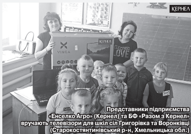
Представники підприємства «Енселко Агро» (Кернел) та БФ «Разом з Кернел» вручають телевізори для шкіл сіл Григорівка та Воронківці (Старокостянтинівський р-н, Хмельницька обл.)