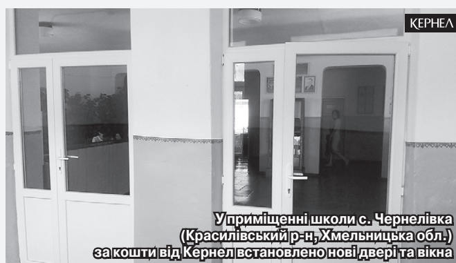
У приміщенні школи с. Чернелівка (Красилівський р-н, Хмельницька обл.) за кошти від Кернел встановлено нові двері та вікна