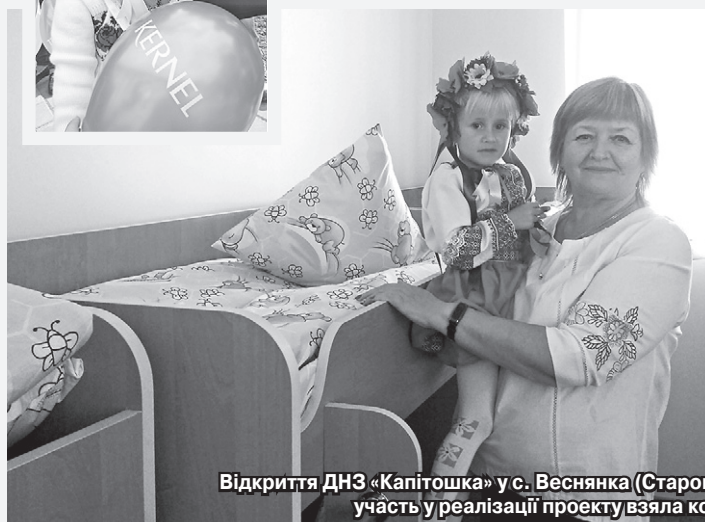
Відкриття ДНЗ «Капітошка» у с. Веснянка (Старокостянтинівський р-н, Хмельницька обл.). Фінансову участь у реалізації проекту взяла компанія Кернел та БФ «Разом з Кернел»

Повітряні кулі, весела музика, схвилювані батьки, почесні гості й подарунки. 13 вересня в селі Веснянка, що у Старокостянтинівському районі Хмельниччини, відбулася справді довгоочікувана подія. Тут за фінансової підтримки компанії Кернел та БФ «Разом з Кернел» реалізовано проект із реставрації дошкільного навчального закладу «Капітошка». Компанія направила кошти на умеблювання закладу. Відтепер 28 найменших жителів села виховуватимуться в комфортних умовах.