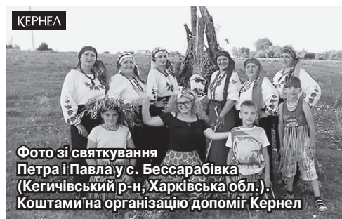
Фото зі святкування Петра і Павла у с. Бессарабівка (Кегичівський р-н, Харківська обл.). Коштами на організацію допоміг Кернел