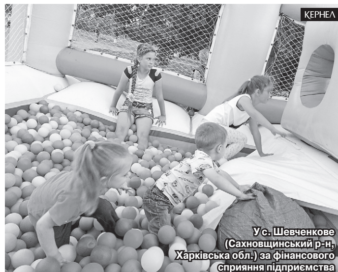
У с. Шевченкове (Сахновщинський р-н, Харківська обл.) за фінансового сприяння підприємства «Мрія» (Кернел) та БФ «Разом з Кернел» відзначили Івана Купала

котеку. Хочу подякувати Кернел за спонсорство. Додам, що Компанія раніше допомагала у придбанні музичної апаратури для Будинку культури, завдяки чому ми маємо змогу поводити подібні свята. А ще аграрії співфінансуватимуть проект із придбання соціального автобуса для пенсіонерів, який обслуговуватиме населення декількох сіл, та надавали кошти для літнього оздоровлення дітей. Дякую Кернел за добрі справи!»