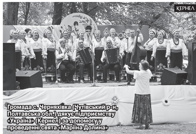
Громада с. Черняхівка (Чутівський р-н, Полтавська обл.) дякує підприємству «Україна» (Кернел) за допомогу у проведенні свята «Марііна Долина»

«Щороку в Черняхівці проходить обласне свято «Марііна Долина», присвячене творчості відомої поетеси та письменниці Марії Башкирцевої. Вона певний час жила в нашому селі. Цьогоріч у рамках заходу організовано театралізовані виступи, а також виступи кращих аматорських колективів Чутівщини, обласну виставку-конкурс робіт художників та майстрів декоративно-прикладного та ужиткового мистецтва, спортивні змагання та розваги, атракціони для дітей. Фінансову допомогу для організації заходу надали підприємство «Україна» (Кернел) та БФ «Разом з Кернел». Наголошу на тому, що з цієї Компанією ми маємо тісну співпрацю. Традиційно аграрії надають підтримку у проведенні спортивних заходів, днів села, за їхньої допомоги реалізуються різноманітні соціальні програми, за що дякуємо Кернел».