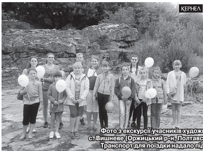
Фото з екскурсії учасників художньої самодіяльності Будинку культури с. Вишневе (Оржицький р-н, Полтавська обл.) до визначних місць Черкащини. Транспорт для поїздки надало підприємство «Вишневе-Агро» (Кернел)