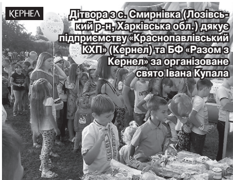
Дітвора з с. Смирнівка (Лозівський р-н, Харківська обл.) дякує підприємству «Краснопавлівський КХП» (Кернел) та БФ «Разом з Кернел» за організоване свято Івана Купала

ті вдалися на славу: театральне дійство з русалками, водянниками, купальське вогнище, спеціально підготовлені концертні номери, а по завершенні — дискотека для молоді. Особливо раділи дійству дітки, адже для них було організовано особливу програму з атракціонами (зокрема батутами). Саме цю розвагу для малечі оплатив Кернел. А ще громада вдячна кернелівцям за придбання меблів для кабінету першокласників нашої школи (сума становить 68 тис. грн), за кошти на ремонт навісу та придбання дверей для дитячого садочка (30 тис. грн). Приємно працювати з Компанією, яка дбає про інтереси громади, сподіваємося, так буде й надалі».