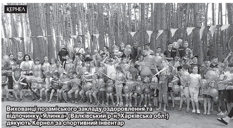
Вихованці позаміського закладу оздоровлення та відпочинку «Ялинка» (Валківський р-н, Харківська обл.) дякують Кернел за спортивний інвентар