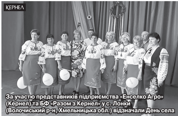
За участю представників підприємства «Енселко Агро» (Кернел) та БФ «Разом з Кернел» у с. Лонки (Волочиський р-н, Хмельницька обл.) відзначали День села

Варто зауважити, що Компанія неодноразово підтримувала соціальну сферу та благоустрій села. Нещодавно тут завершено грейдерування доріг, коштами на придбання щебеню допомогли кернелівці. Раніше за кошти від «Енселко Агро» (Кернел) та БФ «Разом з Кернел» у місцевий дитячий садочок було придбано електроплиту, а клуб отримав музичну апаратуру. Словом, Компанія тримає руку на пульсі потреб громади!