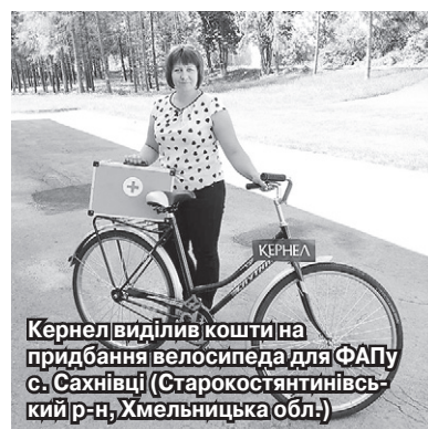
Кернел виділив кошти на придбання велосипеда для ФАПу с. Сахнівці (Старокостянтинівський р-н, Хмельницька обл.)

«З підприємством «Енселко Агро» (Кернел) та БФ «Разом з Кернел» ми співпрацюємо не вперше. У минулі роки Компанія брала фінансову участь у проєкті капітального ремонту приміщення ФАПу. А тепер кернелівці зробили нам черговий подарунок — велосипед. Цей транспорт справді необхідний закладу. Адже