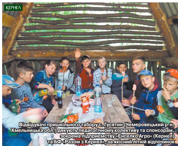
Відвідувачі пришкольного табору с. Гусятин (Чемеровецький р-н, Хмельницька обл.) дякують педагогічному колективу та спонсорам, зокрема підприємству «Енселко Агро» (Кернел) та БФ «Разом з Кернел», за якісний літній відпочинок

Малеча, яка навчається у школі с. Гусятин (Чемеровецький р-н, Хмельницька обл.), також мала шанс якісно провести літнє дозвілля у пришкольньому таборі відпочинку, який традиційно діє при тутешній школі.