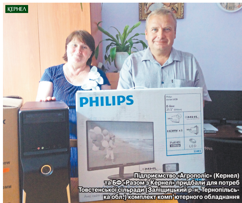
Підприємство «Агрополіс» (Кернел) та БФ «Разом з Кернел» придбали для потреб Товстенської сільради (Заліщицький р-н, Тернопільська обл.) комплект комп'ютерного обладнання

Громада смт Товсте, що в Заліщицькому районі Тернопільщини, не з чуток знає про добрі справи, реалізовані за фінансової підтримки підприємства «Агрополіс» (Кернел) та БФ «Разом з Кернел». Бо вже декілька років поспіль саме Компанія є їхнім помічником і партнером.