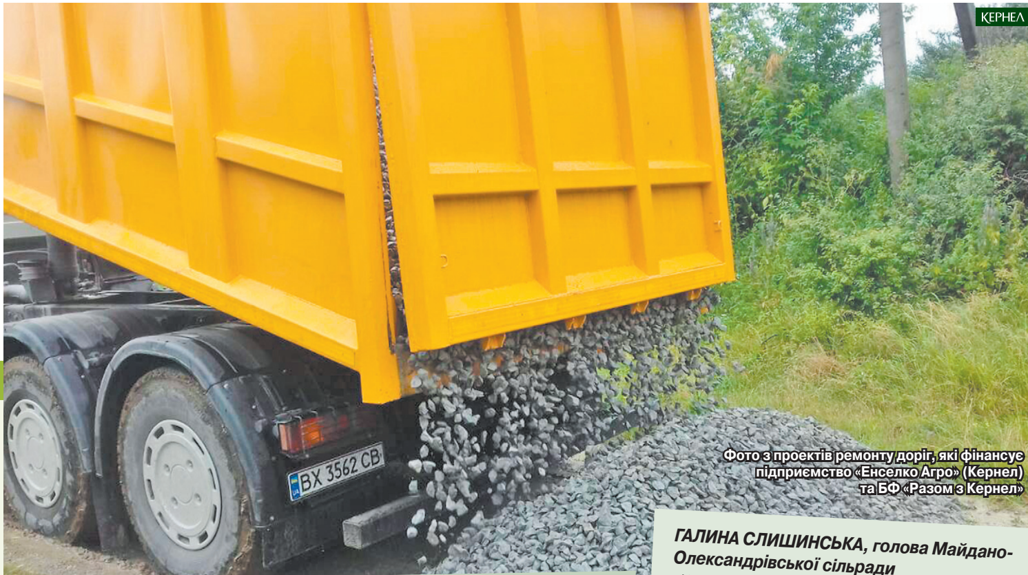
Фото з проектів ремонту доріг, які фінансує підприємство «Енселко Агро» (Кернел) та БФ «Разом з Кернел»

«Уже кілька років поспіль спільними зусиллями громади, влади та соціально відповідального бізнесу (йдеться про підприємство — орендаря земель нашої сілради, «Енселко Агро» (Кернел) та БФ «Разом з Кернел») ми втілюємо в життя проекти, спрямовані на покращення стану дорожнього покриття. Цьогоріч аграрії придбали для нас 180 т щебеню, а з сільської скарбниці направлено кошти на його вивезення та розгортання. Таким чином упорядковано вулиці Набережну та Миколи Флерка в Деркачах, а також вулицю Шевченка в Немиринцях. Зауважу, що ми плідно співпрацюємо з Кернел не лише в напрямку ремонту доріг, хоча саме він є пріоритетним. Наприклад, торік ми якісно попрацювали в сегменті створення комфортних умов навчання в Немиринецькій школі, зокрема повели капітальний ремонт харчоблоку, який пройшов за фінансової участі Компанії. А ще кілька років поспіль разом відновлювали вуличне освітлення. Тепер у Немиринцях це питання вирішено повністю, а в Деркачах нічне освітлення з'явилося на 75% вулиць. Словом, дякую Кернел за всебічну підтримку!»