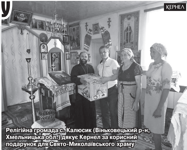
Релігійна громада с. Калюсик (Віньковецький р-н, Хмельницька обл.) дякує Кернел за корисний подарунок для Свято-Миколаївського храму

Нагадаємо, торік завдяки допомозі підприємства «Енселко Агро» (Кернел) та Благодійного фонду був проведений поточний ремонт під'їзної дороги між селами Калюсик та Осламів. Протяжність шляху — близько 4 км. А у 2016 році Компанія долучилася до проектів з покращення стану шляхів між селами Карачіївці й Калюсик, Карачіївці та Майдан-Олександрівський.