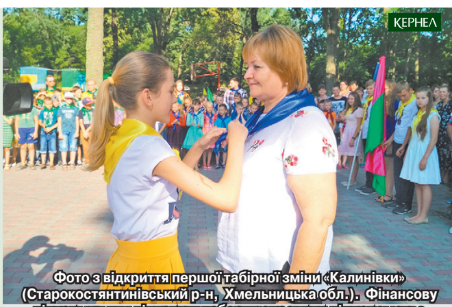
Фото з відкриття першої табірної зміни «Калинівки» (Старокостянтинівський р-н, Хмельницька обл.). Фінансову підтримку для відкриття табору направили підприємство «Енселко Агро» (Кернел) та БФ «Разом з Кернел»

Вже третій рік поспіль агропідприємство «Енселко Агро» (Кернел) та БФ «Разом з Кернел» долучаються до важливого в житті Старокостянтинівського району проекту — підготовки заміського закладу оздоровлення та відпочинку «Калинівка» до сезону. Цьогоріч Компанія спрямувала на це 150 тис. грн. Кошти використано для покращення інфраструктури табору.