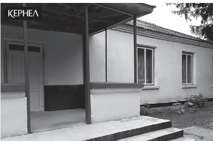
Завдяки фінансовій участі компанії Кернел та БФ «Разом з Кернел» у с. Мала Вулига (Тиврівський р-н, Вінницька обл.) здійснено капітальний ремонт приміщення для проведення заходів, а також укомплектовано дитячий майданчик