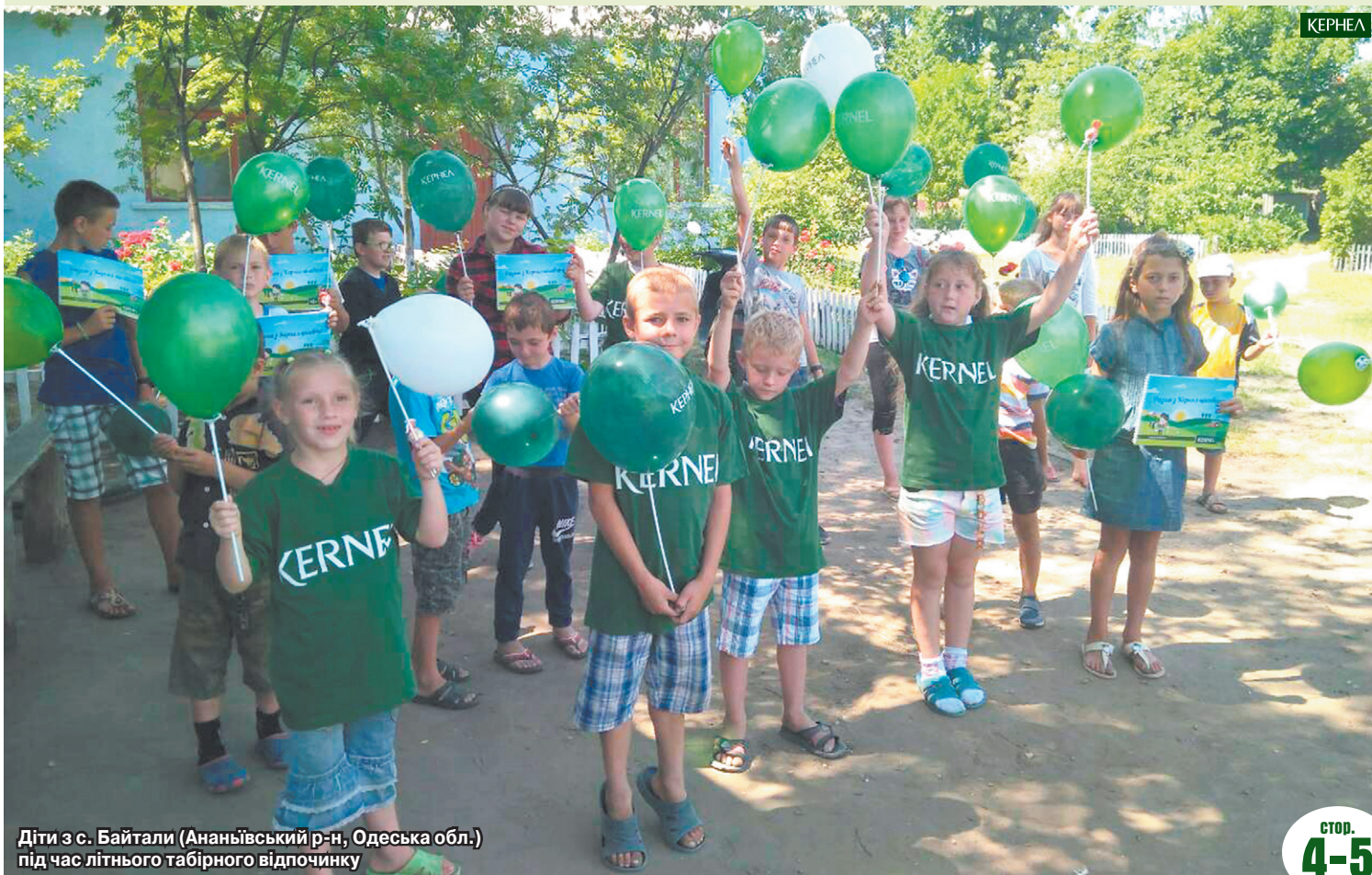
Діти з с. Байтали (Ананьївський р-н, Одеська обл.) під час літнього табірної відпочинку

У червні Кернел виділив понад 300 тис. грн школам і дитячим садочкам Черкащини, Миколаївщини, Одещини, Кіровоградщини та Вінниччини для підготовки до нового навчального року (йдеться про укомплектування меблями, необхідним обладнанням, проведення поточних ремонтів). Частину цих коштів використано на організацію роботи пришкільних таборів. Детальну інформацію шукайте в номері.