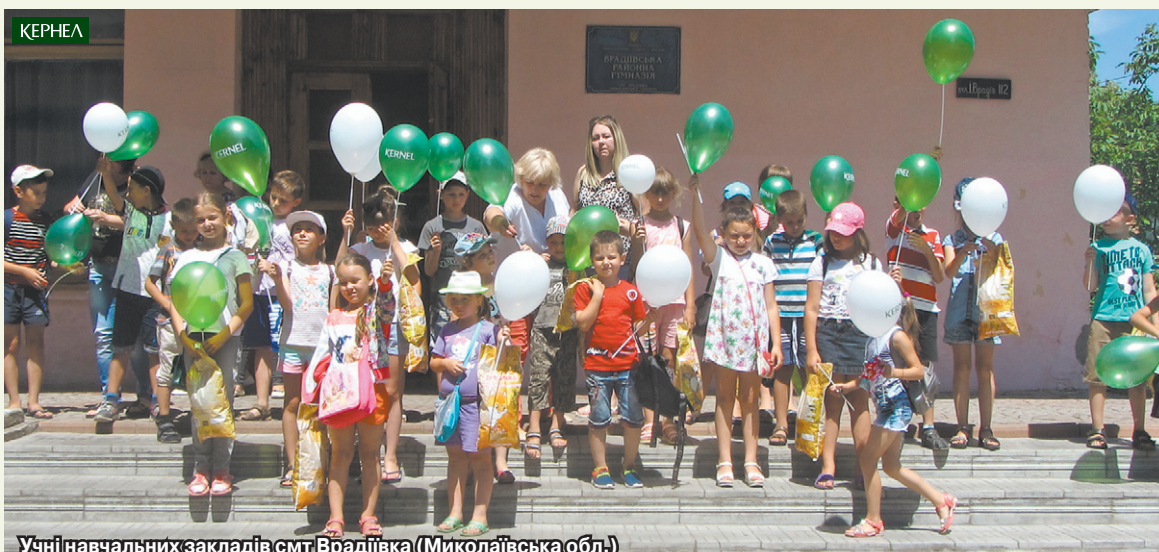
Учні навчальних закладів смт Врадівка (Миколаївська обл.) дякують підприємству «Україна» (Кернел) та БФ «Разом з Кернел» за якісний літній відпочинок

«Щороку на базі нашої школи працював літній табір для учнів. Нині його відвідувачами стали 35 дітей, зокрема пільгових категорій. Зазвичай для якісної організації табірної дозвілля фінанси виділяються з району. Проте цього року нам вдалося залучити кошти й від підприємства «Україна» (Кернел) та БФ «Разом з Кернел». Завдяки цьому ми покращили харчування дітей. Крім того, в останній день роботи табору кожна дитина отримала солодкий подарунковий набір від Кернел. Хочеться подякувати всім тим, хто причетний до справи літнього оздоровлення, зокрема Кернел — за радість та усмішки на дитячих обличчях».