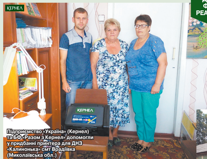
Підприємство «Україна» (Кернел) та БФ «Разом з Кернел» допомогли у придбанні принтера для ДНЗ «Калинонька» смт Врадівка (Миколаївська обл.)

На дворі літо, а у школах і дитячих садочках — сприятливий період для оновлення устаткування та ремонту приміщень. Традиційно компанія Кернел та БФ «Разом з Кернел» фінансово допомагають освітнім закладам у цьому процесі. Наразі агропідприємства Компанії та Благодійний фонд уже спрямували на відповідні проекти 280 тис. грн.