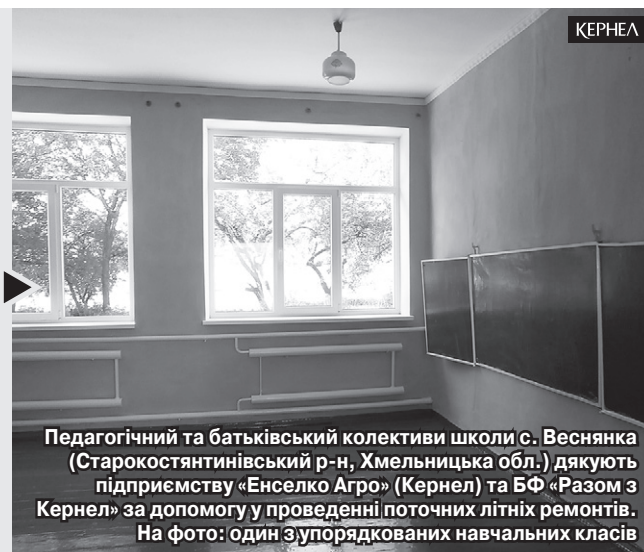
Педагогічний та батьківський колективи школи с. Веснянка (Старокостянтинівський р-н, Хмельницька обл.) дякують підприємству «Енселко Агро» (Кернел) та БФ «Разом з Кернел» за допомогу у проведенні поточних літніх ремонтів. На фото: один з упорядкованих навчальних класів

«Користуючись нагодою, хочу подякувати підприємству «Енселко Агро» (Кернел) та БФ «Разом з Кернел» за багаторічну плідну співпрацю. Ні для кого не секрет, що сільська освіта зараз потребує всебічної підтримки. Не є винятком і наша школа, де наразі навчається 106 учнів. Саме Кернел є одним з наших помічників і спонсорів. За роки співпраці ми спільно реалізували не одну добру справу — облаштували огорожу навколо приміщення навчального закладу, встановили вхідні двері, придбали телевізор, морозильну камеру, облицювали плиткою підлогу у шкільному коридорі, закупили меблі, стелажі для бібліотеки тощо. У травні аграрії направили кошти на проведення поточних ремонтів — закупівлю необхідних матеріалів. Сподіваємося, що і в майбутньому завдяки фінансовій підтримці Кернел ми продовжимо втілювати добрі справи з думкою про дітей».