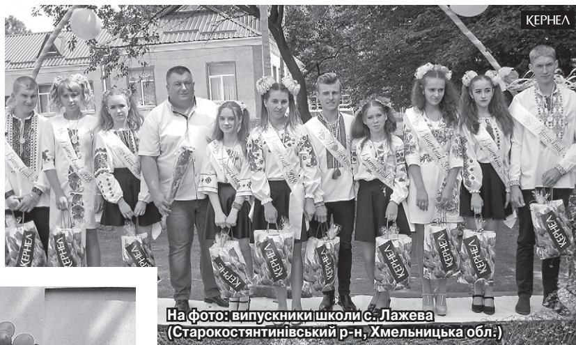
На фото: випускники школи с. Лажева (Старокостянтинівський р-н, Хмельницька обл.)