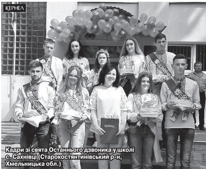
Кадри зі свята Останнього дзвоника у школі с. Сахнівці (Старокостянтинівський р-н, Хмельницька обл.)

На запрошення очільників сільських шкіл Хмельниччини й Тернопільщини представники агропідприємств компанії Кернел та Благодійного фонду «Разом з Кернел» завітали на відповідні урочистості у заклади. Пропонуємо ознайомитися з надісланими світлинами.