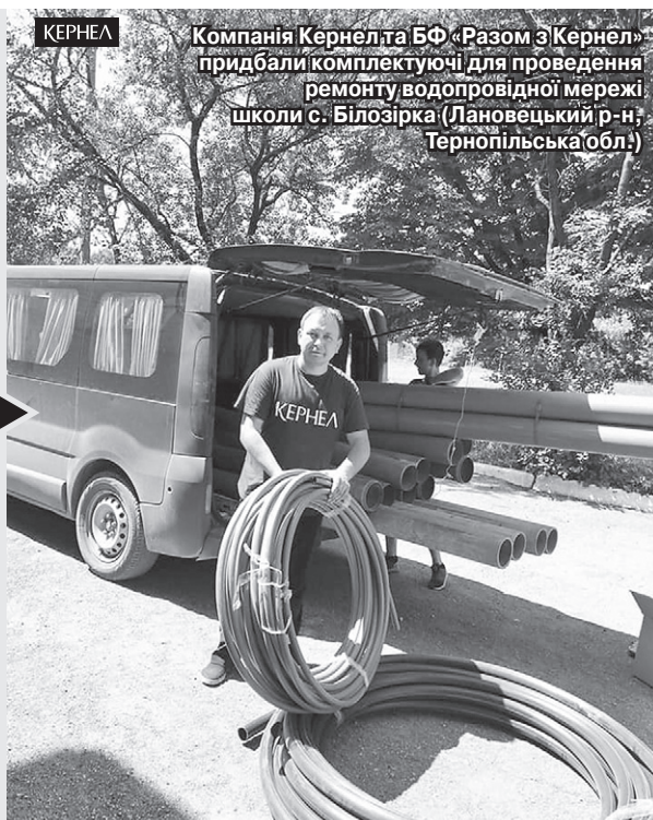
Компанія Кернел та БФ «Разом з Кернел» придбали комплектуючі для проведення ремонту водопровідної мережі школи с. Білозірка (Лановецький р-н, Тернопільська обл.)

«До централізованого водопостачання нашу школу було підключено майже 45 років тому. Зрозуміло, що за цей час комунікації (зокрема ті, що проходять у самій шкільній будівлі) зносилися, часто відбувалися прориви. Це приносило чималий дискомфорт як учням, так і працівникам закладу. Коли з'явилася можливість, ми вирішили звернутися по допомогу до аграріїв компанії Кернел. І нам не відмовили. Так, за кошти від Компанії та БФ «Разом з Кернел» уже придбано всі необхідні матеріали для реалізації проекту з оновлення водопровідної мережі школи. Сподіваємося, кернелівці допоможуть і у проведенні робіт. Ми дуже вдячні за надану підтримку».