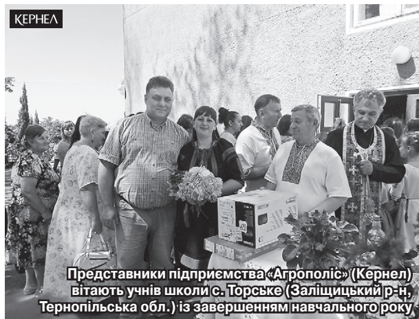
Представники підприємства «Агрополіс» (Кернел) вітають учнів школи с. Торське (Заліщицький р-н, Тернопільська обл.) із завершенням навчального року