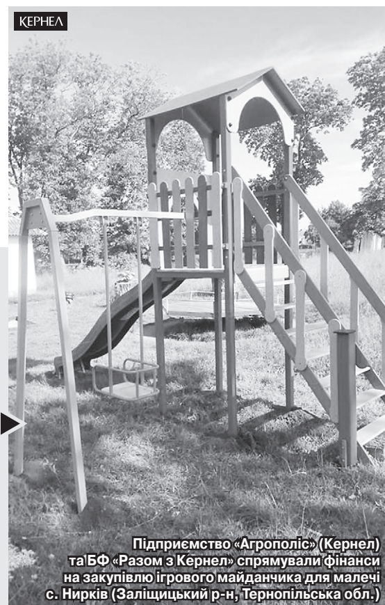
Підприємство «Агрополіс» (Кернел) та БФ «Разом з Кернел» спрямували фінанси на закупівлю ігрового майданчика для малечі с. Нирків (Заліщицький р-н, Тернопільська обл.)

«До початку літніх канікул підприємство «Агрополіс» (Кернел) спільно з БФ «Разом з Кернел» зробило малечі з нашого села чудовий сюрприз. Йдеться про новий ігровий майданчик, встановлений на території дитячого садочка «Сонечко». Раніше такої зони відпочинку ні вихованці закладу, ні решта наших дітлахів не мали. Наразі тут встановлено дитячу гірку та каруселі. Додам, що саме Кернел є постійним помічником як для нашої громади, так і безпосередньо для ДНЗ. Місяцем раніше Компанія допомагала у підсипці сільських доріг (придбанні щебеню). У дитячий садочок за кошти від «Агрополіс» (Кернел) та Благодійного фонду придбано холодильне обладнання, дитячі кріселка. Неодноразово надавалася допомога продуктами харчування. Дякуємо аграріям за те, що не стоять осторонь потреб найменших мешканців села».