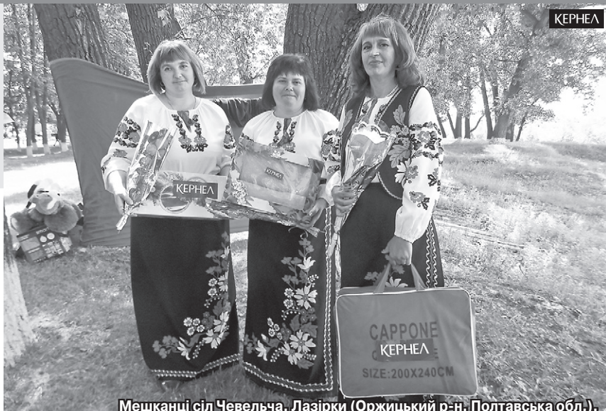
Мешканці сіл Чевельча, Лазірки (Оржицький р-н, Полтавська обл.), Супоївка (Яготинський р-н, Київська обл.) дякують компанії Кернел та БФ «Разом з Кернел» за весело проведені дні села

«Зазвичай ми відзначали День села на зимового Миколи, 19 грудня. Цьогоріч