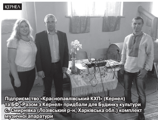
Підприємство «Краснопавлівський КХП» (Кернел) та БФ «Разом з Кернел» придбали для Будинку культури с. Смирнівка (Лозівський р-н, Харківська обл.) комплект музичної апаратури

Здавна Харківщина славилася своїми людьми, залюбленими в пісню й музику, які шанують прадідівське слово та звичаї. Осередками збереження культурної спадщини завжди були сільські будинки культури та клуби. Такий заклад існує і в с. Смирнівка, що в Лозівському районі області.