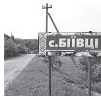
У селах Бієвецької сільради (Лубенський р-н, Полтавська обл.) за кошти підприємства «Вишневе-Агро» (Кернел) та БФ «Разом з Кернел» встановлено нові дорожні знаки