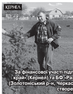
За фінансової участі підприємства «Придніпровський край» (Кернел) та БФ «Разом з Кернел» у с. Подільське (Золотоніський р-н, Черкаська обл.) реалізовано проєкт зі створення скверу

Відтепер жителі Подільського можуть милуватися шедеврами природи. А вже на 1 га площі висадили близько 37 видів декоративних рослин і кущів. Серед них японська сакура, глід, магнолії, дікі яблунки, тюльпанове дерево тощо. До речі, засаджували сквер спільними зусиллями. Кернелівці також із задоволенням долучилися до цього процесу.