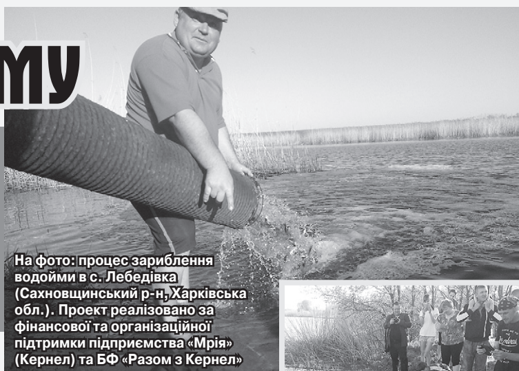
На фото: процес зариблення водойми в с. Лебедівка (Сахновщинський р-н, Харківська обл.). Проект реалізовано за фінансової та організаційної підтримки підприємства «Мрія» (Кернел) та БФ «Разом з Кернел»

госпідприємство. Що стосується стану водойми у Лебедівці, то він дійсно бажав кращого. Уся фауна, яка там мешкала, обмежувалася популяцією жаб. Для того щоб не допустити повного замулення та знищення ставка, керівництво підприємства «Мрія» (Кернел) проявило ініціативу реалізувати проект із зариблення водойми. Ми дуже