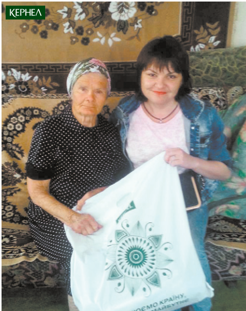
Представники підприємств «Мрія» (Кернел) та «Краснонапівський КХП» (Кернел) вітають жителів сіл Харківщини зі святом Перемоги