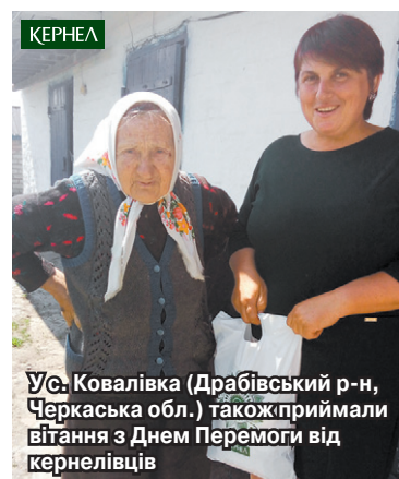
У с. Ковалівка (Драбівський р-н, Черкаська обл.) також приймали вітання з Днем Перемоги від кернелівців