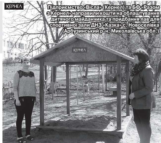
Підприємство «Вісла» (Кернел) та БФ «Разом з Кернел» направили кошти на облаштування дитячого майданчика та придбання лав для спортивної зали ДНЗ «Казка» с. Новоселівка (Арбузинський р-н, Миколаївська обл.)

До речі, кернелівці допомагають дитячому садочку у ще одному надважливому питанні. Оскільки заклад не має централізованого водопостачання, то підвезення води забезпечують саме аграрії підприємства «Вісла» (Кернел).