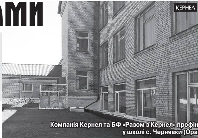
Компанія Кернел та БФ «Разом з Кернел» профінансували проект із придбання та встановлення вікон у школі с. Чернявки (Оратівський р-н, Вінницька обл.)

Коли влітку минулого року на землях Оратівщини, зокрема й Чернявки, почав працювати новий орендар — компанія Кернел, то його представники під час першої зустрічі з сільською