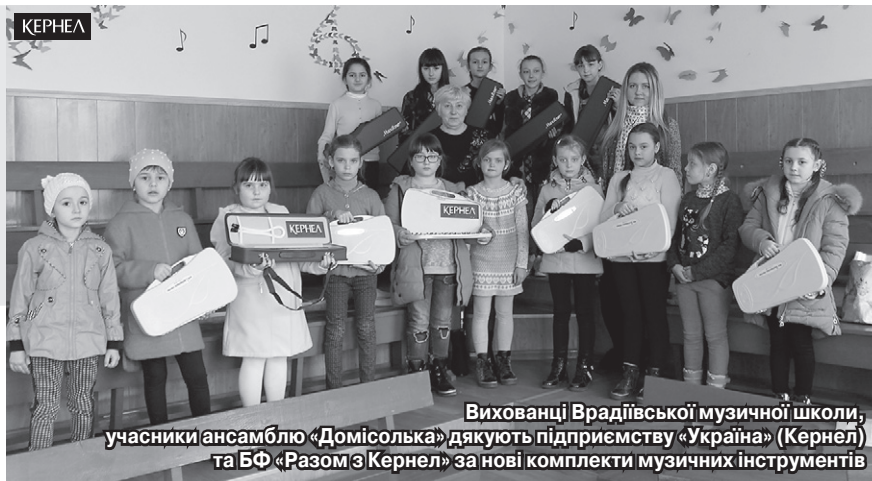
Вихованці Врадіївської музичної школи, учасники ансамблю «Домісолька» дякують підприємству «Україна» (Кернел) та БФ «Разом з Кернел» за нові комплекти музичних інструментів