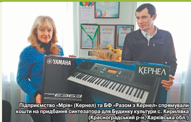
Підприємство «Мрія» (Кернел) та БФ «Разом з Кернел» спрямували кошти на придбання синтезатора для Будинку культури с. Кирилівка (Красноградський р-н, Харківська обл.)

— Додам, що аграрії допомагають нам у благоустрої, роз-