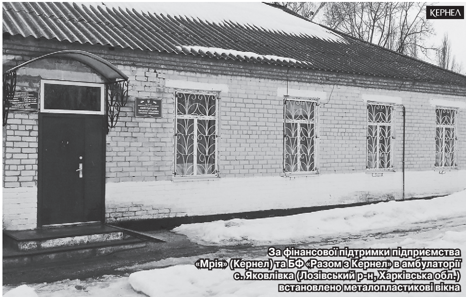
За фінансової підтримки підприємства «Мрія» (Кернел) та БФ «Разом з Кернел» в амбулаторії с. Яковлівка (Лозівський р-н, Харківська обл.) встановлено металопластикові вікна

— Зауважу, що амбулаторія обслуговує понад 1 тис. населення — жителів Яковлівки, Оддихного, Веселого, Степанівки, Сергіїв-