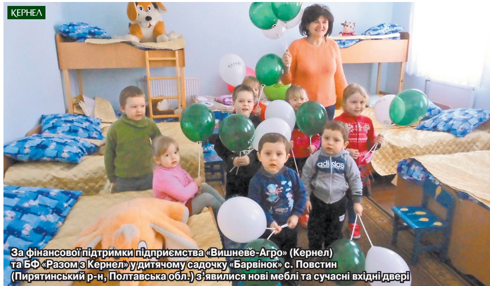
За фінансової підтримки підприємства «Вишневе-Агро» (Кернел) та БФ «Разом з Кернел» у дитячому садочку «Барвінок» с. Повстин (Пирятинський р-н, Полтавська обл.) з'явилися нові меблі та сучасні вхідні двері

— Приємно мати поруч таких помічників, — завершує керівник садочка. — Дякую Кернел за турботу! А нам усім бажаю успіхів і процвітання.