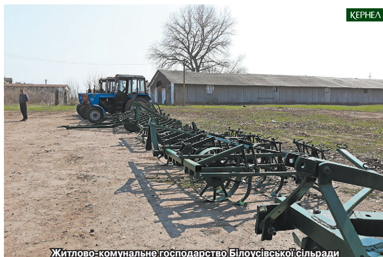
Житлово-комунальне господарство Білоусівської сільради (Драбівський р-н, Черкаська обл.) отримало с/г техніку від компанії Кернел

«Переконали, що у новоствореного комунального підприємства «Чумгак» є майбутнє. Приємно, що у процесі створення господарства та забезпечення його матеріальними ресурсами визначну роль відіграло підприємство-орендар «Придніпровський край» (Кернел). Це є черговим свідченням того, що аграрії, які і влада, зацікавлені в тому, щоб селянам жилося краще, щоб було чим виорати присадибну ділянку, викосити бур'яни, вивезти сміття. А головне — ми заручилися підтримкою однодумців і разом втілюємо в життя взаємовигідну для обох сторін справу».