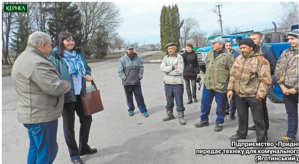
Підприємство «Придніпровський край» (Кернел) передає техніку для комунального підприємства «Чумгак» с. Богданівка (Яготинський р-н, Київська обл.)