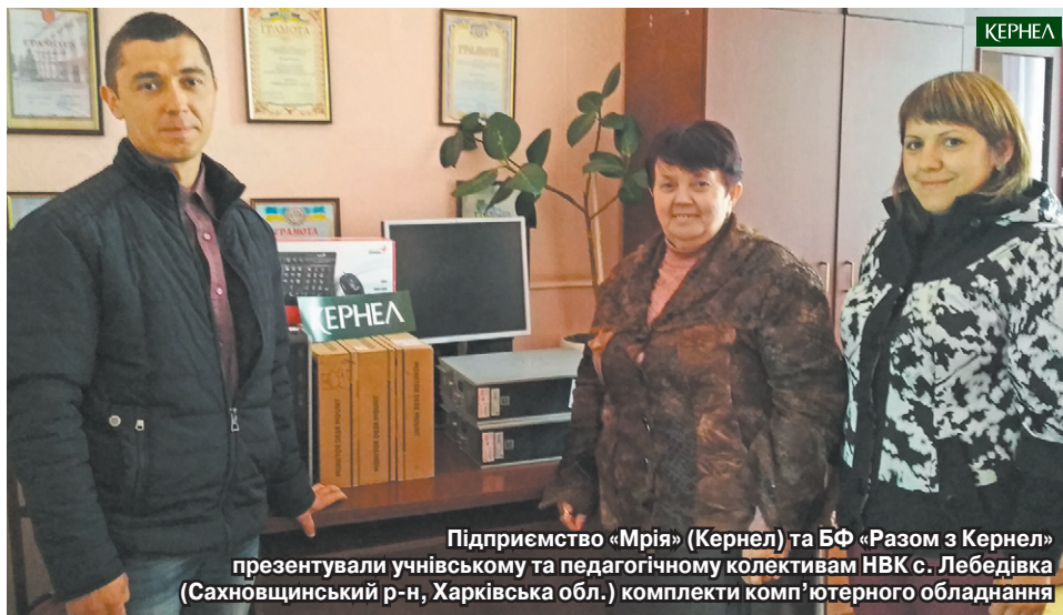
Підприємство «Мрія» (Кернел) та БФ «Разом з Кернел» презентували учнівському та педагогічному колективам НВК с. Лебедівка (Сахновщинський р-н, Харківська обл.) комплекти комп'ютерного обладнання