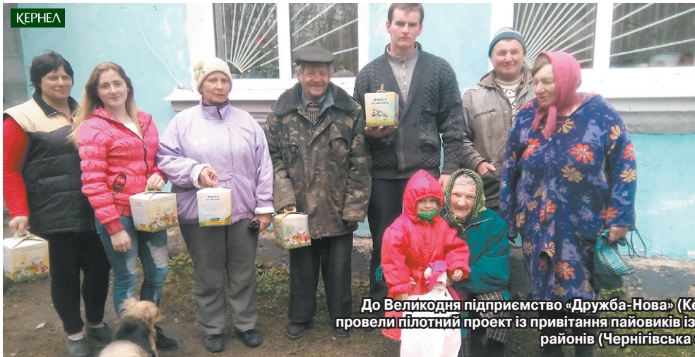
До Великодня підприємство «Дружба-Нова» (Кернел) та БФ «Разом з Кернел» провели пілотний проект із привітання пайовиків із сіл Ріпкинського та Куликівського районів (Чернігівська обл.)

«Щороку ми намагаємося пропонувати своїм пайовикам чимало вигідних умов співробітництва та реалізовувати проекти, які б позитивно впливали на життя селян та повсякчас доводили, що Кернел — це Компанія, лояльна до свого орендодавця, соціальна політика якої побудована навколо його інтересів та потреб. Мешканцям підопічних сіл Чернігівщини, Сумщини та Полтавщини дуже добре знайомі традиційні привітальні проекти, приурочені до Дня Перемоги, Дня знань, новорічно-різдвяних свят. Цьогоріч ми вирішили реалізувати пілотний проект із привітання з Великодніми святами. Чому пілотний? Бо він охопив лише певну частину пайовиків, і на його прикладі ми повинні були виявити всі складнощі та чинники, що можуть впливати на якість його реалізації в майбутньому. На щастя, проект реалізований успішно і матиме продовження в наступному році. А його географія розшириться на орендодавців усіх сіл регіону, де Кернел обробляє землі».