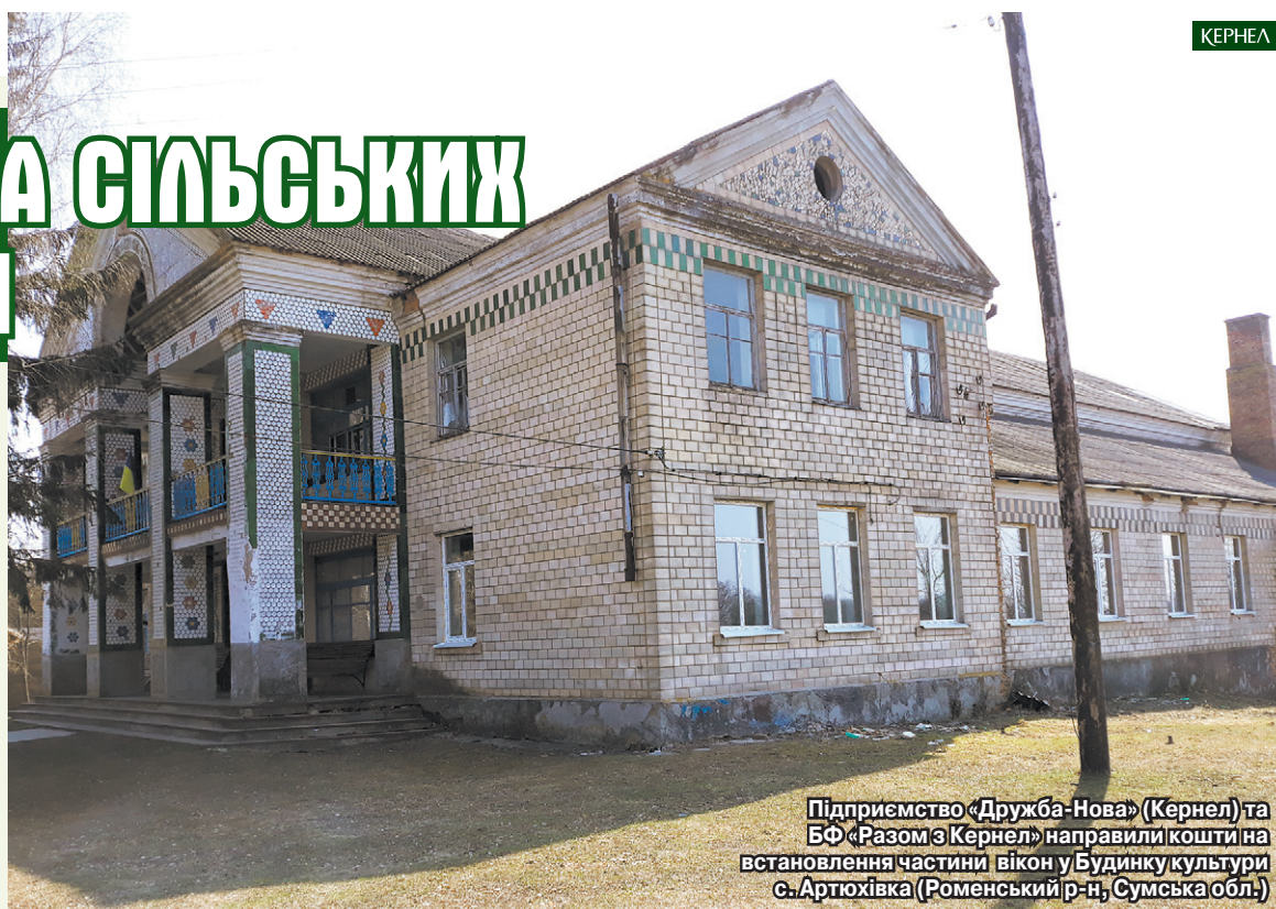
Підприємство «Дружба-Нова» (Кернел) та БФ «Разом з Кернел» направили кошти на встановлення частини вікон у Будинку культури с. Артюхівка (Роменський р-н, Сумська обл.)

старт проекту — вісім сучасних металопластикових конструкцій. Хочу подякувати всім, хто робить свій внесок у відродження української культури та традицій, тим людям та організаціям, які не стоять осторонь проблем культурних осередків та художньої самодіяльності.