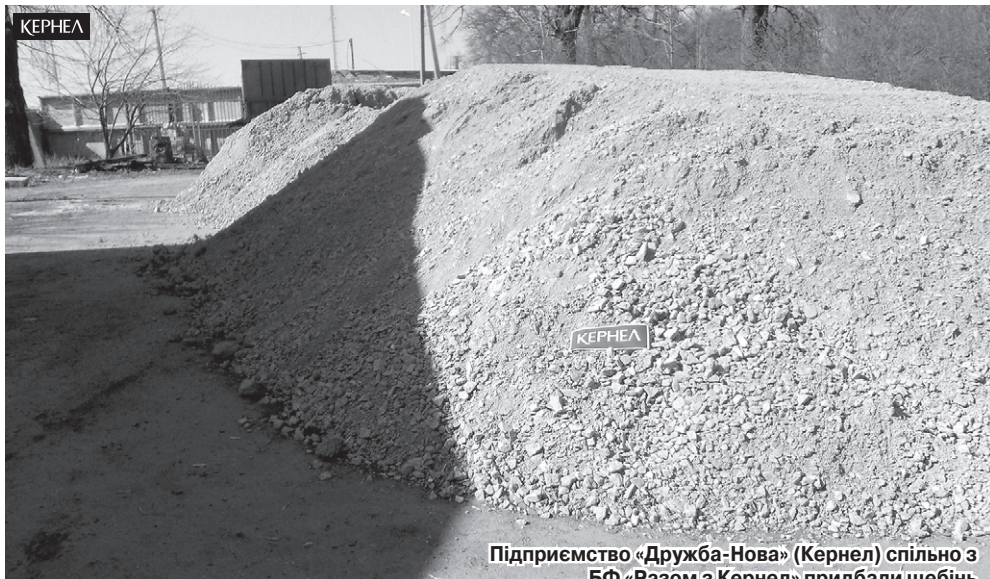
Підприємство «Дружба-Нова» (Кернел) спільно з БФ «Разом з Кернел» придбали щебін для підсипки доріг у смт Терни (Недригайлівський р-н, Сумська обл.)