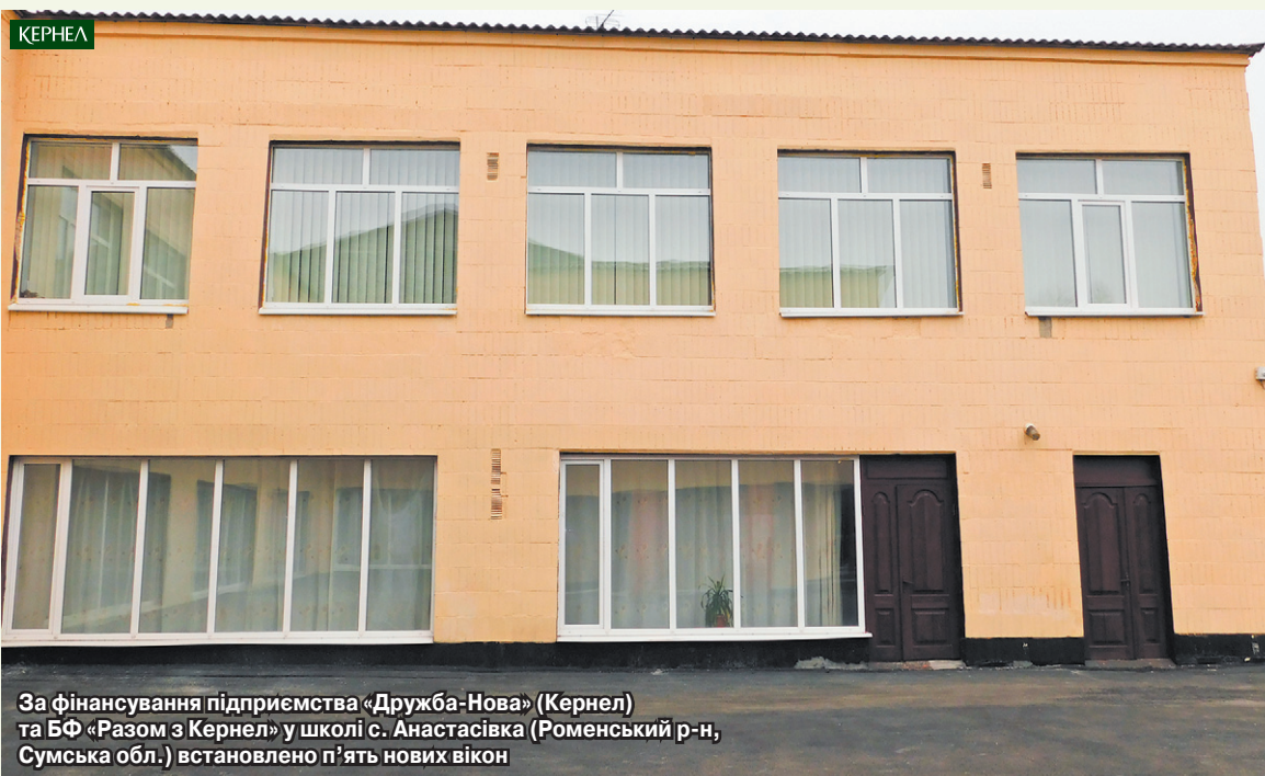
За фінансування підприємства «Дружба-Нова» (Кернел) та БФ «Разом з Кернел» у школі с. Анастасівка (Роменський р-н, Сумська обл.) встановлено п'ять нових вікон

Новини в українському селі поширюються швидко. Як-от інформація про те, що у школі села Анастасівка, що в Роменському районі Сумщини, встановлено нові вікна. З коштами на проект допоміг орендар земель — підприємство «Дружба-Нова» (Кернел) та Благодійний фонд «Разом з Кернел».