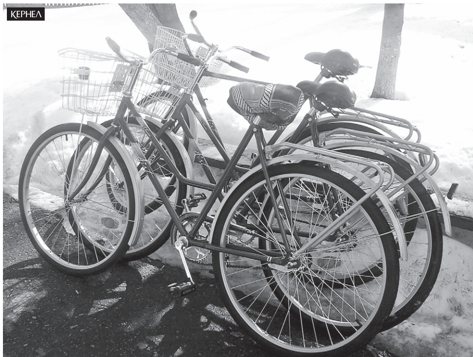
Підприємство «Дружба-Нова» (Кернел) та БФ «Разом з Кернел» виділили кошти на придбання велосипедів для відділення поштового зв'язку та запасних частин для пожежної машини у с. Вільшане (Сосницький р-н, Чернігівська обл.)