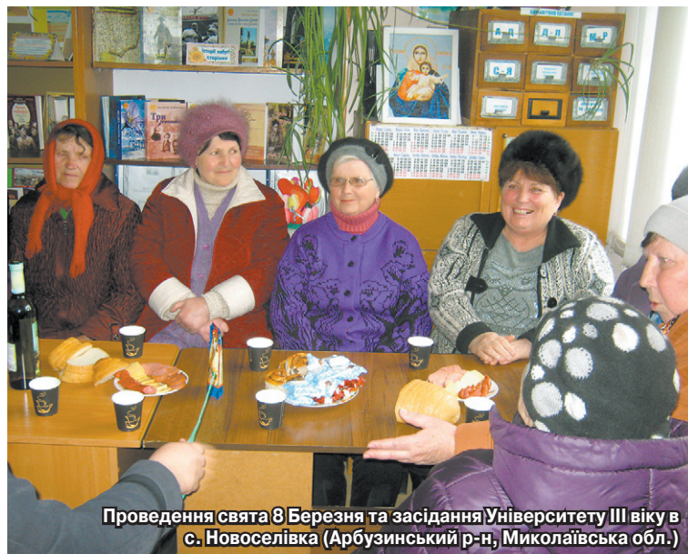
Проведення свята 8 Березня та засідання Університету III віку в с. Новоселівка (Арбузинський р-н, Миколаївська обл.)

— Здебільшого учасники таких засідань — місцеві жителі, пенсіонери, які із задоволенням приходять на заняття, — коментує наша співрозмовниця. — Тут ми розповідаємо чимало цікавого, надаємо корисну інформацію щодо господарювання, культурно-мистецької сфери. А 8 березня влаштували для них справжнє свято. Спільно з учнями школи та аматорами клубу організували привітальну програму зі смачним чаюванням. На дійстві були присутні 14 жінок. Придбати смаколики до солодкого столу допомогло підприємство «Вісла» (Кернел). За що ми дуже вдячні аграріям.