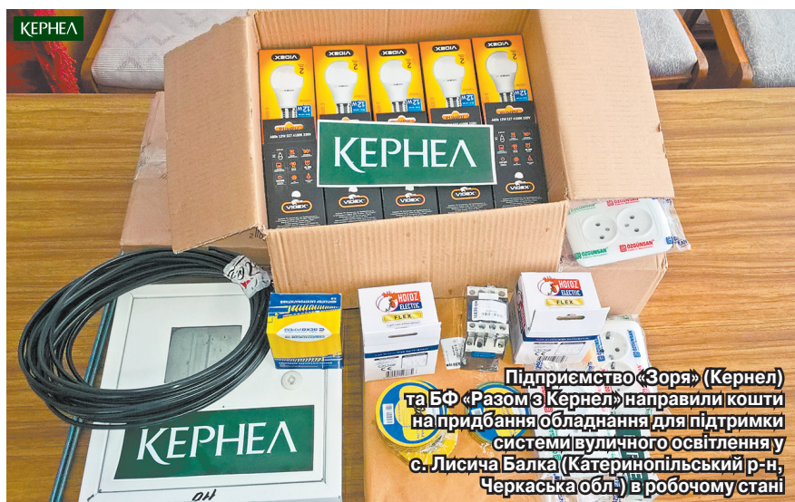
Підприємство «Зоря» (Кернел) та БФ «Разом з Кернел» направили кошти на придбання обладнання для підтримки системи вуличного освітлення у с. Лисича Балка (Катеринопільський р-н, Черкаська обл.) в робочому стані

Чимало українських сіл про вуличне освітлення лише мріють. Адже в багатьох населених пунктах воно відсутнє, а ті, кому все ж пощастило, постійно зіштовхуються з питанням — як утримувати систему в належному стані, уникати поломок та часті заміни обладнання. Громада села Лисича Балка (Катеринопільський р-н, Черкаська обл.) належить до числа щасливчиків.