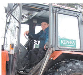
Напередодні Великодніх свят підприємство «Хлібороб» (Кернел) допомогло громаді с. Наливайка (Голованівський р-н, Кіровоградська обл.) у благоустрої територій