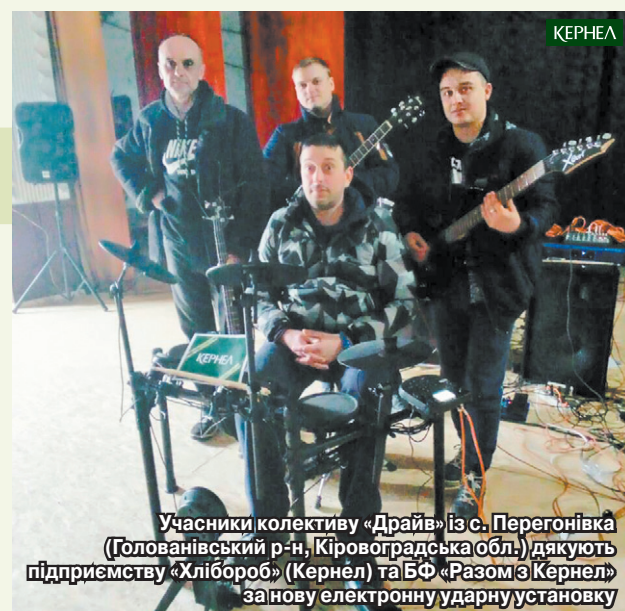
Учасники колективу «Драйв» із с. Перегонівка (Голованівський р-н, Кіровоградська обл.) дякують підприємству «Хлібороб» (Кернел) та БФ «Разом з Кернел» за нову електронну ударну установку

гіоні, має чимало виїзних виступів. Раніше артисти користувалися застарілим обладнанням, що відповідно впливало на якість концертів. Тепер звучання стало значно кращим, а учасники колективу отримали шанс удосконалювати свої вміння й навички на найвищому рівні. Дякуємо кернелівцям за таку ініціативу й за те, що підтримують цей проект. Також вдячні місцевій владі та сільському голові, які завжди з розумінням ставляться до потреб культурної сфери.