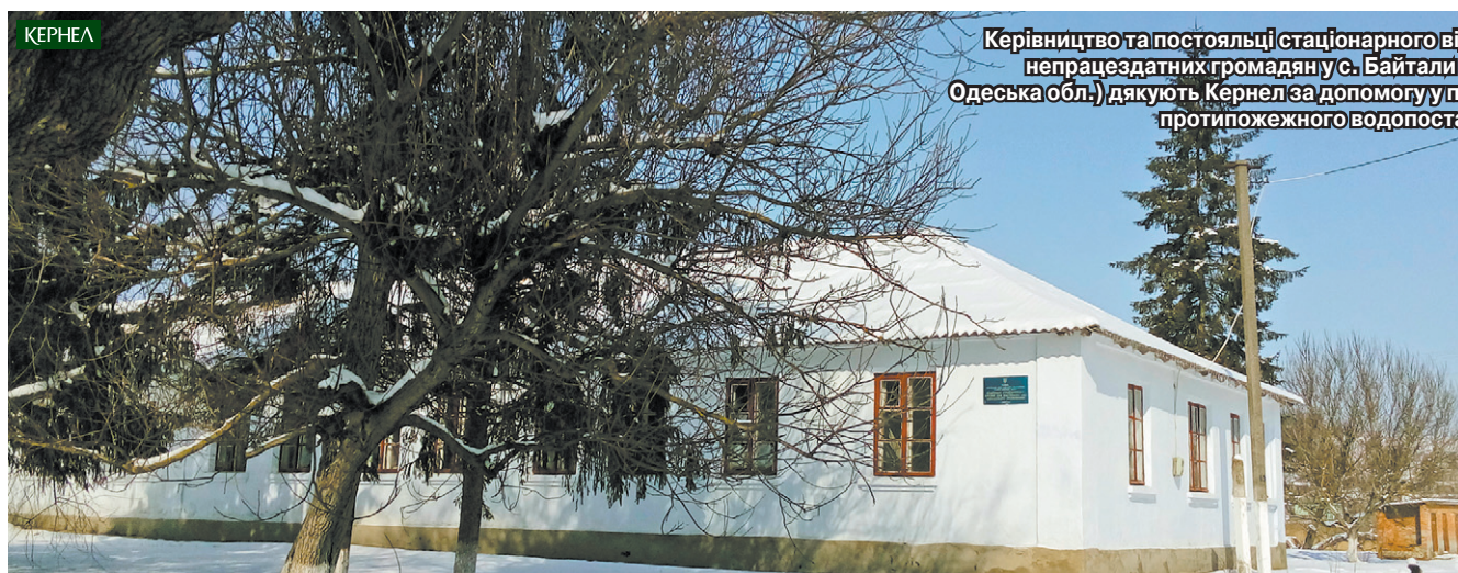
Керівництво та постійальці стаціонарного відділення для самотніх непрацездатних громадян у с. Байтали (Ананівський р-н, Одеська обл.) дякують Кернел за допомогу у придбанні обладнання для протипожежного водопостачання

Уже близько 25 років на території села Байтали (Ананівський р-н, Одеська обл.) діє стаціонарне відділення для самотніх та непрацездатних громадян. Відкривалося воно на базі дільничної лікарні, а після її реорганізації було змушене самостійно шукати джерела фінансування.