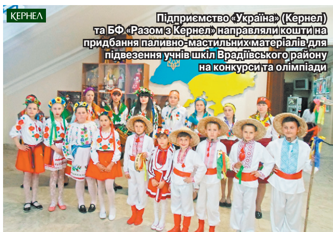
Підприємство «Україна» (Кернел) та БФ «Разом з Кернел» направляли кошти на придбання паливно-мастильних матеріалів для підвезення учнів шкіл Врадівського району на конкурс та олімпіади

сування Компанії 22 учні шкіл району взяли участь у Всеукраїнському конкурсі з захисту науково-дослідницьких робіт учнів — членів Малої академії наук України у м. Миколаєві, з них семеро дітей стали переможцями. Також 11 наших учнів відвідали Всеукраїнські змагання з футболу «Шкільна футзальна ліга України» у м. Первомайську. У квітні-травні планується низка заходів, куди наші дітки зможуть потрапити завдяки коштам, які Кернел виділив на паливно-мастильні матеріали. Дякуємо за увагу до потреб освіти, за порядність, професіоналізм та відповідальність, що дозволили Вам зробити вагомий внесок у справу навчання українських школярів».