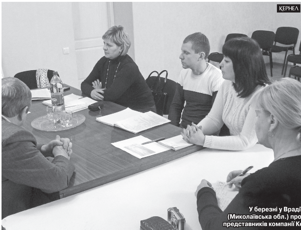
У березні у Врадівській селищній раді (Миколаївська обл.) пройшов круглий стіл за участю представників компанії Кернел та БФ «Разом з Кернел»