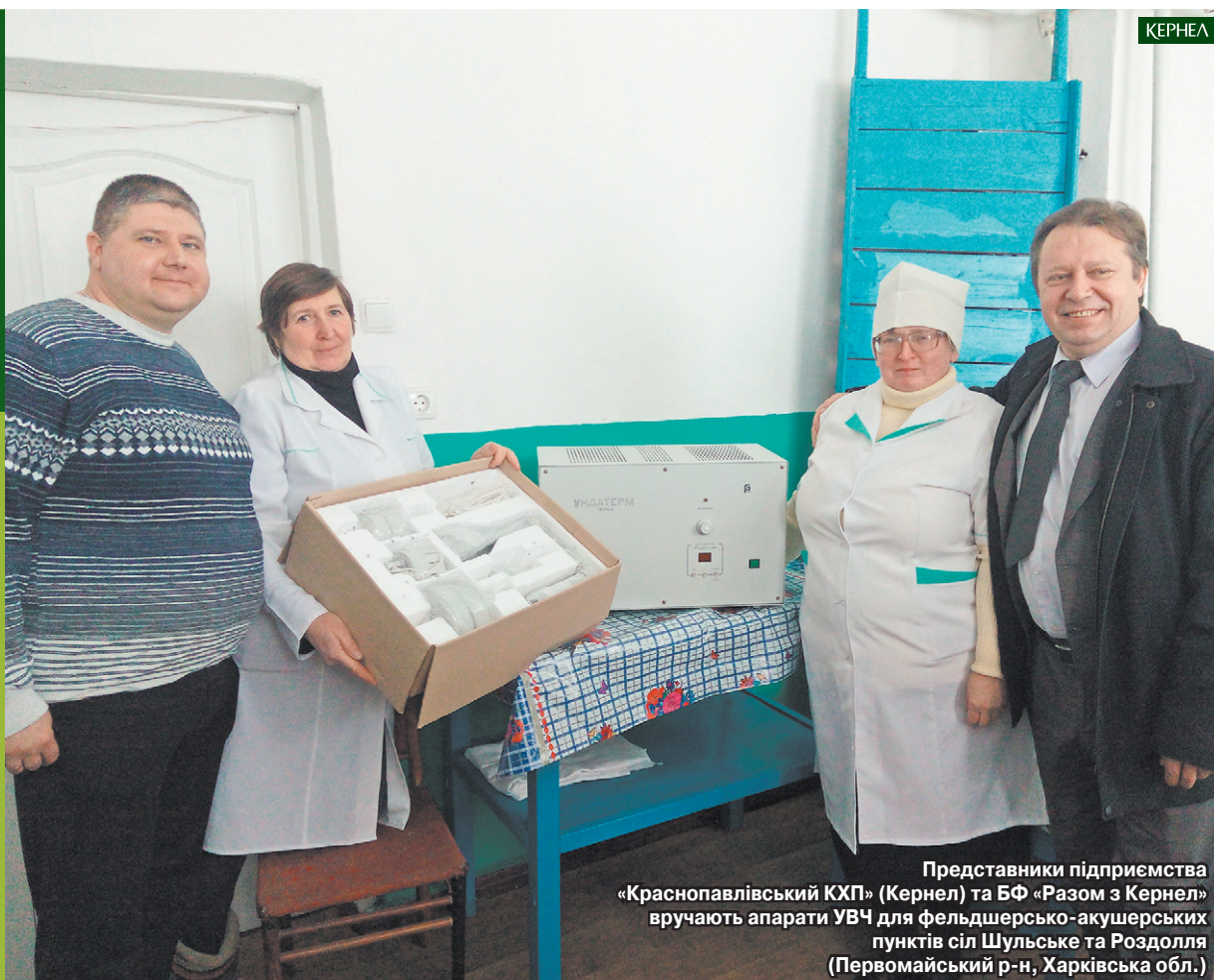
Представники підприємства «Краснопавлівський КХП» (Кернел) та БФ «Разом з Кернел» вручають апарати УВЧ для фельдшерсько-акушерських пунктів сіл Шульське та Роздолля (Первомайський р-н, Харківська обл.)

Медична сфера українських сіл потребує всебічної підтримки. Окрім дефіциту кадрів, тут у більшості випадків залишаються невирішеними питання забезпечення медичним обладнанням, ліками, а також створення комфортних умов для надання якісних послуг пацієнтам. Значну підтримку заклади охорони здоров'я українських сіл одержують від агропідприємств компанії Кернел та БФ «Разом з Кернел». За останні роки кернелівці виділили понад 4 млн грн на вирішення важливих питань сільських медичних закладів.