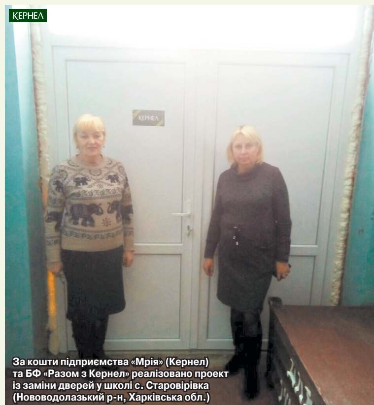
За кошти підприємства «Мрія» (Кернел) та БФ «Разом з Кернел» реалізовано проект із заміни дверей у школі с. Старовірівка (Нововодолазький р-н, Харківська обл.)

Фактично в кожному номері газети ми розповідаємо про проекти, які реалізуються за фінансового сприяння агропідприємств компанії Кернел та Благодійного фонду «Разом з Кернел» з метою покращення умов навчання та виховання дітей у школах підопічних сіл. Сьогодні пропонуємо Вашій увазі чергову порцію добрих справ, зроблених з думкою про наших дітей. Мова піде про встановлення дверей у школі с. Старовірівка (Нововодолазький р-н, Харківська обл.) та про виділення коштів для покращення харчування учнів школи с. Броварки (Глобинський р-н, Полтавська обл.). Подробиці — в коментарях.