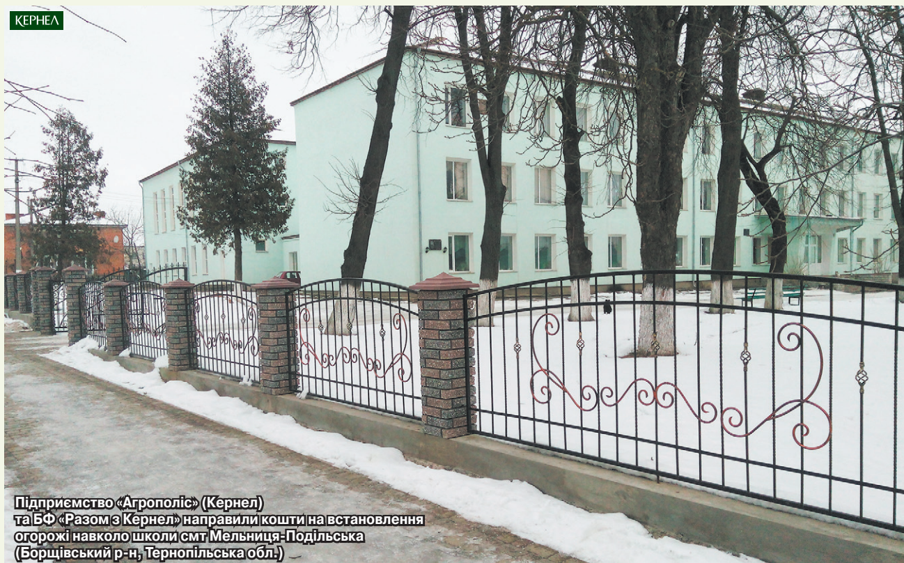
Підприємство «Агрополіс» (Кернел) та БФ «Разом з Кернел» направили кошти на встановлення огорожі навколо школи смт Мельниця-Подільська (Борщівський р-н, Тернопільська обл.)