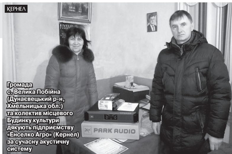
Громада с. Велика Побійна (Дунаєвецький р-н, Хмельницька обл.) та колектив місцевого Будинку культури дякують підприємству «Енселко Агро» (Кернел) за сучасну акустичну систему

Важливо, що підприємство «Енселко Агро» (Кернел) та БФ «Разом з Кернел» надають усебічну підтримку селу Велика Побійна та його жителям. Раніше за співфінансування Компанії було закуплено стільці для місцевої школи, проведено заміну вікон у бібліотеці та приміщенні того ж таки Будинку культури, перекрито дах сільської церкви. Та-