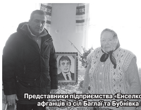
Представники підприємства «Енселко Агро» (Кернел) відвідують родини воїнів-афганців із сіл Баглаї та Бубнів (Волочиський р-н, Хмельницька обл.)

Традиційно напередодні 15 лютого, річниці виведення військ з Афганістану, представники агропідприємств компанії Кернел та Благодійного фонду «Разом з Кернел» у всіх регіонах України відвідують воїнів-афганців та їхніх рідних, беруть участь у заходах із вшанування подвигу цих героїв.