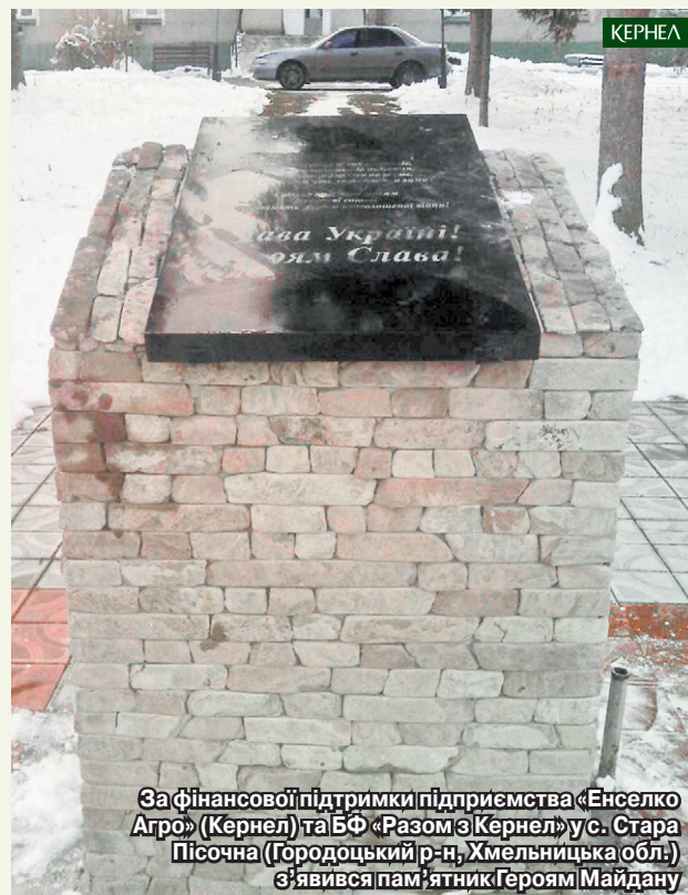
За фінансової підтримки підприємства «Енселко Агро» (Кернел) та БФ «Разом з Кернел» у с. Стара Пісочна (Городоцький р-н, Хмельницька обл.) з'явився пам'ятник Героям Майдану