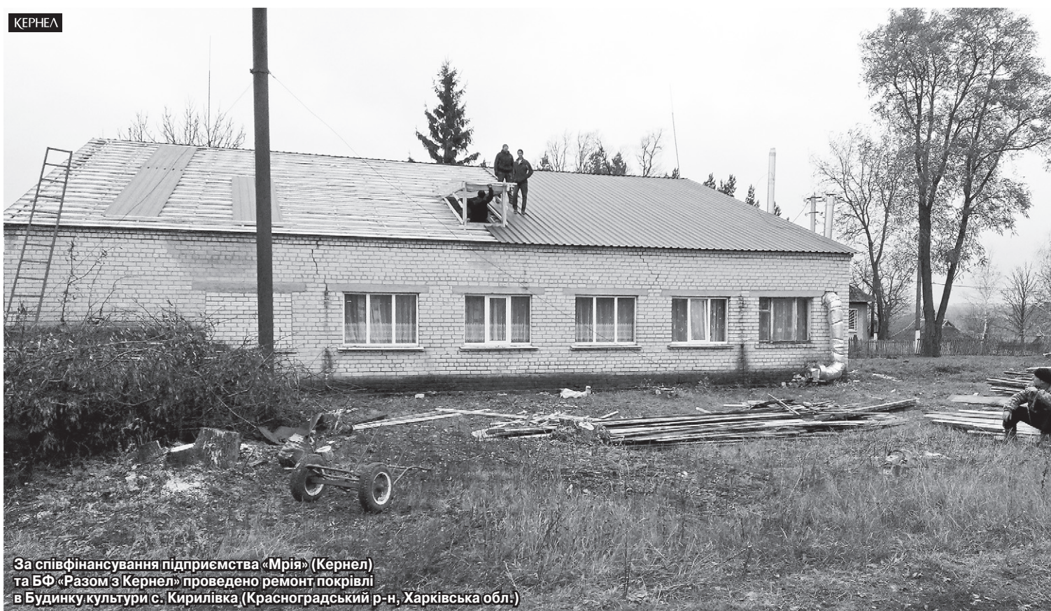
За співфінансування підприємства «Мрія» (Кернел) та БФ «Разом з Кернел» проведено ремонт покрівлі в Будинку культури с. Кирилівка (Красноградський р-н, Харківська обл.)

У 2017 році громада села Кирилівка, що у Красноградському районі Харківщини, взяла участь у міні-проекті «Разом у майбутнє» із проведення капітального ремонту покрівлі місцевого Будинку культури. Справа в тому, що дах установи перебував у край незадовільному стані й вимагав термінової заміни, оскільки шифер, покладений ще в 1972 році, прогнив.