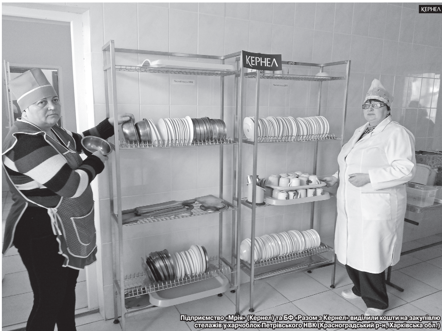
Підприємство «Мрія» (Кернел) та БФ «Разом з Кернел» виділили кошти на закупівлю стелажів у харчоблок Петрівського НВК (Красноградський р-н, Харківська обл.)

Що стосується Харківської області, то тут компанію Кернел представляють підприємства «Мрія» (Кернел), що працює в Лозівському, Сахновщинському, Кегичівському, Нововодолазькому, Красноградському, Валківському районах, «Краснопавлівський КХП» (Кернел), що орендує землі в Лозівському, Первомайському, Сахновщинському та Балаклійському районах, та «Україна» (Кернел), що обробляє паї в Шевченківському районі області. На вказані підопічні території поширюються й соціальні програми Благодійного фонду.