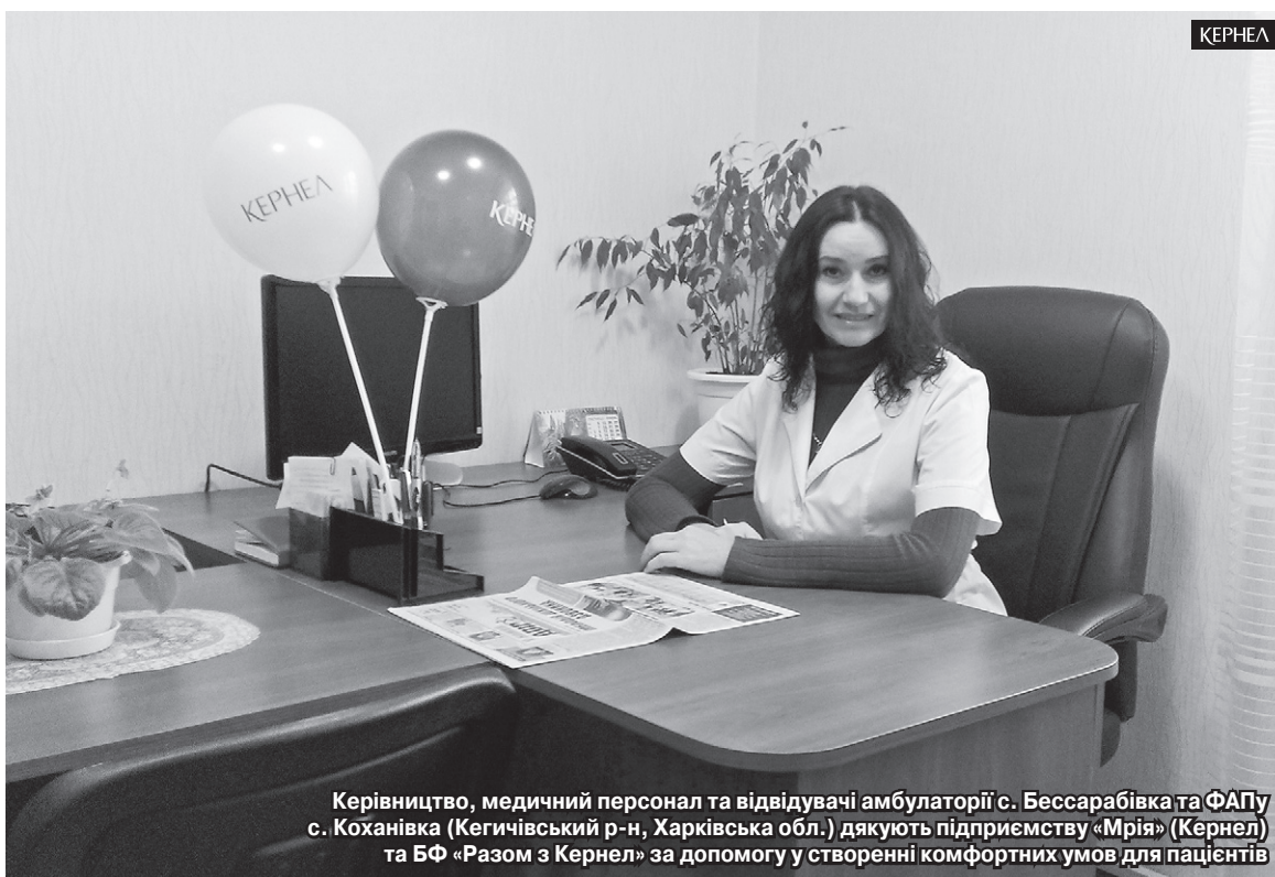
Керівництво, медичний персонал та відвідувачі амбулаторії с. Бессарабівка та ФАПу с. Коханівка (Кегичівський р-н, Харківська обл.) дякують підприємству «Мрія» (Кернел) та БФ «Разом з Кернел» за допомогу у створенні комфортних умов для пацієнтів

Додамо, що підприємство «Мрія» (Кернел) та Благодійний фонд не вперше надають під-