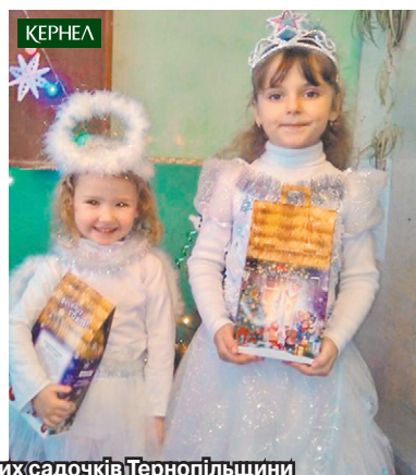
Учні шкіл та вихованці дитячих садочків Тернопільщини дякують підприємству «Агрополіс» (Кернел) та БФ «Разом з Кернел» за подарунки до Нового року