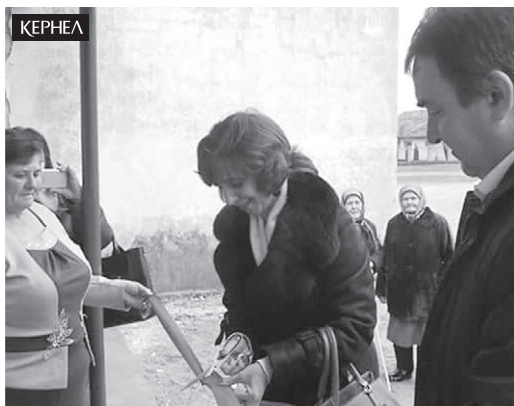
Відкриття оновленого ФАПу в с. Рудківці (Новоушицький р-н, Хмельницька обл.)