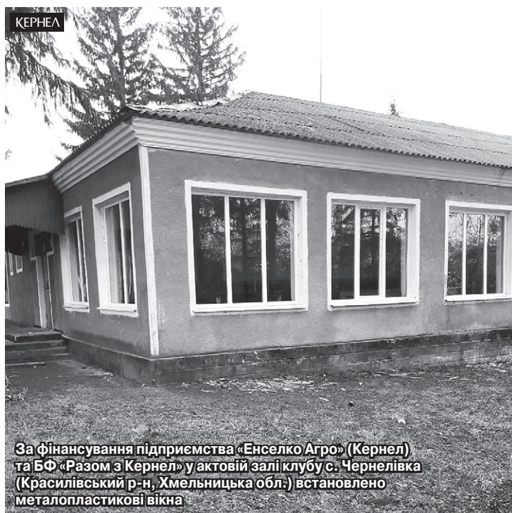
За фінансування підприємства «Енселко Агро» (Кернел) та БФ «Разом з Кернел» у актовій залі клубу с. Чернелівка (Красилівський р-н, Хмельницька обл.) встановлено металопластикові вікна

Сільські заклади культури — це місця, де людина повинна раціонально проводити вільний час, розвивати таланти, культурно відпочивати, отримувати естетичну насолоду. Тож, напевне, кожному приємно завітати до впорядкованого, сучасного культурного осередку. Та, на жаль, не всі вони відповідають запитам відвідувача.