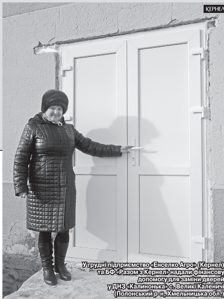
У грудні підприємство «Енселко Агро» (Кернел) та БФ «Разом з Кернел» надали фінансову допомогу для заміни дверей у ДНЗ «Калинонька» с. Великі Каленичі (Полонський р-н, Хмельницька обл.)

«Сьогодні в нашому дошкільному навчальному закладі «Калинонька» виховується 18 дітей. Щороку ми намагаємося створювати для них максимально комфортні умови. У цьому нам допомагає орендар земель — підприємство «Енселко Агро» (Кернел) та БФ «Разом з Кернел». За останні три роки завдяки фінансуванню від Кернел