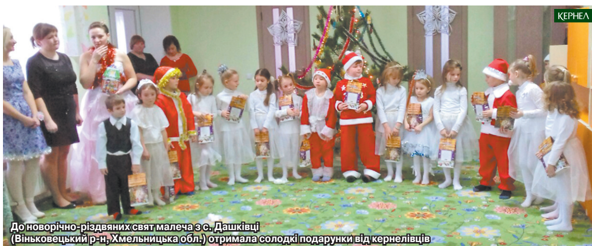
До новорічно-різдвяних свят малеча з с. Дашківці (Вінницький р-н, Хмельницька обл.) отримала солодкі подарунки від кернелівців

Завітали кернелівські Діди Морози й на святкові вогниці у підопічні села Хмельниччини й Тернопільщини, вручивши пакунки з різноманітною смакотю понад 18 тис. тутешніх діток. Дітлахи, у свою чергу, із задоволенням приймали солодощі та дякували Кернел за привітання.