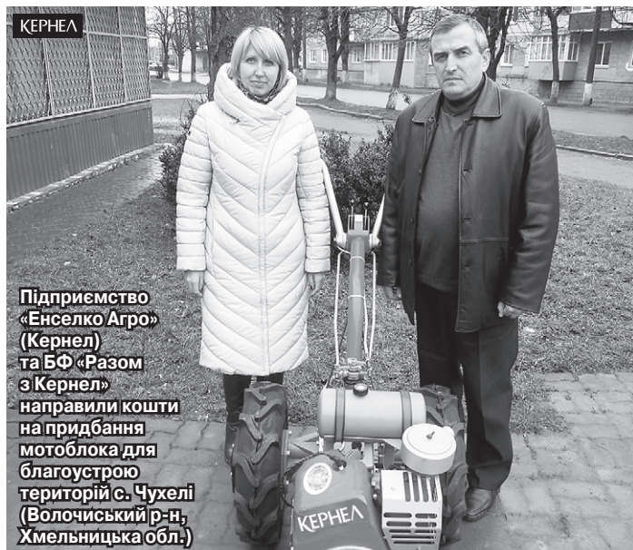
Підприємство «Енселко Агро» (Кернел) та БФ «Разом з Кернел» направили кошти на придбання мотоблока для благоустрою території с. Чухелі (Волочиський р-н, Хмельницька обл.)