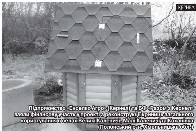
Підприємство «Енселко Агро» (Кернел) та БФ «Разом з Кернел» взяли фінансову участь у проекті з реконструкції криниць загального користування в селах Великі Каленичі, Малі Каленичі та Коханівка (Полонський р-н, Хмельницька обл.)