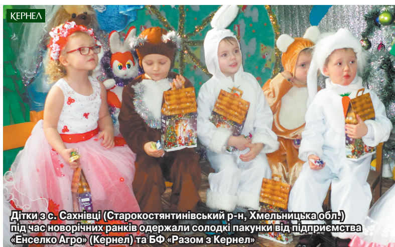
Дітки з с. Сахнівці (Старокостянтинівський р-н, Хмельницька обл.) під час новорічних ранків одержали солодкі пакунки від підприємства «Енселко Агро» (Кернел) та БФ «Разом з Кернел»

Взимку такі довгі ночі й такі короткі дні, але час у передсвятковій метушні летить дуже швидко. На одному подиху промайнули новорічно-різдвяні свята. Малеча з українських сіл відзначила їх спільно з представниками агропідприємств компанії Кернел та Благодійного фонду «Разом з Кернел». Понад 44 тис. учнів сільських шкіл та вихованців дитячих садочків з Черкаської, Кіровоградської, Одеської, Миколаївської, Вінницької, Хмельницької, Тернопільської, Чернігівської, Сумської, Полтавської, Харківської областей отримали солодкі подарунки від Кернел.