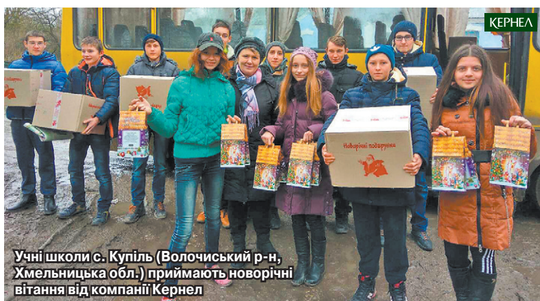
Учні школи с. Купіль (Волоцький р-н, Хмельницька обл.) приймають новорічні вітання від компанії Кернел