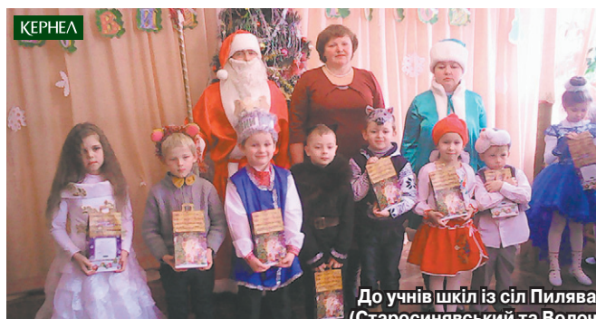
До учнів шкіл із сіл Пилява та Бубнівка (Старосинявський та Волоцький р-ни, Хмельницька обл.) завітали кернелівські Діди Морози з солодощами