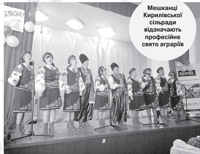
Мешканці Кирилівської сільради відзначають професійне свято аграріїв