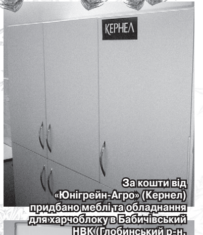
За кошти від «Юнігрейн-Агро» (Кернел) придбано меблі та обладнання для харчоблоку в Бабичівському НВК (Глобінський р-н, Полтавська обл.)