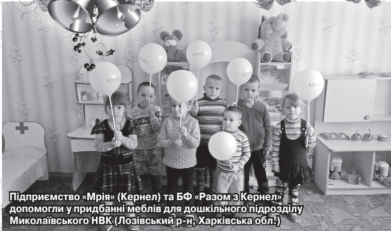
Підприємство «Мрія» (Кернел) та БФ «Разом з Кернел» допомогли у придбанні меблів для дошкільного підрозділу Миколаївського НВК (Лозівський р-н, Харківська обл.)