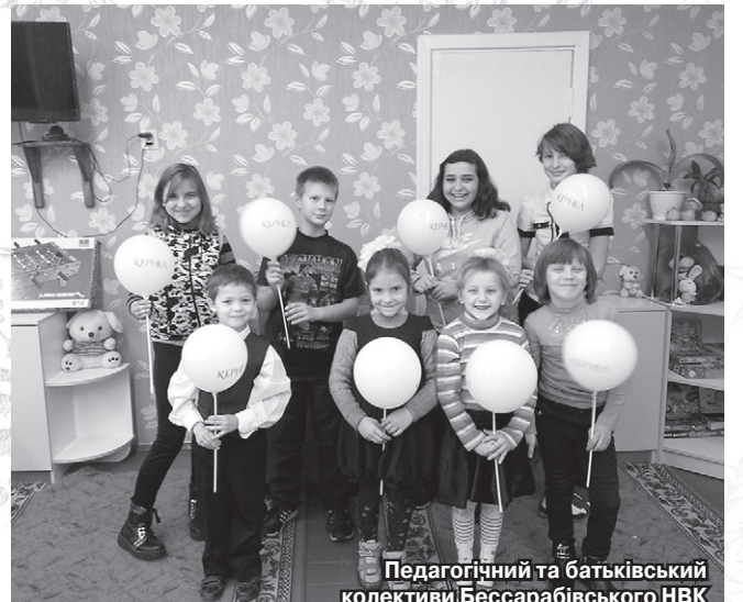
Педагогічний та батьківський колективи Бессарабівського НВК (Кегичівський р-н, Харківська обл.) дякують Кернел за спортивний інвентар та медикаменти першої необхідності

«Підприємство «Юнігрейн-Агро» (Кернел) та БФ «Разом з Кернел» є для нашого закладу надійними помічниками та спонсорами. Щороку Компанія направляє фінанси на вирішення важливих питань. Це придбання комп'ютерної техніки, встановлення вікон у школі, допомога у поточних ремонтах, зокрема у спорудженні внутрішньої вбиральні, тощо. Нещодавно за кошти від Кернел ми придбали меблі — стільці та шафи для вихованців дошкільного підрозділу, а також обладнання для харчоблоку — холодильник та витяжку. Також ми з нетерпінням чекаємо у гості кернелівських Дідів Морозів, які традиційно напередодні новорічних свят презентують наші малечі солодощі. Дякуємо Кернел за підтримку та увагу, за те, що турбуються про комфортні умови навчання та виховання дітей — майбутнього України».