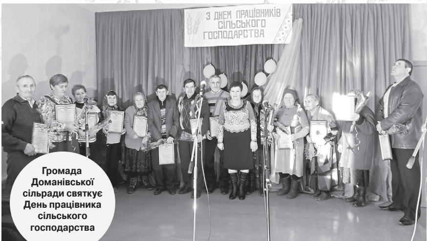
Громада Доманівської сільради святкує День працівника сільського господарства