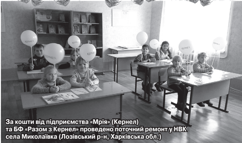
За кошти від підприємства «Мрія» (Кернел) та БФ «Разом з Кернел» проведено поточний ремонт у НВК села Миколаївка (Лозівський р-н, Харківська обл.)