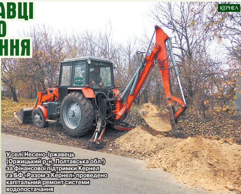
У селі Несено-Іржавець (Оржицький р-н, Полтавська обл.) за фінансової підтримки Кернел та БФ «Разом з Кернел» проведено капітальний ремонт системи водопостачання

Рік, що минає, для громади Вишневої сільради (Оржицький р-н, Полтавська обл.), до складу якої входить і село Несено-Іржавець, запам'ятається реалізацією соціальних проектів, які проходили за фінансової підтримки підприємства «Вишневе-Агро» (Кернел) та БФ «Разом з Кернел».