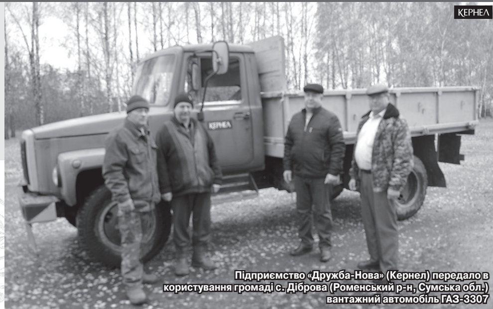
Підприємство «Дружба-Нова» (Кернел) передало в користування громаді с. Діброва (Роменський р-н, Сумська обл.) вантажний автомобіль ГАЗ-3307

Крім того, «Дружба-Нова» (Кернел) допомагає громаді в розчистці снігових заметів у зимовий період та в упорядкуванні дорожнього покриття. Наприклад, торік Кернел спрямував