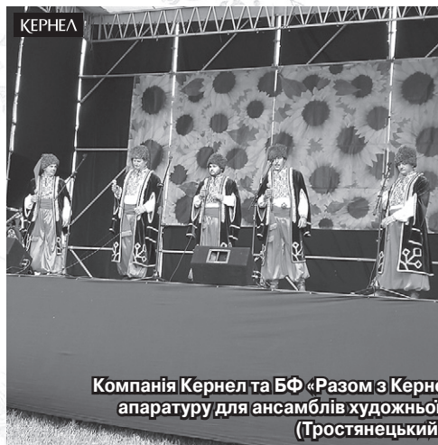
Компанія Кернел та БФ «Разом з Кернел» допомогли придбати сучасну музичну апаратуру для ансамблів художньої самодіяльності Буймерської сільради (Тростянецький р-н, Сумська обл.)

З повагою, колектив «Ряшківські нащадки» (с. Ряшки, Прилуцький р-н, Чернігівська обл.)