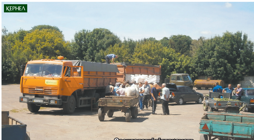
Орендодавці підприємств «Енселко Агро» (Кернел) та «Агрополіс» (Кернел) дякують за вчасну та комфортну виплату орендної плати

Традиційно використовується індивідуальний підхід. Розрахунок проводиться коштами або продукцією — залежно до бажання пайовиків і тих договірних відносин, що прописані в укладених угодах. Так, виплата орендної плати коштами вже склала майже 174 млн грн, у натуральному вигляді (продукцією) розрахунок проведено на суму 114 млн 500 тис. грн, виплата ОП авансом становить 16 млн 500 тис. грн.