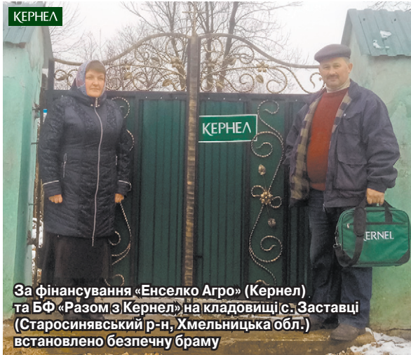
За фінансування «Енселко Агро» (Кернел) та БФ «Разом з Кернел» на кладовищі с. Заставці (Старосинявський р-н, Хмельницька обл.) встановлено безпечну браму

ги не залишається й благоустрій. За фінансової участі «Енселко Агро» (Кернел) та Благодійного фонду проходять ремонти дорожнього покриття в селах. А в найближчій перспективі — встановити за кошти Компанії зупинки автобусного транспорту в селах Іванківці, Красносілка, Щербані, Заставці (цей проєкт знаходиться на етапі реалізації). Дякуємо Кернел за те, що тримають руку на пульсі наших потреб.