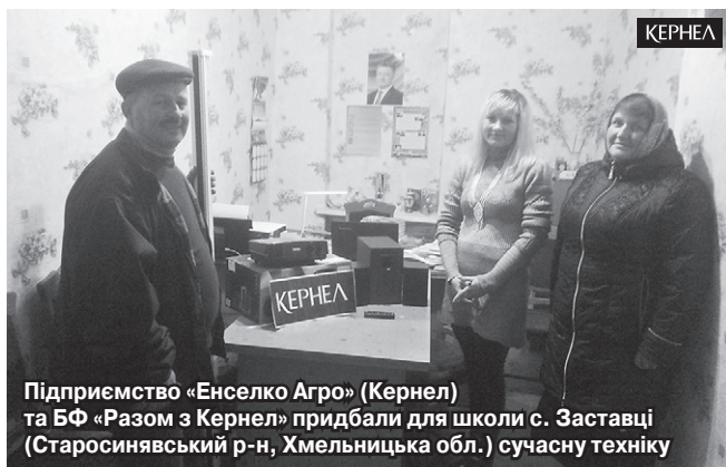
Підприємство «Енселко Агро» (Кернел) та БФ «Разом з Кернел» придбали для школи с. Заставці (Старосинявський р-н, Хмельницька обл.) сучасну техніку

«Раніше ми часто зіштовхувалися з проблемами з доступом до інтернет-мережі, зокрема з постійними перебоями та низькою швидкістю сигналу. Не так давно у нашому районі розпочав працювати новий провайдер, послуги якого були більш високої якості. Проте й вартість підключення була вища, а на спеціальні пристрої потрібні були кошти. Підприємство «Енселко Агро» (Кернел) та БФ «Разом з Кернел» виділили необхідне фінансування, завдяки чому ми повністю оплатили всі послуги, у тому числі річний абонемент на користування Інтернетом. У результаті 75 наших учнів отримали повноцінний доступ до