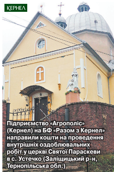
Підприємство «Агрополіс» (Кернел) на БФ «Разом з Кернел» направили кошти на проведення внутрішніх оздоблювальних робіт у церкві Святої Параскеви в с. Устечко (Заліщицький р-н, Тернопільська обл.)