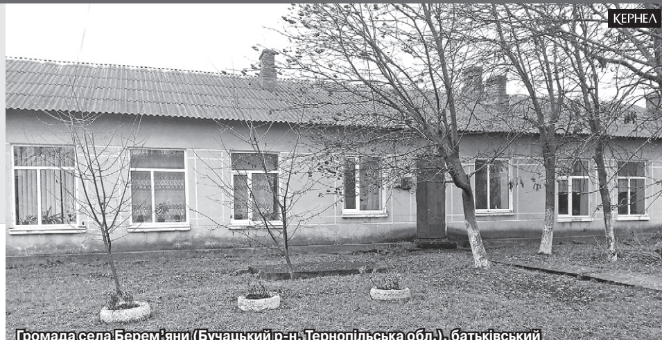
Громада села Берем'яни (Буцацький р-н, Тернопільська обл.), батьківський і педагогічний колективи садочка і початкової школи дякують підприємству «Агрополіс» (Кернел) та БФ «Разом з Кернел» за фінансування капітального ремонту

ектор. Придбали їх для нас підприємство «Енселко Агро» (Кернел) та БФ «Разом з Кернел». Ці пристрої є надзвичайно важливими для школи, адже сприяють покращенню навчально-виховного процесу. Наприклад, тепер під час занять ми можемо показувати дітям відеосюжети, презентації тощо. Оскільки обладнання доволі дороге, то власним коштом закупити його ми не могли. А коли була гостра потреба у його використанні, позичали в інших закладах. Тепер завдяки Кернел школа має власні новітні пристрої. Дякуємо кернелівцям за те, що допомогли зробити крок до сучасних технологій».