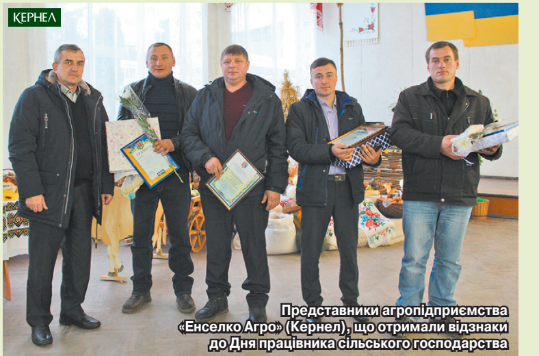
Представники агропідприємства «Енселко Агро» (Кернел), що отримали відзнаки до Дня працівника сільського господарства