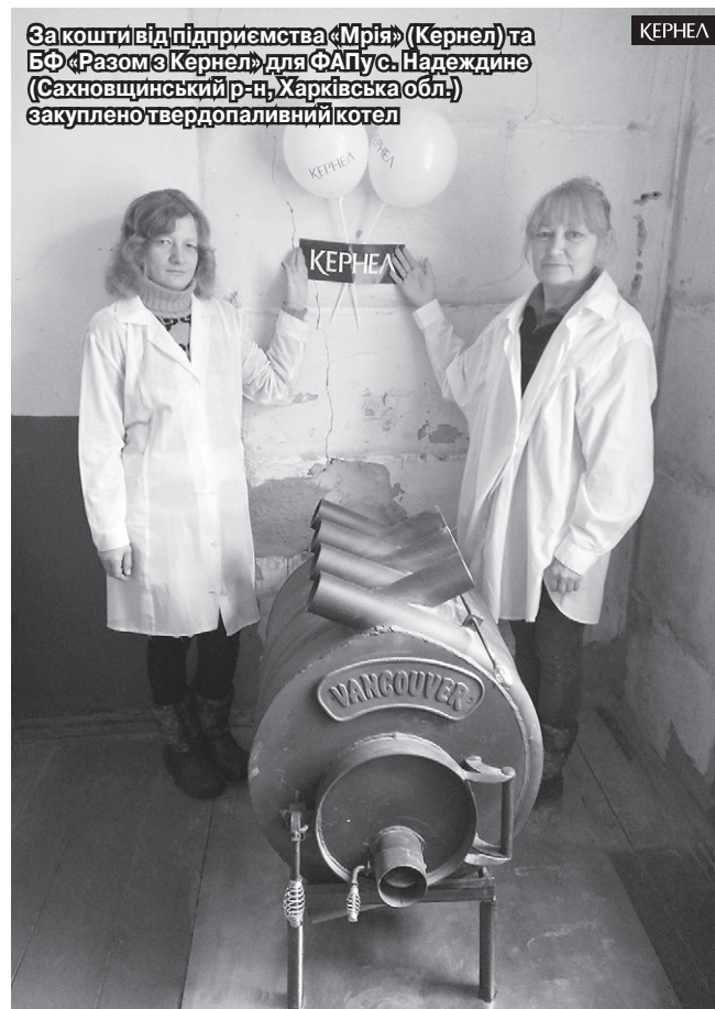
За кошти від підприємства «Мрія» (Кернел) та БФ «Разом з Кернел» для ФАП с. Надеждине (Сахновщинський р-н, Харківська обл.) закуплено твердопаливний котел

«У даному приміщенні наша амбулаторія діє з 1986 року. Раніше тут був сільський клуб. Безперечно, за роки роботи ми намагалися створювати комфортні умови для перебування пацієнтів. Адже під опікою закладу перебуває понад 3 тис. осіб із понад десяти сіл регіону. Кожен із них звертається до нас зі своїми проблемами, і дуже важливо, щоб пацієнт почувався у нас затишно. Нещодавно завдяки фінансовій підтримці під-