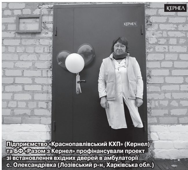
Підприємство «Краснопавлівський КХП» (Кернел) та БФ «Разом з Кернел» профінансували проект зі встановлення входних дверей в амбулаторії с. Олександрівка (Лозівський р-н, Харківська обл.)

«Наш ФАП обслуговує населення двох сіл, а це близько 150 осіб. Будівлі закладу — понад 50 років. Останнім часом особливо гостро поставало питання обігріву приміщення. Адже обладнання, що було встановлене колись, рік тому вишло з ладу та не підлягало ремонту. На наше звернення надати підтримку для вирішення ситуації (придбання нового твердопаливного котла) відгукнулися представники підпри-