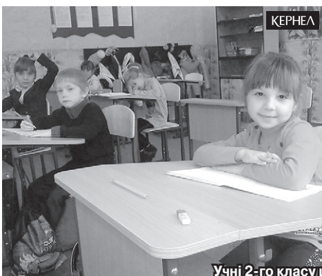
Учні 2-го класу школи села Савинці (Оржицький р-н, Полтавська обл.) вдячні Кернел за придбання меблів