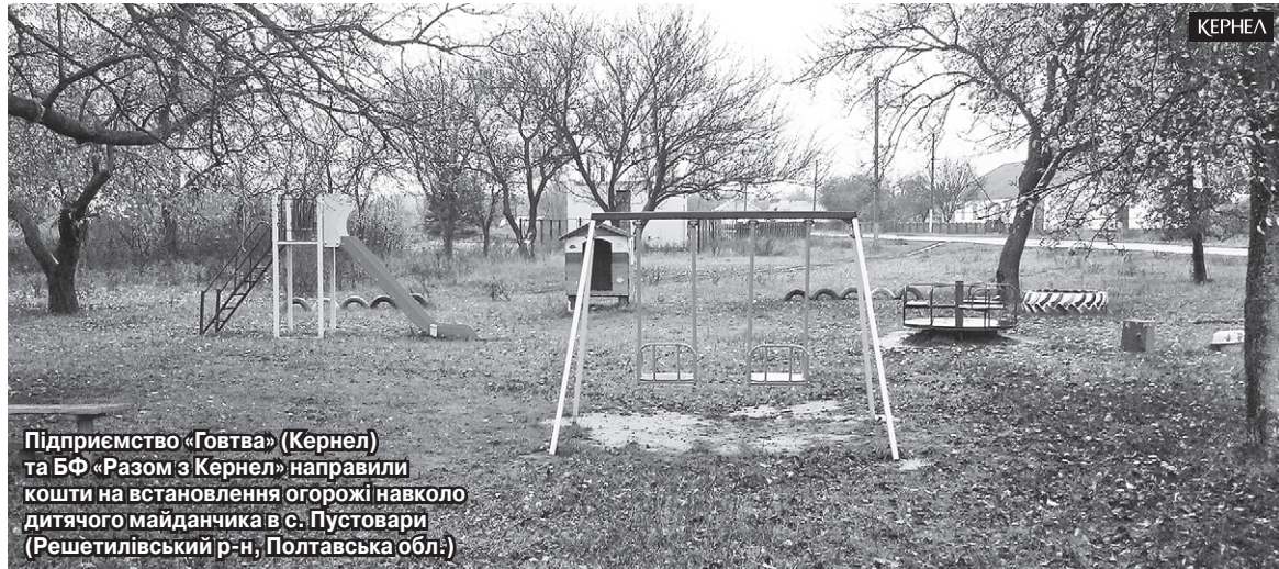
Підприємство «Говтва» (Кернел) та БФ «Разом з Кернел» направили кошти на встановлення огорожі навколо дитячого майданчика в с. Пустовари (Решетилівський р-н, Полтавська обл.)

приємства «Краснопавлівський КХП» (Кернел) та БФ «Разом з Кернел» ми встановили нові входні двері. Це, безперечно, покращило теплозбереження у приміщенні медичної установи та забезпечило більш комфортні умови. Дуже вдячні Компанії за допомогу».