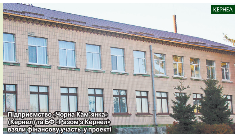
Підприємство «Чорна Кам'янка» (Кернел) та БФ «Разом з Кернел» взяли фінансову участь у проєкті з капітального ремонту покрівлі школи с. Вікторівка (Маньківський р-н, Черкаська обл.)

Оскільки проєкт не дешевий (загальний бюджет становить