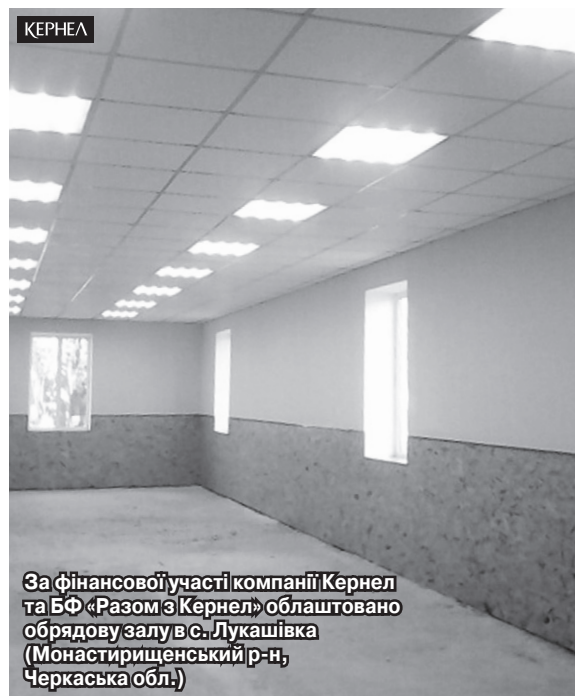
За фінансової участі компанії Кернел та БФ «Разом з Кернел» облаштовано обрядову залу в с. Лукашівка (Монастирищенський р-н, Черкаська обл.)