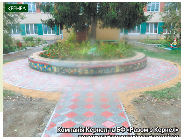
Компанія Кернел та БФ «Разом з Кернел» допомогли впорядкувати подвір'я ДНЗ «Барвінок» у селі Мошурів (Тальнівський р-н, Черкаська обл.)