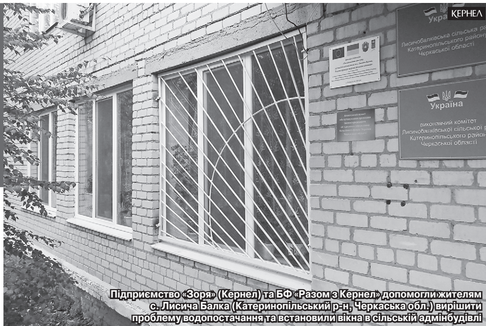
Підприємство «Зоря» (Кернел) та БФ «Разом з Кернел» допомогли жителям с. Лисича Балка (Катеринопільський р-н, Черкаська обл.) вирішити проблему водопостачання та встановили вікна в сільській адмінбудівлі

Для підприємства «Зоря» (Кернел), що орендує землі в Катеринопільському районі Черкащини, як і для інших агропідприємств компанії Кернел, окрім якісної виробничої діяльності, пріоритетними є підтримка інфраструктури та благоустрою населених пунктів. Спільно з Благодійним фондом «Разом з Кернел» тут реалізуються корисні для жителів соціальні проекти.