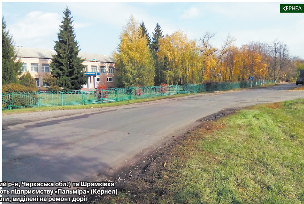
Жителі сіл Вознесенське (Золотоніський р-н, Черкаська обл.) та Шрамківка (Драбівський р-н, Черкаська обл.) дякують підприємству «Пальміра» (Кернел) та БФ «Разом з Кернел» за кошти, виділені на ремонт доріг