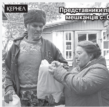
Представники підприємства «Чорна Кам'янка» (Кернел) вітають мешканців с. Старі Бабани (Уманський р-н, Черкаська обл.) з Днем людей похилого віку