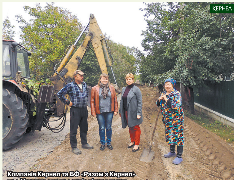
Компанія Кернел та БФ «Разом з Кернел» профінансували проект із відновлення водопостачання в с. Любисток (Катеринопільський р-н, Черкаська обл.)

За статистикою, кількість населених пунктів, які користуються централізованим водопостачанням, за останні роки значно скоротилася — сьогодні таких лише 26%. А все тому, що сільські водогони, переважно побудовані на гроші колишніх колгоспів і радгоспів, після передачі на баланс місцевих органів влади не отримували достатнього фінансування. Сільські ради, не маючи потрібних коштів на утримання цих об'єктів, були змушені відмовлятися від користування ними. Тому більшість водогонів вийшла з ладу, а подекуди їх розібрали і здали на металобрухт. Зношення тих, що залишилися, оцінюється в 70%. Тому водопостачання відбувається з перебоями (по годинах, або з кількадежними чи кількатижневими перервами), та й вода не завжди відповідає санітарним нормам.