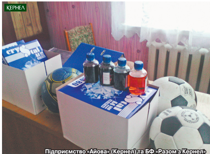
Підприємство «Айова» (Кернел) та БФ «Разом з Кернел» допомогли у придбанні спортивного інвентарю та канцтоварів для школи с. Тальянки (Тальнівський р-н, Черкаська обл.)