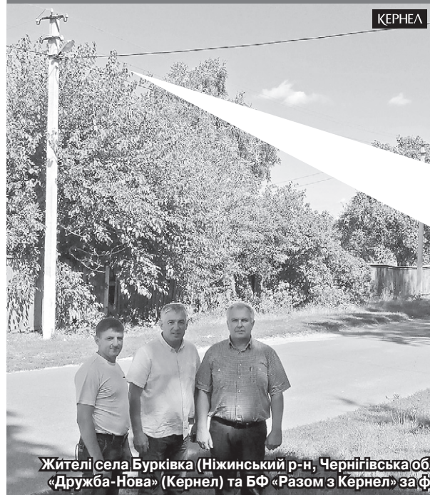
Жителі села Бурківка (Ніжинський р-н, Чернігівська обл.) та представники місцевої влади дякують підприємству «Дружба-Нова» (Кернел) та БФ «Разом з Кернел» за фінансування проекту з реконструкції вуличного освітлення

Наша безпека та спокій часто залежать від освітлення вулиць, площ, тротуарів. На жаль, у багатьох селах Чернігівщини «темний» період ще не скінчився — освітлення, яке проводили за радянських часів, відпрацювало своє, лампи перегоріли. Проте є й такі села, де проблему освітлення вирішують покроково. До їхнього переліку віднедавна можна віднести й село Бурківка (Ніжинський р-н, Чернігівська обл.). Тут завдяки співпраці з підприємством «Дружба-Нова» (Кернел) та БФ «Разом з Кернел» засвітилися ліхтарі. Кернел спрямував на цю справу майже 55 тис. грн.