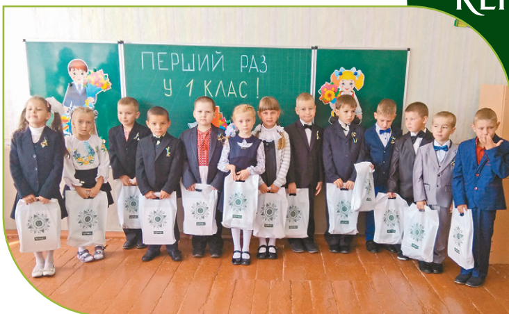
Першокласники з сіл Чернігівщини, Сумщини та Полтавщини дякують підприємству «Дружба-Нова» (Кернел) та БФ «Разом з Кернел» за подарунки до Дня знань