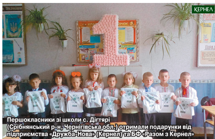
Першокласники зі школи с. Дігтярі (Срібнянський р-н, Чернігівська обл.) отримали подарунки від підприємства «Дружба-Нова» (Кернел) та БФ «Разом з Кернел»