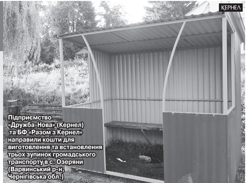
Підприємство «Дружба-Нова» (Кернел) та БФ «Разом з Кернел» направили кошти для виготовлення та встановлення трьох зупинок громадського транспорту в с. Озеряни (Варвинський р-н, Чернігівська обл.)

— Від себе особисто та від громади хочу подякувати підприємству «Дружба-Нова» (Кернел) та БФ «Разом з Кернел» за вагомую допомогу. Крім того, хочу зазначити, що кернелівські аграрії надають всебічну допомогу соціальній сфері наших сіл. У 2017 році Компанія інвестувала в покращення рівня інфраструктури та благоустрою близько 200 тис. грн, — веде далі очільник села. — Так, цього року надавалися кошти на відновлення водонапірної башти, завдяки