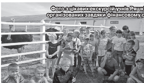
Фото з цікавих екскурсій учнів Ряшківської ЗОШ (Прилуцький р-н Чернігівська обл.), організованих завдяки фінансовому сприянню компанії Кернел та БФ «Разом з Кернел»