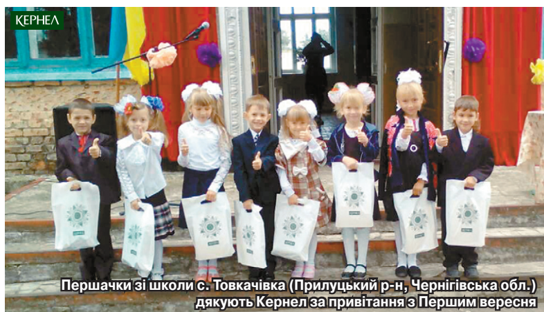
Першачки зі школи с. Товкачівка (Прилуцький р-н, Чернігівська обл.) дякують Кернел за привітання з Першим вересня

Традиційно в навчальних закладах Чернігівщини, Сумщини та Полтавщини День знань відзначали спільно з представниками підприємства «Дружба-Нова» (Кернел) та Благодійного фонду «Разом з Кернел». Уже декілька років поспіль до свята кернелівці презентують подарунки першокласникам. Цьогоріч 574 першачки із 54 шкіл регіону одержали від Компанії набори канцелярського приладдя. Загальний бюджет витрат склав 53 тис. грн.