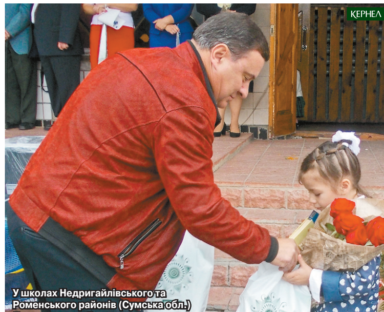
У школах Недригайлівського та Роменського районів (Сумська обл.) День знань пройшов за участю представників «Дружба-Нова» (Кернел) та БФ «Разом з Кернел»