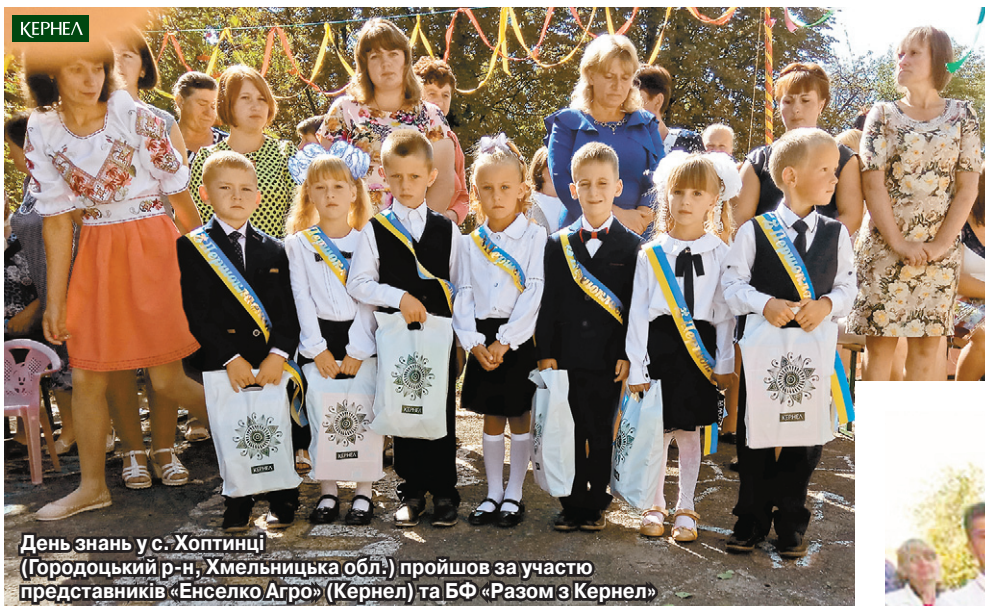
День знань у с. Хоптинці (Городоцький р-н, Хмельницька обл.) пройшов за участю представників «Енселко Агро» (Кернел) та БФ «Разом з Кернел»