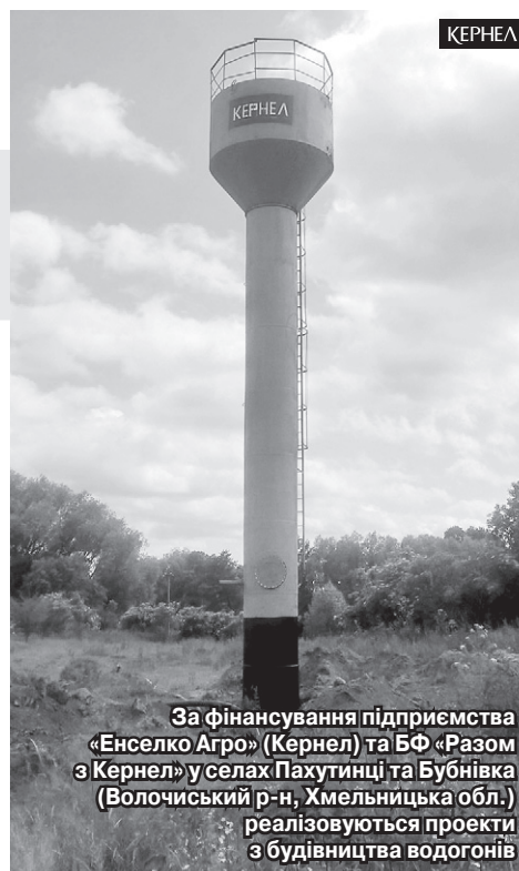
За фінансування підприємства «Енселко Агро» (Кернел) та БФ «Разом з Кернел» у селах Пахутинці та Бубнівка (Волочиський р-н, Хмельницька обл.) реалізуються проекти з будівництва водогонів