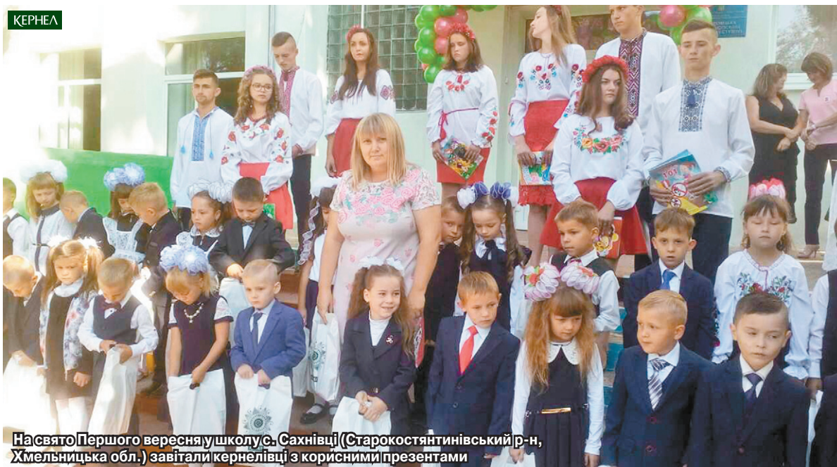
На свято Першого вересня у школу с. Сахнівці (Старокостянтинівський р-н, Хмельницька обл.) завітали кернелівці з корисними презентами