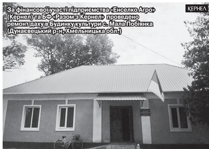
За фінансової участі підприємства «Енселко Агро» (Кернел) та БФ «Разом з Кернел» проведено ремонт даху в Будинку культури с. Мала Побіянка (Дунаєвецький р-н, Хмельницька обл.)

У Хмельницькій області Компанію представляє підприємство «Енселко Агро», що обробляє землі в Кам'янець-Подільському, Вінницькому, Городоцькому, Дунаєвецькому, Новоушицькому, Чемеровецькому, Ярмолинецькому, Красилівському, Старокостянтинівському, Старосинявському, Волочиському, Полонському, Славутському районах області. На Тернопільщині інтереси Компанії представляє підприємство «Агрополіс», що орендує земельні наділи в Чортківському, Борщівському, Заліщицькому, Бучацькому районах. На вказані підопічні території поширюються й соціальні програми Благодійного фонду.