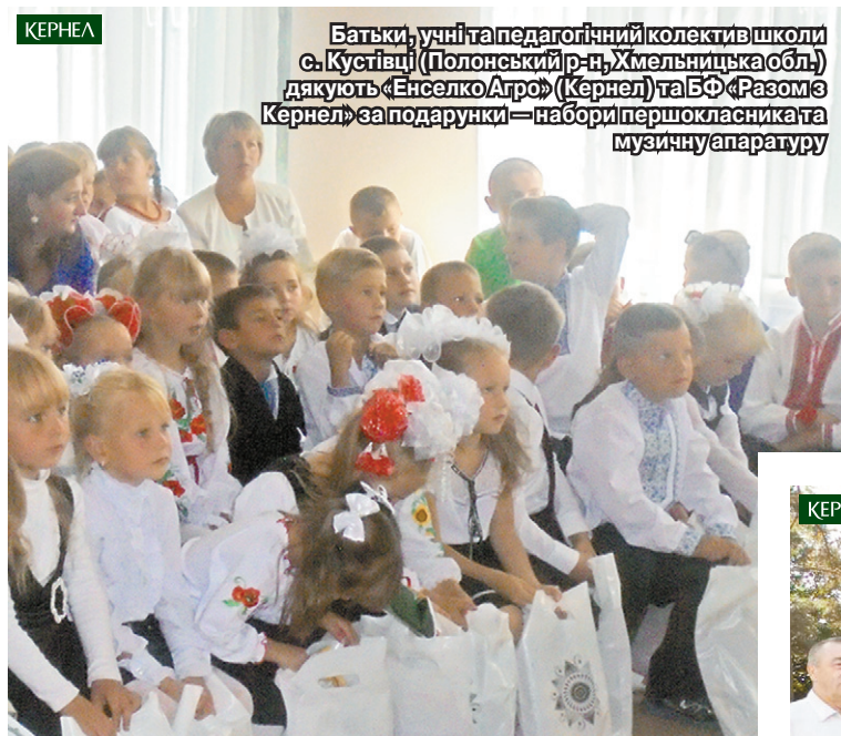
Батьки, учні та педагогічний колектив школи с. Кустівці (Полонський р-н, Хмельницька обл.) дякують «Енселко Агро» (Кернел) та БФ «Разом з Кернел» за подарунки — набори першокласника та музичну апаратуру

«Якби мене та інших батьків першокласників попередили, що підприємство «Енселко Агро» (Кернел) та БФ «Разом з Кернел» вручатиме нашим діткам такі чудові, а головне — практичні набори, то ми, напевно, не тратилися б на ці речі з сімейного бюджету. Дуже сподобалися всі складові набору — яскраві альбоми, пенали, олівці тощо. Тепер маємо запас на наступний навчальний рік. І дякуємо аграріям за турботу про наших дітей».