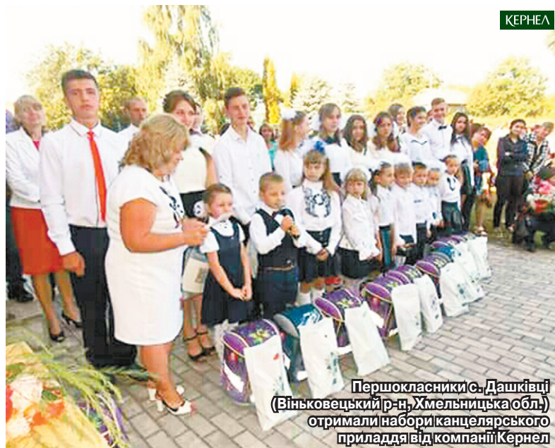
Першокласники с. Дашківці (Вінковецький р-н, Хмельницька обл.) отримали набори канцелярського приладдя від компанії Кернел