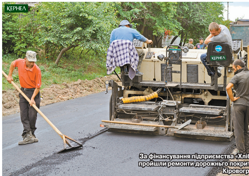
За фінансування підприємства «Хлібороб» (Кернел) та БФ «Разом з Кернел» пройшли ремонті дорожнього покриття у с. Перегонівка (Голованівський р-н, Кіровоградська обл.)