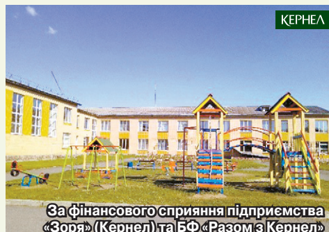
За фінансового сприяння підприємства «Зоря» (Кернел) та БФ «Разом з Кернел» встановлено ігровий майданчик у с. Петраківка (Катеринопільський р-н, Черкаська обл.)

Сільська влада та громада с. Петраківка дякують підприємству «Зоря» (Кернел) та БФ «Разом з Кернел» за турботу про підростаюче покоління, за створення комфортної зони дозвілля для малечі.