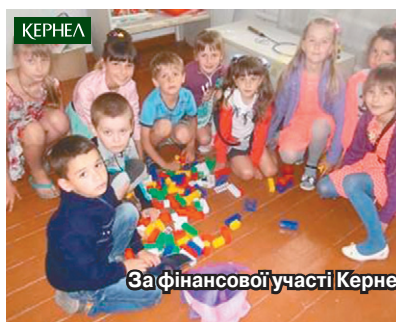
За фінансової участі Кернел організовано роботу літнього табору при школі села Мала Перещепина (Новосанжарський р-н, Полтавська обл.)