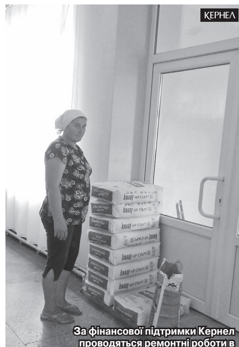
За фінансової підтримки Кернел проводяться ремонтні роботи в Біляївському НВК (Первомайський р-н, Харківська обл.)