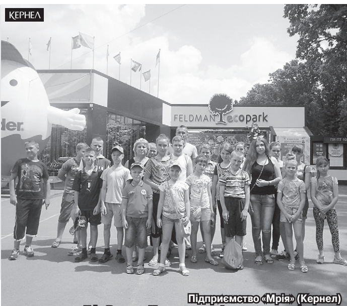
Підприємство «Мрія» (Кернел) та БФ «Разом з Кернел» організували для учнів школи с. Шевченкове (Сахновщинський р-н, Харківська обл.) екскурсію до «Фельдман-Екопарку»