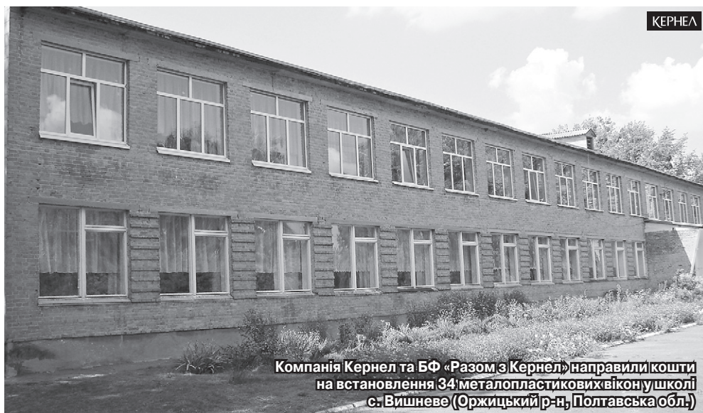
Компанія Кернел та БФ «Разом з Кернел» направили кошти на встановлення 34 металопластикових вікон у школі с. Вишневе (Оржицький р-н, Полтавська обл.)