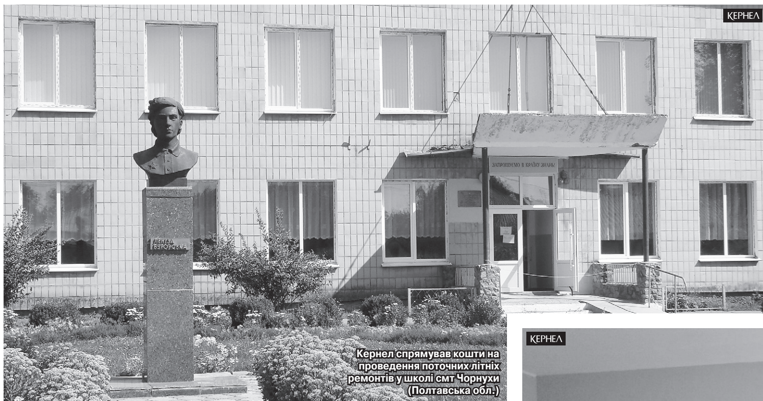
Кернел спрямував кошти на проведення поточних літніх ремонтів у школі смт Чорнухи (Полтавська обл.)