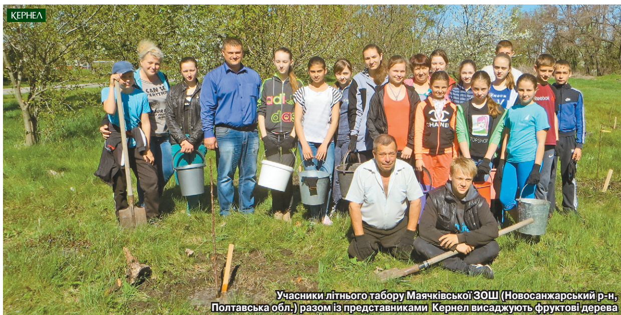
Учасники літнього табору Маяківської ЗОШ (Новосанжарський р-н, Полтавська обл.) разом із представниками Кернел висаджують фруктові дерева