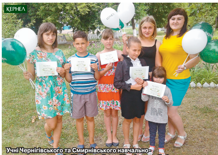
Учні Чернігівського та Смирнівського навчально-виховних комплексів (Лозівський р-н, Харківська обл.) дякують компанії Кернел та БФ «Разом з Кернел» за якісний відпочинок