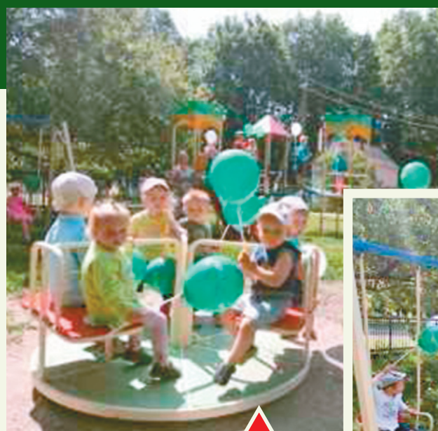
Біля дитячого садочка с. Шевченкове (Сахновщинський р-н, Харківська обл.) за фінансової підтримки Кернел з'явився ігровий майданчик

«Протягом двох тижнів при нашій школі діяв літній табір для учнів. Тут школярі мали можливість якісно та цікаво відпочити. У програму дозвілля входили розваги, ігри, спортивні змагання й цікаві екскурсії. Табір відвідали 30 учнів 1-5-го класів. Фінансово до організації відпочинку долучилася місцева влада (кошти бюджету), батьки та спонсори, серед яких підприємство-орендар «Аршиця» (Кернел) та Благодійний фонд «Разом з Кернел». Кошти від Компанії було направлено на покращення харчування таборян. Додам, що це не перший досвід співпраці з Кернел. Останні декілька років аграрії фінансували встановлення вікон, направляли кошти на харчування учнів протягом навчального періоду, надавали транспорт для підвезення дітей, а також допомогли придбати 38 саджанців фруктових дерев, які було висаджено поблизу школи».