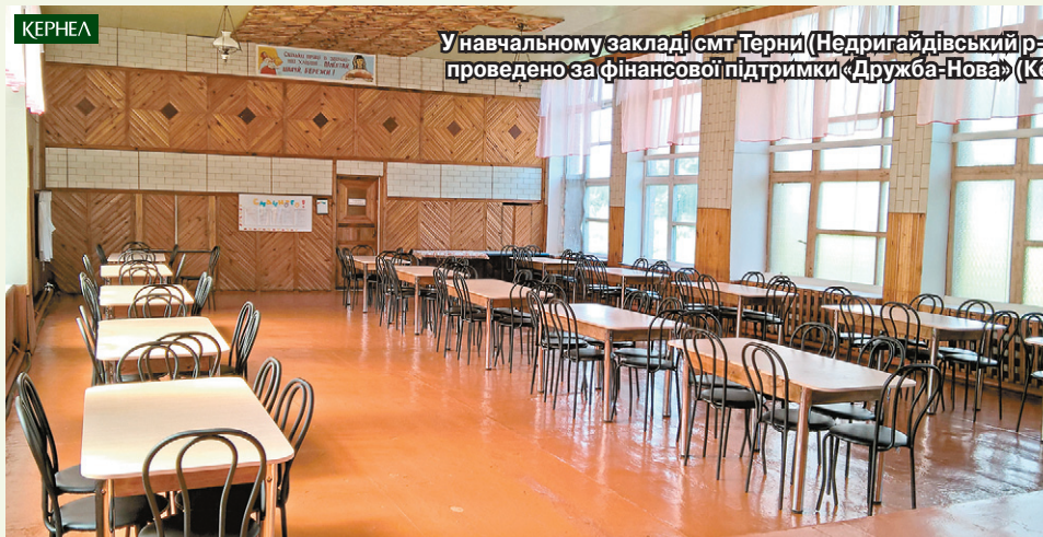
У навчальному закладі смт Терни (Недригайлівський р-н, Сумська обл.) літні ремонти проведено за фінансової підтримки «Дружба-Нова» (Кернел) та БФ «Разом з Кернел»