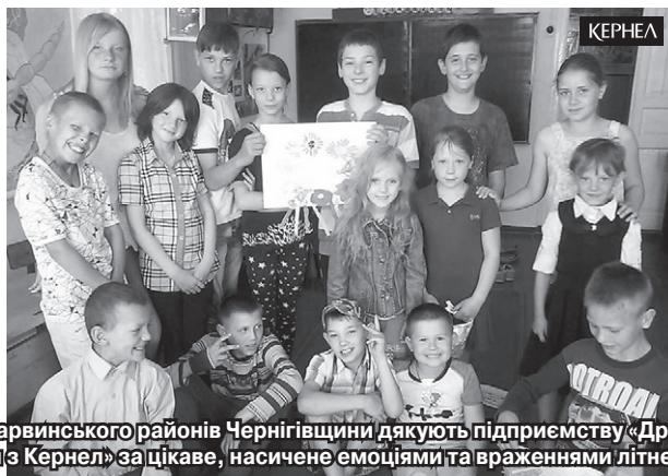
Дітки з Ніжинського та Варвинського районів Чернігівщини дякують підприємству «Дружба-Нова» (Кернел) та БФ «Разом з Кернел» за цікаве, насичене емоціями та враженнями літнє дозвілля