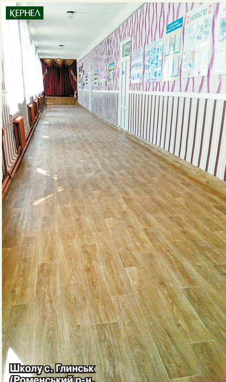
Школу с. Глинськ (Роменський р-н, Сумська обл.) до нового навчального року підготовлено за фінансової участі Кернел

«Останніх три роки поточні літні ремонти у нашій школі проходять за фінансування підприємства «Дружба-Нова» (Кернел) та субвенцій з місцевого бюджету. Таким чином, батьків ми повністю звільнили від фінансового навантаження. Щира подяка кернелівцям за те, що піклуються про освітню сферу села. Сподіваємося, що в найближчому майбутньому Компанія спрямує кошти на ще один, не менш важливий проект — заміну котла у школі. Щоб у стінах закладу було тепло й комфортно в будь-яку пору року».