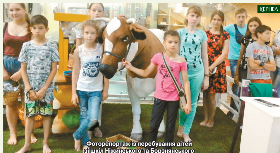
Фоторепортаж із перебування дітей зі шкіл Ніжинського та Борзнянського районів Чернігівщини — учасників конкурсу — у парку професій «Кідландія»

У кінці червня учні шкіл Ніжинського та Борзнянського районів Чернігівщини, учасники конкурсу «Агробізнес майбутнього з Кернел», вирушили в незвичайну подорож до Києва. Діти побували в парку професій «Кідландія». Відвідали визначні місця столиці та милувалися Дніпром.