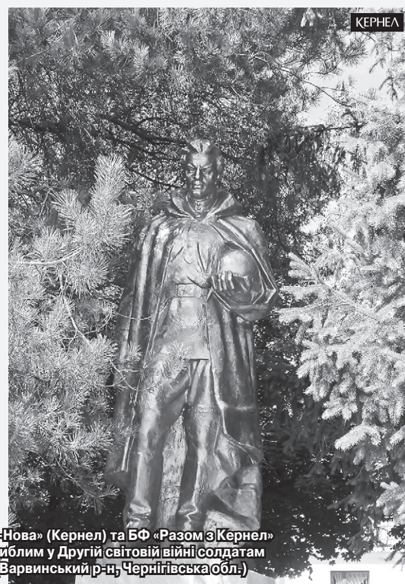
За фінансування підприємства «Дружба-Нова» (Кернел) та БФ «Разом з Кернел» пройшла реконструкція пам'ятника загиблим у Другій світовій війні солдатам на території Богданівської сільради (Варвинський р-н, Чернігівська обл.)