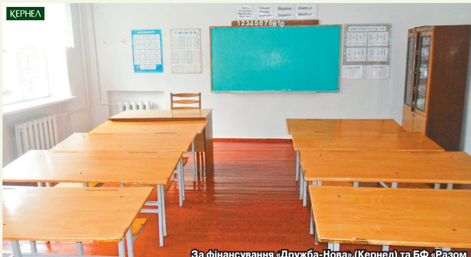
За фінансування «Дружба-Нова» (Кернел) та БФ «Разом з Кернел» поточні ремонти пройшли у школі с. Галайбіне (Борзнянський р-н, Чернігівська обл.)