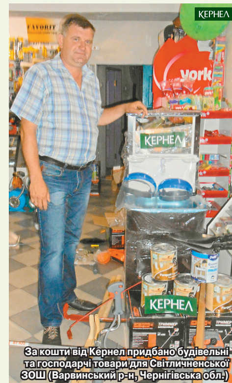
За кошти від Кернел придбано будівельні та господарчі товари для Світличненської ЗОШ (Варвинський р-н, Чернігівська обл.)