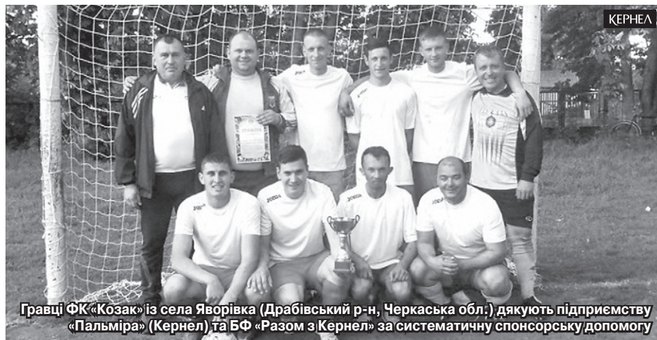
Гравці ФК «Козак» із села Яворівка (Драбівський р-н, Черкаська обл.) дякують підприємству «Пальміра» (Кернел) та БФ «Разом з Кернел» за систематичну спонсорську допомогу

— Дякую кожному учаснику команди за ініціативність і прагнення розвивати та популяризувати спорт у селі, — підсумовує очільник села. — Зичу нових перемог та побільше забитих голів у ворота суперників. Підприємству «Пальміра» (Кернел) та Благодійному фонду вдячний за підтримку футбольної команди й за те, що завжди стоять на варті потреб і проблем нашої громади.