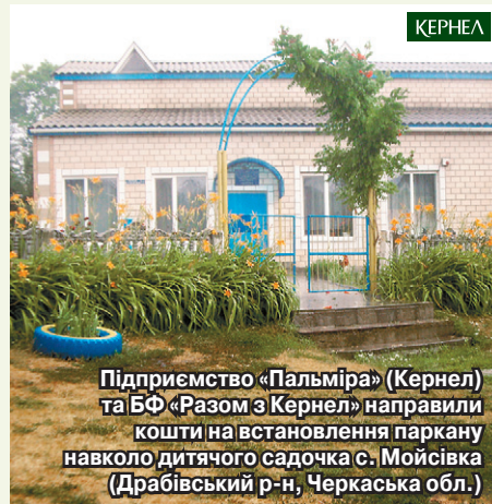
Підприємство «Пальміра» (Кернел) та БФ «Разом з Кернел» направили кошти на встановлення паркану навколо дитячого садочка с. Мойсівка (Драбівський р-н, Черкаська обл.)

«Традиційно підприємство «Агросервіс» (Кернел) та БФ «Разом з Кернел» виділяють кошти для функціонування пришкільного літнього табору. Цьогоріч за фінанси від аграріїв ми придбали спортивний інвентар — м'ячі та настільні ігри, оскільки програма відпочинку була насиченою саме спортивними змаганнями та турнірами. Оздоровитися протягом двох тижнів червня змогли 37 діток — учні початкової школи, діти учасників АТО та пільговий контингент. Щиро дякую всім учасникам процесу організації роботи пришкільного табору, зокрема й Кернел — за те, що ми вкотре змогли забезпечити нашій малечі достойне, цікаве та корисне дозвілля».