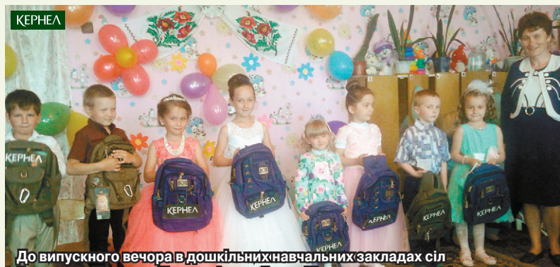
До випускного вечора в дошкільних навчальних закладах сіл Грузьке та Клинове (Голованівський р-н, Кіровоградська обл.) підприємство «Хлібороб» (Кернел) та БФ «Разом з Кернел» презентували майбутнім першокласникам портфелі

«Сімом випускникам нашого ДНЗ підприємство «Хлібороб» (Кернел) та БФ «Разом з Кернел» презентували портфелі. Кернелівці вручили їх дітям на святі прощання з дитячим садочком. Малеча та батьки задоволені такими потрібними подарунками. Додам, що Компанія традиційно не забуває вітати наших діток із новорічними святами, допомагає у благоустрої — за кошти від Кернел торік на території закладу ми облаштували пісочницю. Забезпечили аграрії й підвезення піску. А декілька років тому виділили значне фінансування для проведення капітального ремонту приміщення».