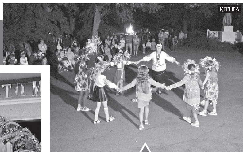
За фінансової підтримки компанії Кернел та БФ «Разом з Кернел» свято Івана Купала організовано в підопічних селах Кіровоградщини та Черкащини

— Приємно, що до організації свята долучилося чимало спонсо-