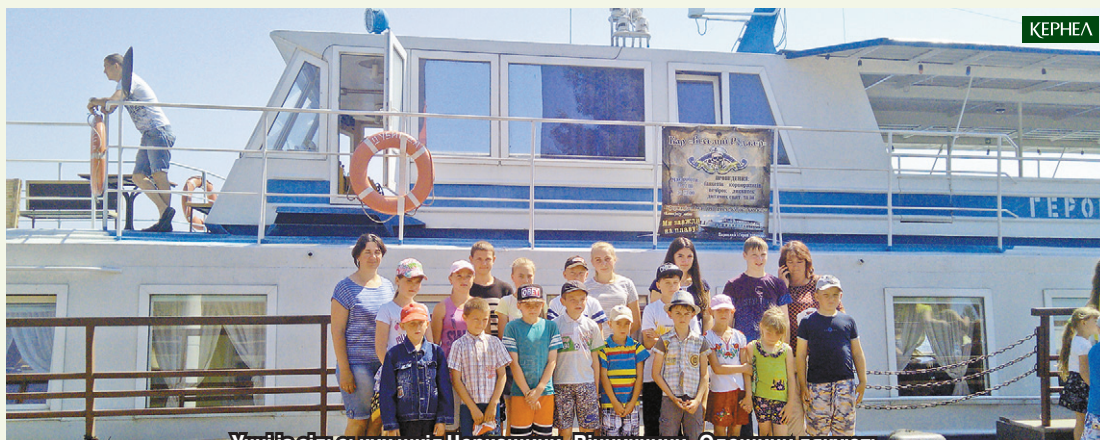
Учні із сільських шкіл Черкащини, Вінниччини, Одещини дякують компанії Кернел та БФ «Разом з Кернел» за цікавий літній відпочинок

Громада села Мойсівка, колектив вихователів та батьки вихованців ДНЗ «Яблушка» дякують підприємству «Пальміра» (Кернел) та Благодійному фонду за те, що турбуються про сільську малечу.