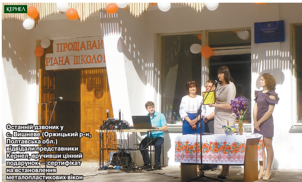
Останній дзвоник у с. Вишневе (Оржицький р-н, Полтавська обл.) відвідали представники Кернел, вручивши цінний подарунок — сертифікат на встановлення металопластикових вікон