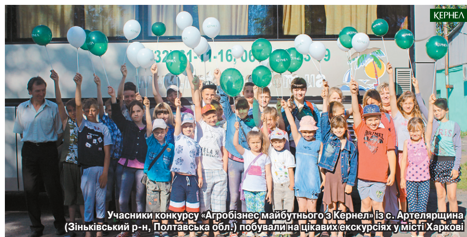
Учасники конкурсу «Агробізнес майбутнього з Кернел» із с. Артелярщина (Зіньківський р-н, Полтавська обл.) побували на цікавих екскурсіях у місті Харкові