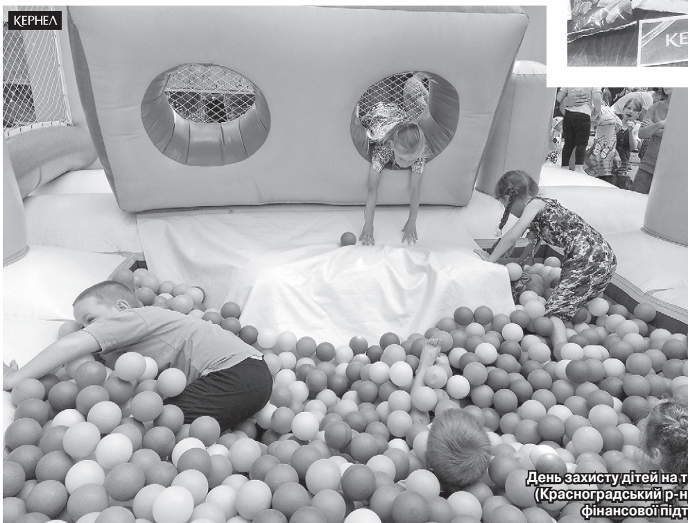
День захисту дітей на території Кирилівської сільради (Красноградський р-н, Харківська обл.) пройшов за фінансової підтримки компанії Кернел