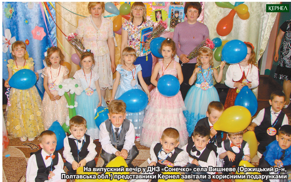
На випускний вечір у ДНЗ «Сонечко» села Вишневе (Оржицький р-н, Полтавська обл.) представники Кернел завітали з корисними подарунками