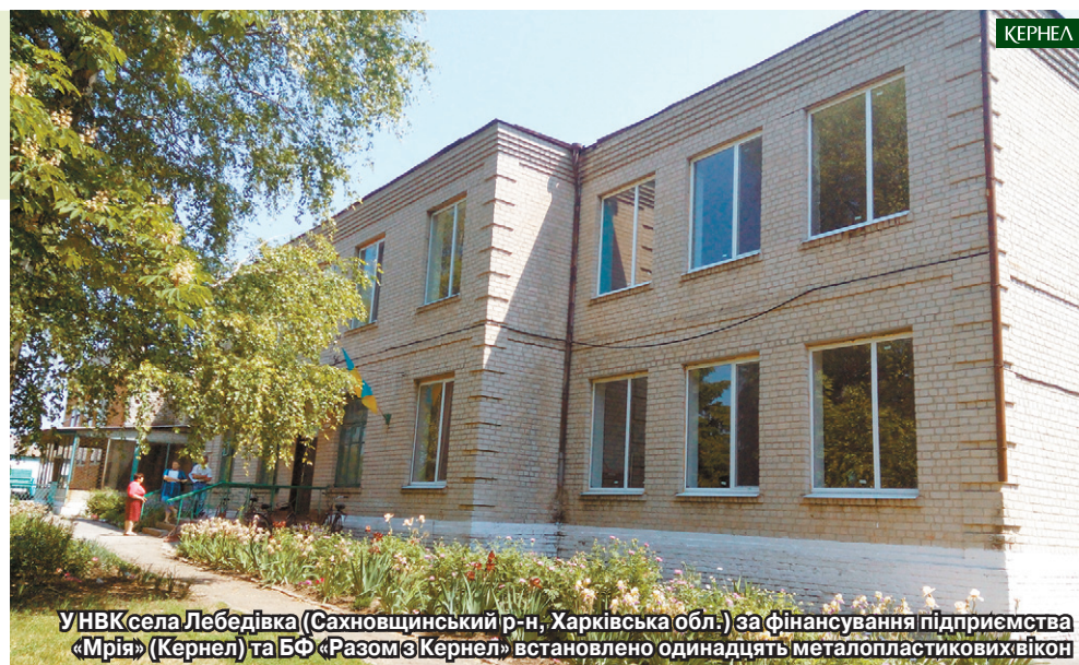
У НВК села Лебедівка (Сахновщинський р-н, Харківська обл.) за фінансування підприємства «Мрія» (Кернел) та БФ «Разом з Кернел» встановлено одинадцять металопластикових вікон