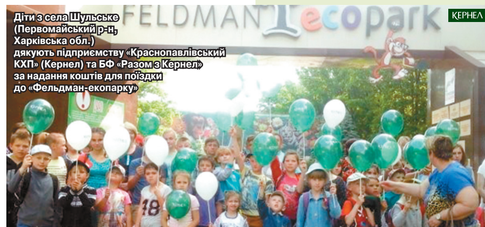
Діти з села Шульське (Первомайський р-н, Харківська обл.) дякують підприємству «Краснопавлівський КХП» (Кернел) та БФ «Разом з Кернел» за надання коштів для поїздки до «Фельдман-екопарку»

У весняний період підприємство «Краснопавлівський КХП» (Кернел) та БФ «Разом з Кернел» реалізували ще один не менш важливий проект для освітньої сфери Шульське. У приміщенні НВК були встановлені металопластикові вікна (в кабінетах інформатики, іноземної та української мови), а також вхідні двері. Крім того, у дитячому садочку за фінансового сприяння Компанії також замінено 10 вікон.