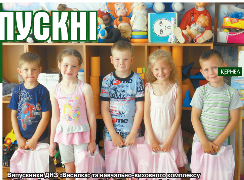
Випускники ДНЗ «Веселка» та навчально-виховного комплексу с. Максимівка (Кременчуцький р-н, Полтавська обл.) дякують «Юнігрейн-Агро» (Кернел) та БФ «Разом з Кернел» за привітання

«Цьогоріч наш дошкільний навчальний заклад «Сонечко» закінчило 19 дітей. І всі вони отримали з нагоди цієї події корисні подарунки — набори канцелярського приладдя від підприємства «Вишневе-Агро» (Кернел) та БФ «Разом з Кернел». До речі, це щорічна ініціатива кернелівців.