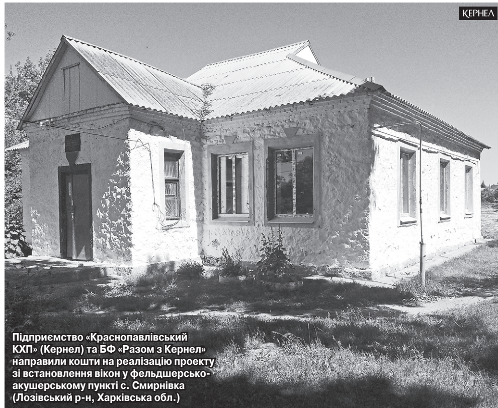
Підприємство «Краснопавлівський КХП» (Кернел) та БФ «Разом з Кернел» направили кошти на реалізацію проекту зі встановлення вікон у фельдшерсько-акушерському пункті с. Смирнівка (Лозівський р-н, Харківська обл.)

— Справа в тому, що вся робота лікаря, весь документообіг відтепер повинні бути в електронному варіанті, — коментує наша співрозмовниця. — Наразі сформовано спеціальні реєстри пацієнтів, планується запуск медичних комп'ютерних програм, для роботи з якими потрібно мати мережу. Відтак дякую Компанії, що не відмовили в нашому проханні. Усім бажаю міцного здоров'я!