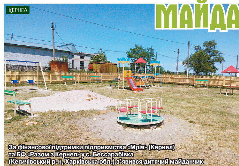
За фінансової підтримки підприємства «Мрія» (Кернел) та БФ «Разом з Кернел» у с. Бессарабівка (Кегичівський р-н, Харківська обл.) з'явився дитячий майданчик