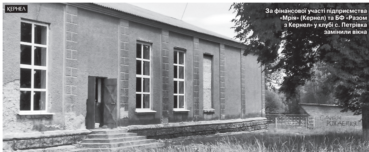
За фінансової участі підприємства «Мрія» (Кернел) та БФ «Разом з Кернел» у клубі с. Петрівка замінили вікна

«Осередок культури нашого села побудовано ще до Другої світової війни. Місцева влада та жителі систематично намагаються підтримувати заклад у належному стані. Нещодавно в нас проходив поточний ремонт сцени, на який направлено фінанси з сільської скарбниці та залучено кошти підприємства «Вишневе-Агро» (Кернел) і Благодійного фонду. За них ми придбали необхідні матеріали: шпаклівку та фарбу. Плануємо й надалі продовжувати процес поновлення Будинку культури, думаю, не без участі кернелівців. Крім того, хочу подякувати аграріям за інші важливі для нас проекти — за фінансову участь у проведенні поточних ремонтів установ соціальної сфери (у тому числі школи), за допомогу в розчистці доріг від снігу тощо».