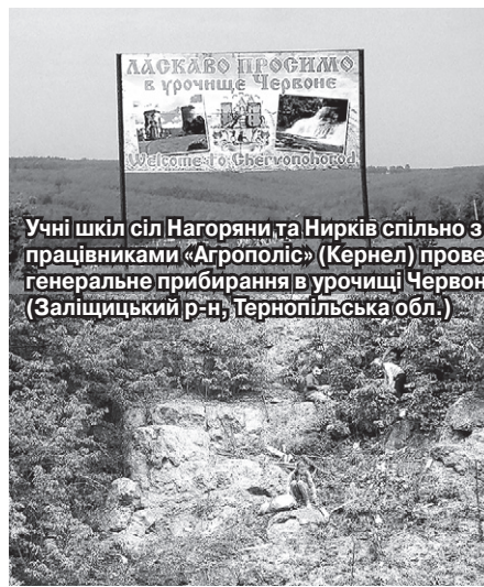
Учні шкіл сіл Нагоряни та Нирків спільно з працівниками «Агрополіс» (Кернел) провели генеральне прибирання в урочищі Червоному (Заліщицький р-н, Тернопільська обл.)

За кілька годин роботи з території вивезено чимало сміття та відходів, якими було всіяне урочище. На жаль, людська байдужість та недбалість призвела до того, що культурна та архітектурна спадщина місцями перетворилася на сміттєзвалище.