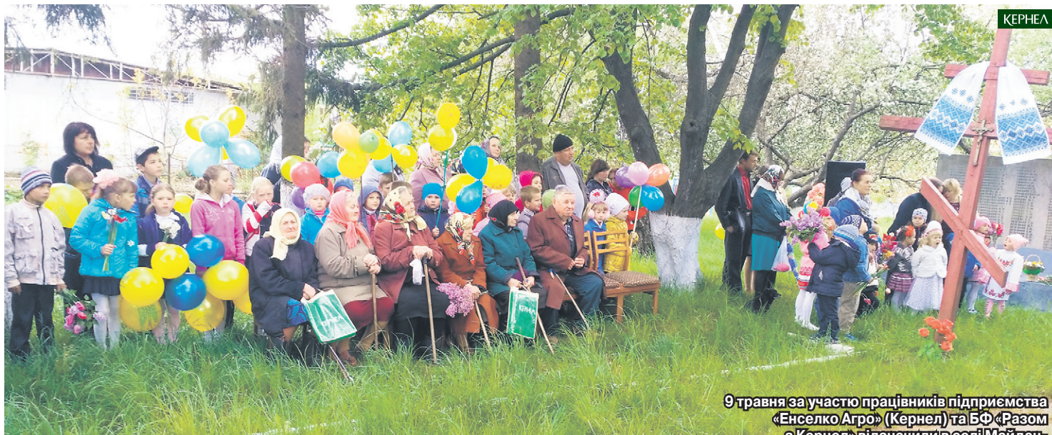
9 травня за участю працівників підприємства «Енселко Агро» (Кернел) та БФ «Разом з Кернел» відзначили в селі Майдан-Олександрівський (Віньковецький р-н, Хмельницька обл.)

Цьогоріч відповідно до звернень сільських громад у справі привітань був використаний індивідуальний підхід. Відтак від представників підприємства «Енселко Агро» (Кернел) та Благодійного фонду Ветерани, учасники бойових дій та солдатські вдови зі Старокостянтинівського, Старосинявського, Волочеського, Красилівського, Славутського, Полонського районів Хмельниччини отримали продуктові набори. Визволителям, які мешкають у Дунаєвецькому, Чемеровецькому, Кам'янець-Подільському, Новоушицькому, Ярмолинецькому, Віньковецькому, Городоцькому районах області, кернелівці презентували комплекти рушників. На Тернопільщині підприємство «Агрополіс» (Кернел) до свята надало Ветеранам адресну допомогу. Крім того, Компанія направляла кошти на придбання вінків для покладання до меморіалів Слави та братських могил. Загальний бюджет витрат на привітальний проект до 9 травня у регіоні склав понад 135 тис. грн.