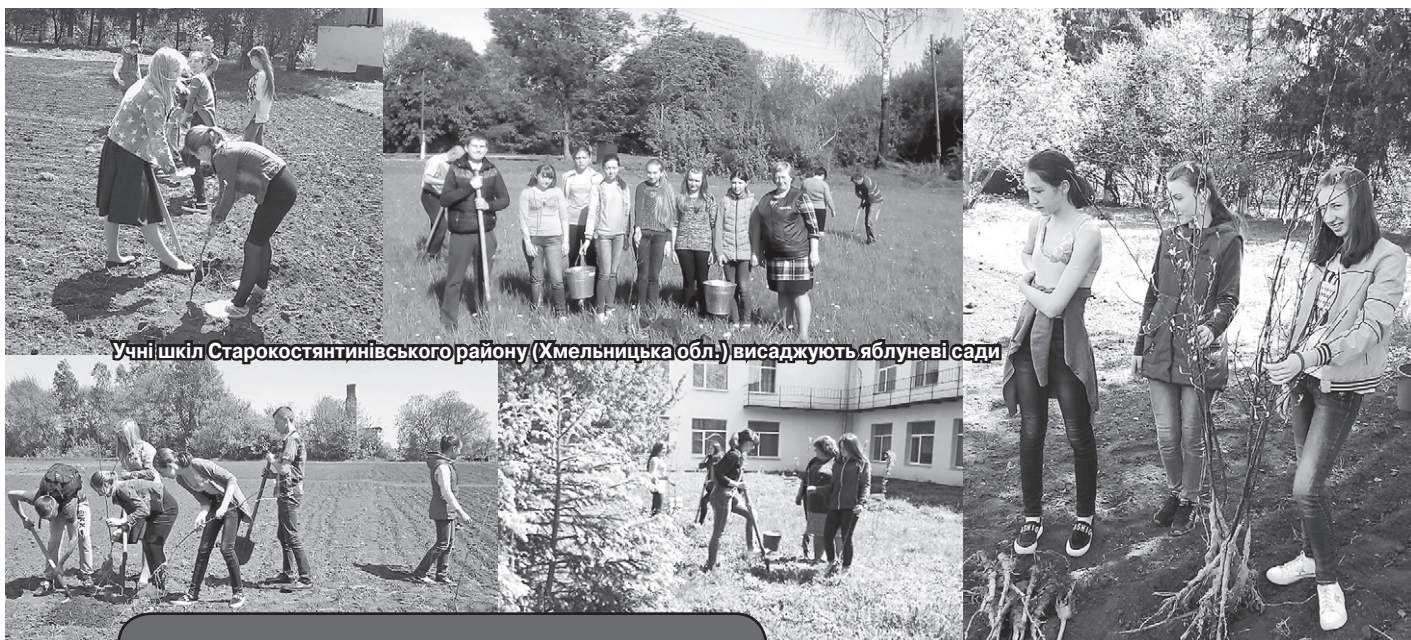
Учні шкіл Старокостянтинівського району (Хмельницька обл.) висаджують яблуневі сади

Разом із представниками Компанії дітки залюбки взялися за справу висадки дерев. Для когось це перший досвід, а хтось виявився справжнім професіоналом. Але головне те, що завдяки спільній роботі земля отримала додаткову порцію кисню, а майбутні покоління школярів зможуть ще й поласувати смачними плодами.