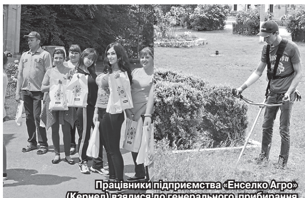
Працівники підприємства «Енселко Агро» (Кернел) взяли участь у генеральному прибиранні природоохоронної зони села Маліївці (Дунаєвецький р-н, Хмельницька обл.)

У весняний період у більшості українських сіл і містечок проходили місячники з благоустрою. До робіт із прибирання та облагородження територій залюбки приєдналися працівники кернелівських агропідприємств. Для цього в Компанії оголосили еко-акцію «Зелена весна Кернел». Про підсумки її проведення на Хмельниччині й Тернопільщині — у наших добірках.