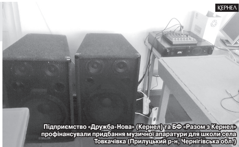
Підприємство «Дружба-Нова» (Кернел) та БФ «Разом з Кернел» профінансували придбання музичної апаратури для школи села Товкачівка (Прилуцький р-н, Чернігівська обл.)

чівської сільради, розповідає, що з представниками підприємства «Дружба-Нова» (Кернел) можна знайти спільну мову, розраховувати на пораду та підтримку.