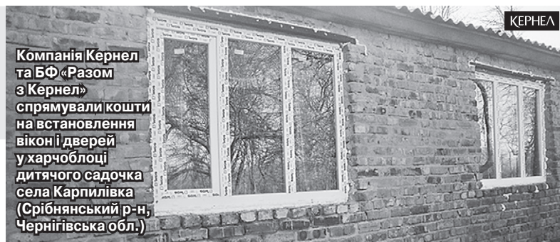
Компанія Кернел та БФ «Разом з Кернел» спрямували кошти на встановлення вікон і дверей у харчоблоці дитячого садочка села Карпилівка (Срібнянський р-н, Чернігівська обл.)

ся повести реконструкцію шкільної котельні з частковою заміною труб, яка забезпечує в тому числі обігрів дитячого навчального закладу.