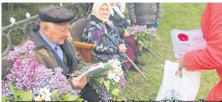
Вітання від підприємства «Дружба-Нова» (Кернел) та БФ «Разом з Кернел» приймають Ветерани села Берестовець (Борзнянський р-н, Чернігівська обл.)