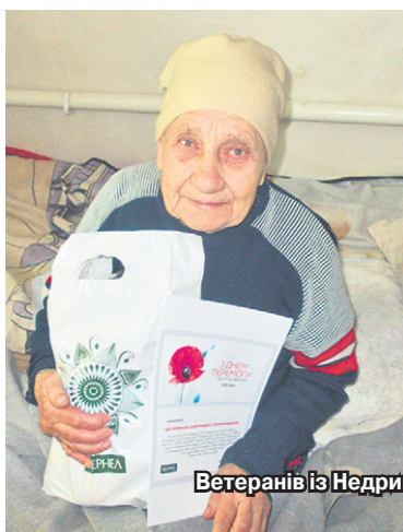
Ветеранів із Недригайлівського та Роменського районів (Сумська обл.) привітали представники «Дружба-Нова» (Кернел)