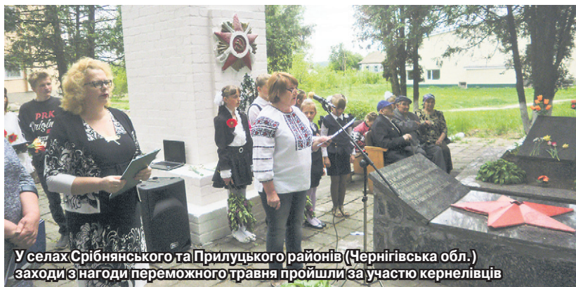
У селах Срібнянського та Прилуцького районів (Чернігівська обл.) заходи з нагоди переможного травня пройшли за участю кернелівців

Традиційно Ветерани приймали вітання від компанії Кернел та Благодійного фонду «Разом з Кернел». Із рук представників підприємства «Дружба-Нова» (Кернел) та Благодійного фонду 170 Ветеранів, учасників бойових дій, солдатських вдів із Чернігівської, Сумської та Полтавської областей отримали продуктові набори на суму 34 тис. грн. До таких наборів увійшли олія, крупи, печиво, консерви, згущене молоко тощо.