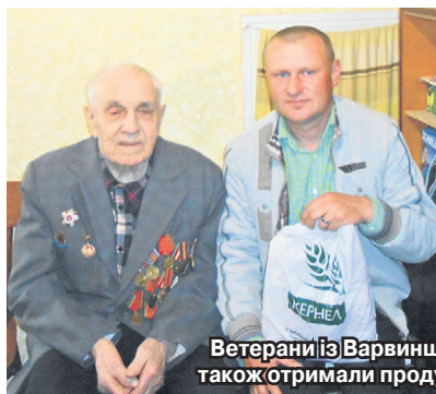
Ветерани із Варвинщини (Чернігівська обл.) також отримали продуктові набори від Кернел