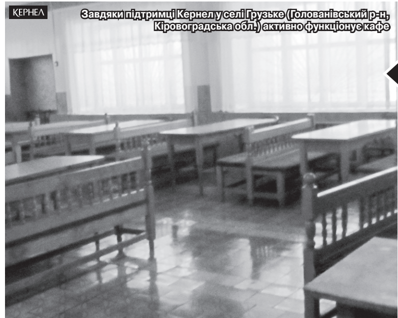
Завдяки підтримці Кернел у селі Грузьке (Голованівський р-н, Кіровоградська обл.) активно функціонує кафе