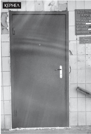
Завдяки коштам від Кернел нові двері встановлено в установах соціальної сфери села Товкачівка (Прилуцький р-н, Чернігівська обл.)

Громада села Товкачівка (Прилуцький р-н, Чернігівська обл.) має багаторічний досвід співпраці з підприємством «Дружба-Нова» (Кернел) та БФ «Разом з Кернел». За фінансової участі Компанії тут реалізовано чимало корисних для соціальної сфери сіл проектів.