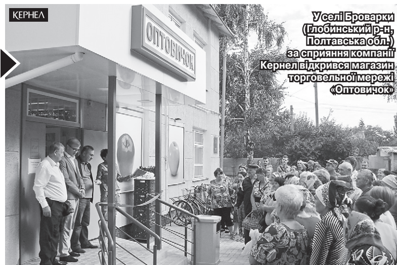
У селі Броварки (Глобинський р-н, Полтавська обл.) за сприяння компанії Кернел відкрився магазин торговельної мережі «Оптовичок»

І така позиція справді важлива. Адже в даному випадку відкриття магазину — один із принципових кроків, зроблених у напрямку добробуту селян, оскільки це дозволить місцевим мешканцям купувати якісну та свіжу продукцію за конкурентними цінами, а ще — це нові робочі місця.