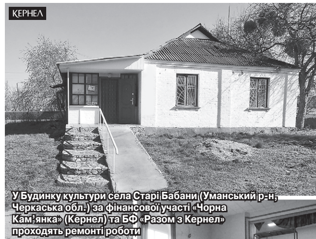
У Будинку культури села Старі Бабани (Уманський р-н, Черкаська обл.) за фінансової участі «Чорна Кам'янка» (Кернел) та БФ «Разом з Кернел» проходять ремонтні роботи