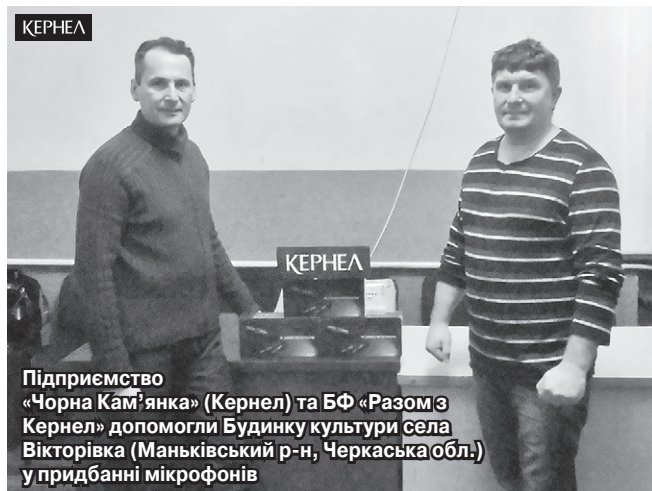
Підприємство «Чорна Кам'янка» (Кернел) та БФ «Разом з Кернел» допомогли Будинку культури села Вікторівка (Маньківський р-н, Черкаська обл.) у придбанні мікрофонів