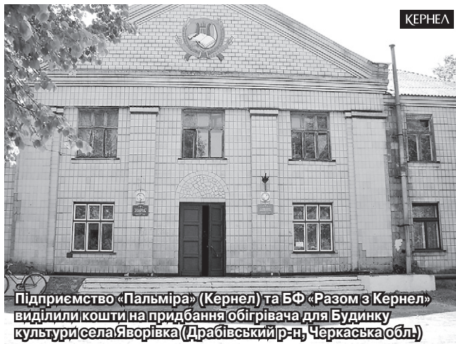
Підприємство «Пальміра» (Кернел) та БФ «Разом з Кернел» виділили кошти на придбання обігрівача для Будинку культури села Яворівка (Драбівський р-н, Черкаська обл.)