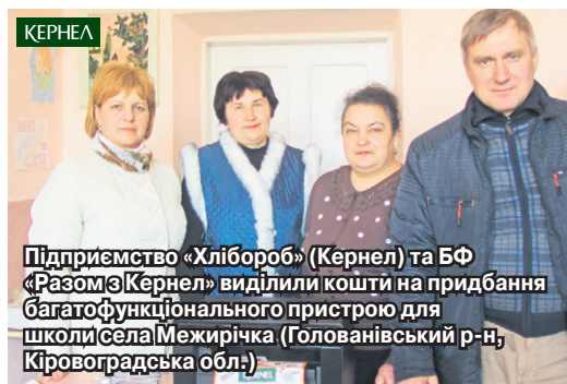
Підприємство «Хлібороб» (Кернел) та БФ «Разом з Кернел» виділили кошти на придбання багатофункціонального пристрою для школи села Межирічка (Голованівський р-н, Кіровоградська обл.)

«Розпочну зі слів подяки на адресу підприємства «Хлібороб» (Кернел) та БФ «Разом з Кернел» за фінансову допомогу у придбанні та встановленні чотирьох вікон у приміщенні нашого ДНЗ «Світлячок». Справа в тому, що вікна тут не заміняли ще з часів введення будівлі в експлуатацію, а це було в 1961 році. Тому існувала гостра потреба у цьому проєкті, оскільки тепло та затишок — головні умови, які повинен гарантувати заклад дітям. Наразі замінено віконні конструкції у двох спальних кімнатах. Приємно, що Компанія посприяла реалізації такої важливої справи».