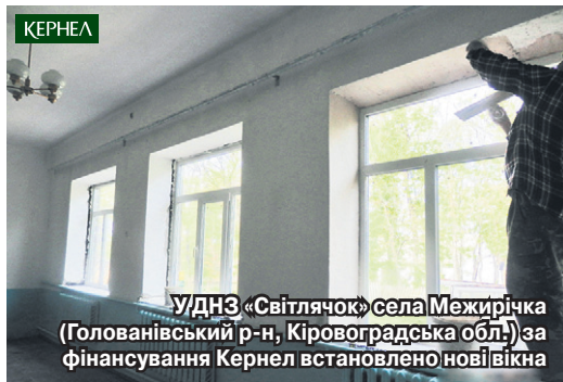
У ДНЗ «Світлячок» села Межирічка (Голованівський р-н, Кіровоградська обл.) за фінансування Кернел встановлено нові вікна