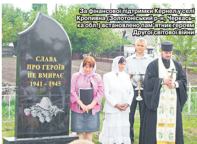
За фінансової підтримки Кернел у селі Кропивна (Золотоніський р-н, Черкаська обл.) встановлено пам'ятник героям Другої світової війни

Підприємства Кернел — «Хлібороб», «Урожай», «Осіївське», «Зоря», «Чорна Кам'янка» — вітали ветеранів війни — мешканців підопічних сіл продуктовими наборами та комплектами рушників із логотипами Компанії. Такі подарунки отримало 19 ветеранів і 35 солдатських вдів. Також підприємства «Агросервіс» (Кернел) і «Зоря» (Кернел) направляли кошти на придбання вінків для покладання біля меморіалів Слави. Бюджет витрат склав понад 28 тис. грн.