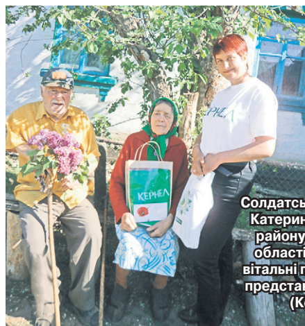
Солдатські вдови із сіл Катеринопільського району Черкаської області отримують вітальні подарунки від представників «Зоря» (Кернел)