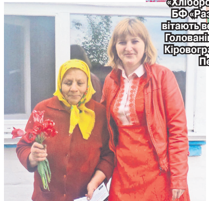
Представники підприємства «Хлібороб» (Кернел) та БФ «Разом з Кернел» вітають Ветеранів війни з Голованівського району Кіровоградщини з Днем Перемоги