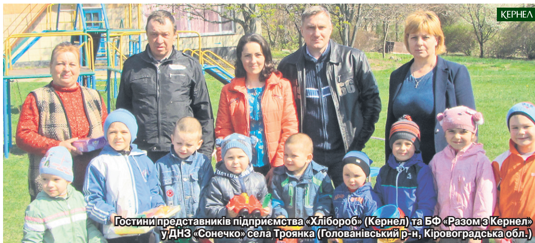
Гостини представників підприємства «Хлібороб» (Кернел) та БФ «Разом з Кернел» у ДНЗ «Сонечко» села Троянка (Голованівський р-н, Кіровоградська обл.)

«Для того щоб забезпечити харчування всіх без винятку дітей нашої школи (а сьогодні у нас навчається 61 учень), ми спільно з підприємством «Урожай» (Кернел) розпочали реалізацію відповідного проекту. Підприємство уклало з постачальником угоду, згідно з якою йому перераховується кошти, а ми на цю суму беремо продовольчі товари. Та-