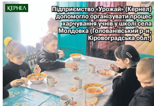
Підприємство «Урожай» (Кернел) допомогло організувати процес харчування учнів у школі села Молдовка (Голованівський р-н, Кіровоградська обл.)