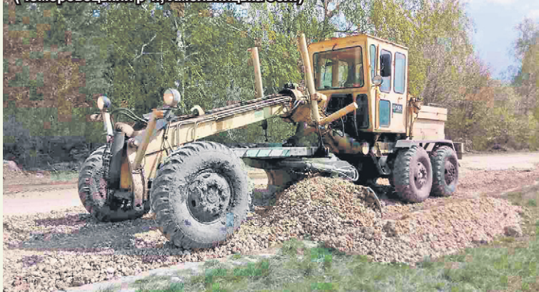
Підприємство «Енселко Агро» (Кернел) допомогло привести до ладу транспортну артерію між селами Залуччя та Степанівка (Чемеровецький р-н, Хмельницька обл.)

З а кошти Кернел було надано послуги із грейдерування дороги між селами Залуччя та Степанівка Чемеровецького району (вивезли 180 т щебеню транспортом підприємства «Енселко Агро» (Кернел)). А для громади Вівсянської сільради вказаного району виділено