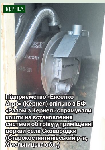
Підприємство «Енселко Агро» (Кернел) спільно з БФ «Разом з Кернел» спрямували кошти на встановлення системи обігріву у приміщенні церкви села Сквородки (Старокостянтинівський р-н, Хмельницька обл.)