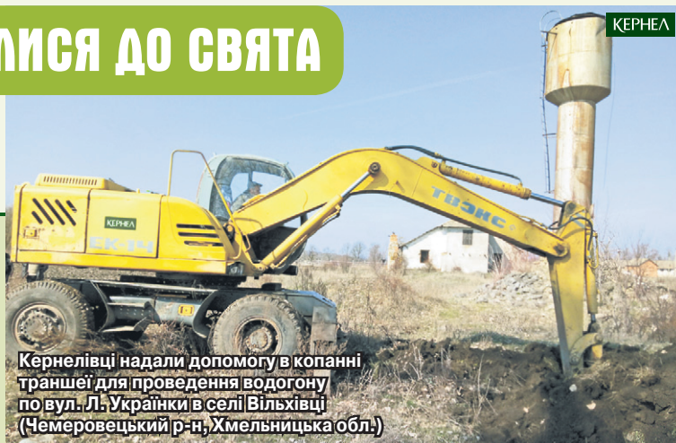
Кернелівці надали допомогу в копанні траншеї для проведення водогону по вул. Л. Українки в селі Вільхівці (Чемеровецький р-н, Хмельницька обл.)

! За роки роботи Кернел направив понад півмільйона гривень на розвиток соціальної сфери сіл Вільховецької сільради. Лише торік Компанія допомогла в будівництві водопроводу (42 тис. грн), виділила кошти на ремонт спортивної зали школи (50 тис. грн), профінансувала спорудження ігрового майданчика біля дитячого садочка «Сонечко» (26 тис. грн) тощо.