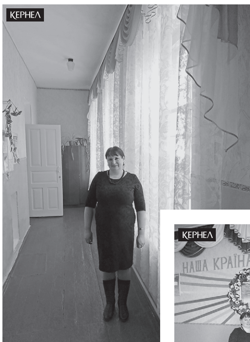
Школа села Колісники (Ніжинський р-н, Чернігівська обл.) одержала черговий подарунок від підприємства «Дружба-Нова» (Кернел) та БФ «Разом з Кернел» — ламбрекени для облаштування віконних конструкцій

Педагогічний, учнівський та батьківський колективи Колісниківської ЗОШ дякують компанії Кернел та БФ «Разом з Кернел» за те, що допомагають створювати комфортні умови в закладі, за те, що працюють з думкою про дітей!