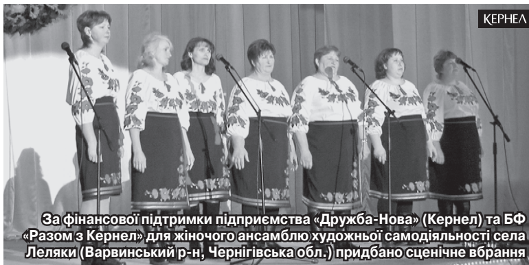
За фінансової підтримки підприємства «Дружба-Нова» (Кернел) та БФ «Разом з Кернел» для жіночого ансамблю художньої самодіяльності села Леляки (Варвинський р-н, Чернігівська обл.) придбано сценічне вбрання

— Кернел добре відомий у нашому селі не тільки як вправний орендар, але й як помічник у вирішенні найактуальніших питань соціальної сфери, — продовжує наша співрозмовниця. — Раніше Компанія допомагала нам у благоустрої, у придбанні матеріалів для проведення ремонтних робіт у бюджетних установах села, також за кошти кернелівців у Будинку культури було закуплено музичну апаратуру — колонки, підсилювачі, мікрофони. До речі, саме кернелівці не раз забезпечували транспорт для творчих