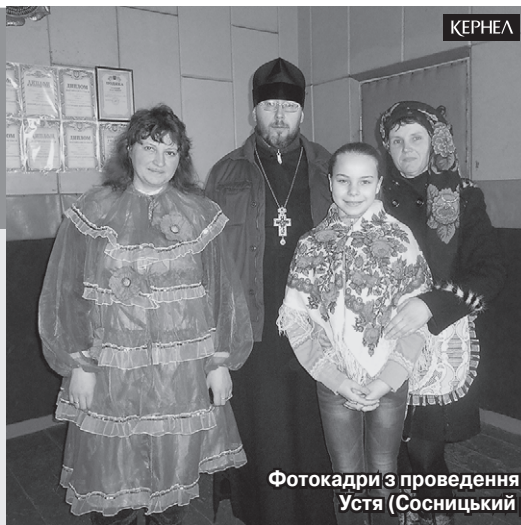
Фотокадри з проведення свята Масляної у селі Велике Устя (Сосницький р-н, Чернігівська обл.)

Традиційно за тиждень до Великого посту в Україні відзначають Масляну. Цьогоріч її святкували і в селі Велике Устя, що в Сосницькому районі Чернігівської області. Захід пройшов за підтримки сільської влади, а також спонсорів та благодійників. Серед яких — підприємство «Дружба-Нова» (Кернел) та БФ «Разом з Кернел».