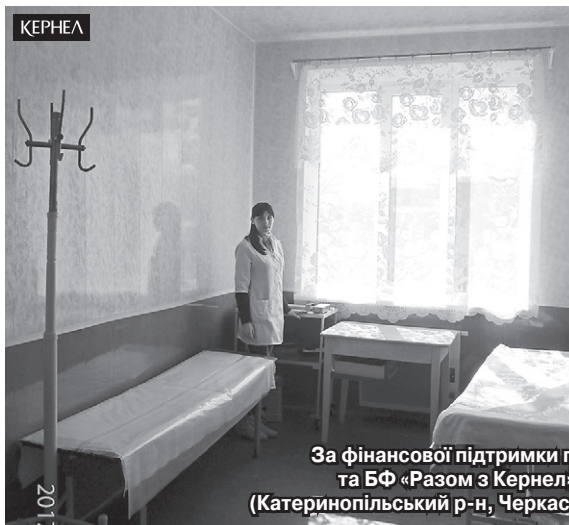
За фінансової підтримки підприємства «Зоря» (Кернел) та БФ «Разом з Кернел» у ФАПі села Лисича Балка (Катеринопільський р-н, Черкаська обл.) тривають ремонтні роботи