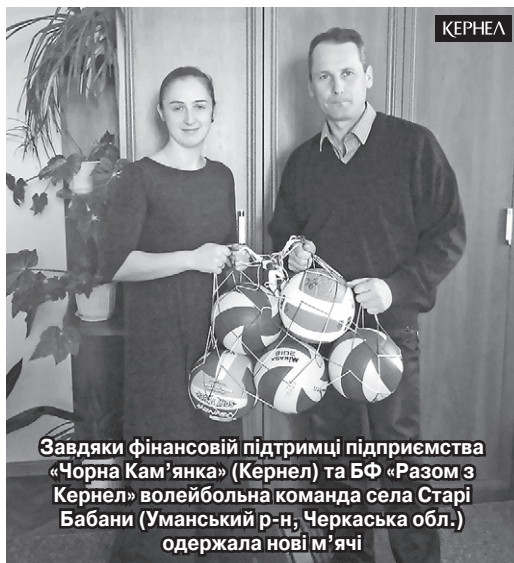
Завдяки фінансовій підтримці підприємства «Чорна Кам'янка» (Кернел) та БФ «Разом з Кернел» волейбольна команда села Старі Бабани (Уманський р-н, Черкаська обл.) одержала нові м'ячі

«Найспортивніше село» вже стало традиційним заходом для Маньківщини. Змагання проходять щороку, проте змінюється місце проведення. Цього разу гостей приймала Вікторівка й наш навчальний заклад. За звання найкмітливіших і найспортивніших змагалися команди з семи сіл: Нестерівка, Добра, Подібна, Молодецьке, Роги, Потах та Вікторівка. Свою майстерність та волю до перемоги учасники демонстрували у стрільбі з пневматичної зброї, кегельбані, підтягуванні на перекладині, гирьовому спорті, перетягуванні канату, дартсі, грі в шашки та шахи, а також у естафеті «Найспортивніша сім'я». За резуль-