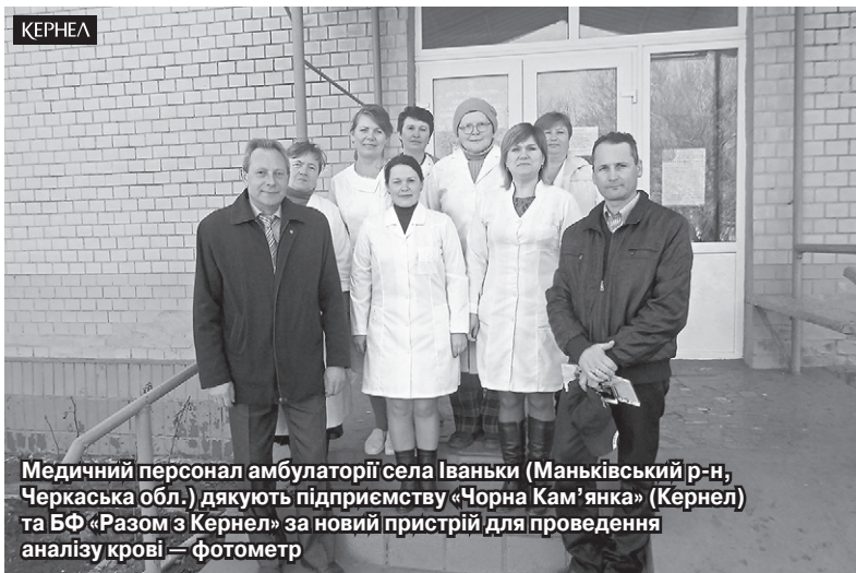
Медичний персонал амбулаторії села Іваньки (Маньківський р-н, Черкаська обл.) дякують підприємству «Чорна Кам'янка» (Кернел) та БФ «Разом з Кернел» за новий пристрій для проведення аналізу крові — фотометр