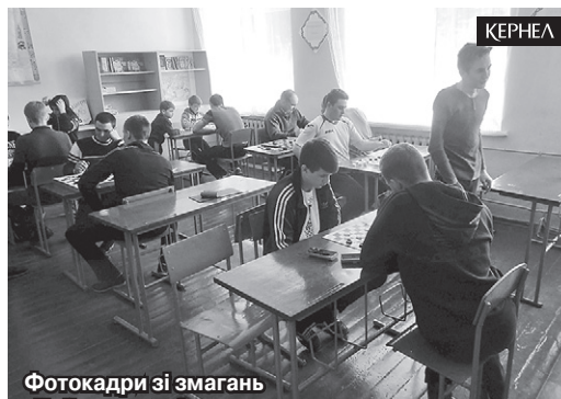
Фотокадри зі змагань «Найспортивніше село», які проходили у Вікторівці (Маньківський р-н, Черкаська обл.)

«Наша команда створена завдяки ініціативності та активності жителів села, зокрема молодого