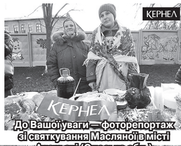
До Вашої уваги — фоторепортаж зі святкування Масляної в місті Ананьєві (Одеська обл.)

чудовою випічкою, а ще — взяти участь у іграх, конкурсах, народних танцях, спаленні опудала зими. Переконана, присутні весело та з користю провели час. Дякую всім благодійникам за допомогу! А також учасникам дійства — за те, що приєдналися до святкування!